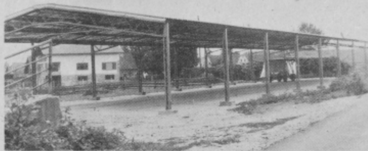
Skelet bodoče skladiščne stavbe, kjer bodo kooperanti lahko kupili vse od napajalnikov, krmilnikov, ventilatorjev do plinskih kokeljev.

Večina kolektivov je sklenila prispevati po 2 odstotka, kolektiv Opekarnar Zabajak bo prispeval 2 in pol odstotka, kolektiv krajevske skupnosti Ptuj pa je že nakazal 4 odstotke od enomesečnega zasluzka vseh zaposlenih; prav tako Variete, Zagreb.