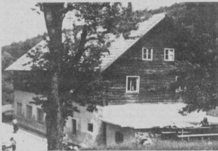
Planinski dom na Boču pritegne vsako leto veliko število planincev iz Slovenije in tudi iz sosednjih dežel.

opravili blizu 200 udarniških ur in ob koncu akcije ugotovili, da so s tem v veliki meri olepšali zunanji del doma, s svojim delom pa so prihranili okoli 1 milijon SD.