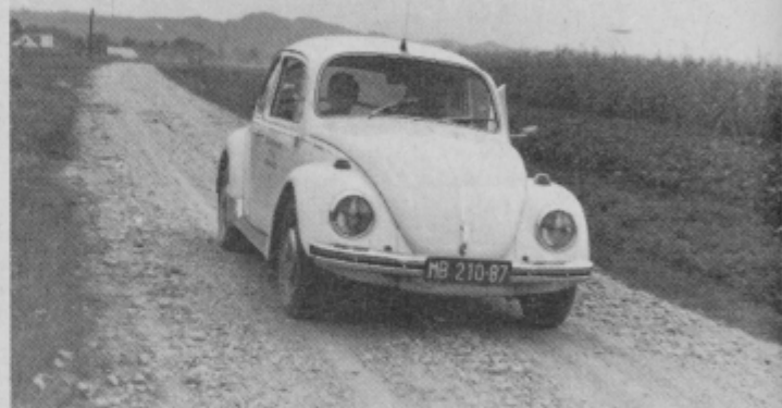
Automobil z dežurnim zdravnikom lahko srečamo sedaj tu, sedaj tam.

Obiskali smo še bolnika, kateremu smo dali injekcijo morfija, nato pa spet nazaj proti Ptuj. Tedaj nas je