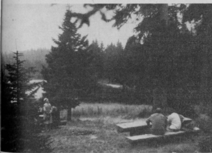
Počitek v naravi je prijeten še posebno v okolju, kakršnega nudi Črno jezero.

jezero z okolico nudilo edinstveno doživetje — sveže okolje in tišino. Ob poletnih dneh se mnogi v jezeru tudi skopajo. Ob njem pa je mogoče opaziti tudi kakšen šotor. Voda v jezeru ni ravno topla niti v najbolj vročih dneh. Gotovo pa je