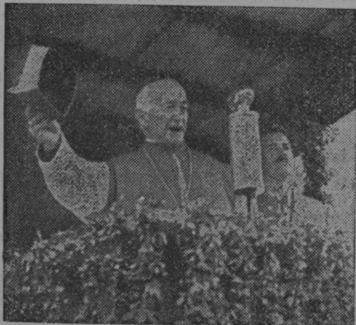
Nadškof dr. Jeglič govori z navdušenjem na taboru v Celju.

Ob pol devetih je pričel urejen slavnostni sprevod fantov in mož. Od Glazije se je vila dolga povorka skozi Gregorčičevo,