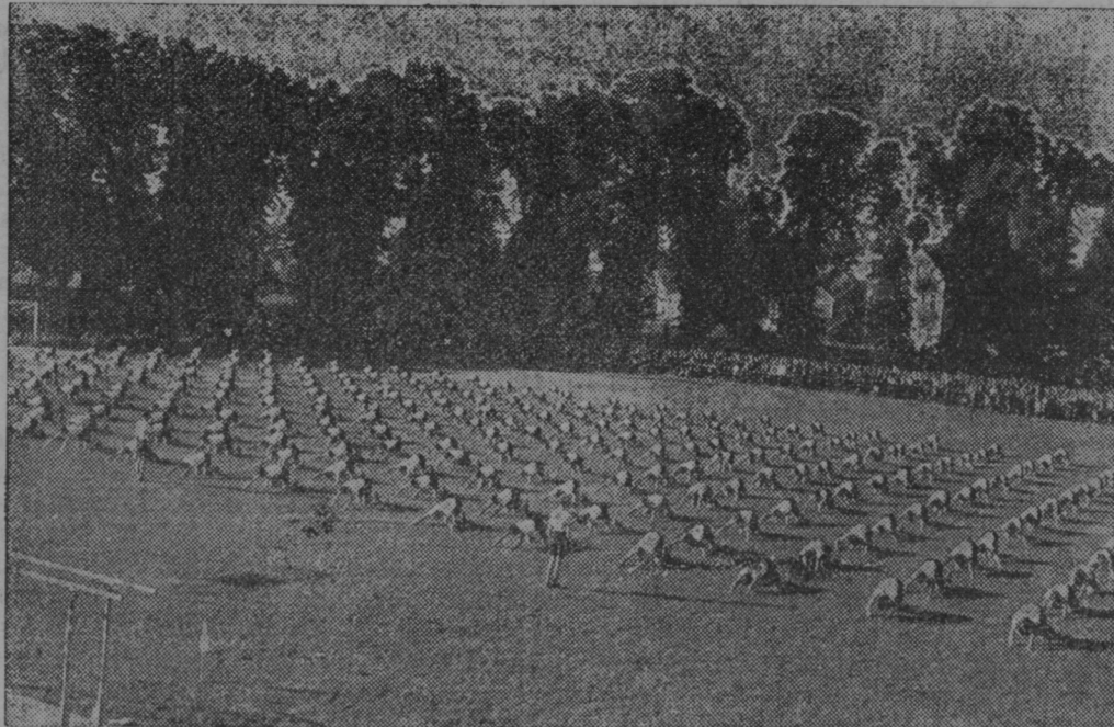
Naši fantje na telovadišču na celjskem taboru.