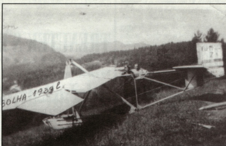
Lajše 1939. leta. Bolha pred poletom.