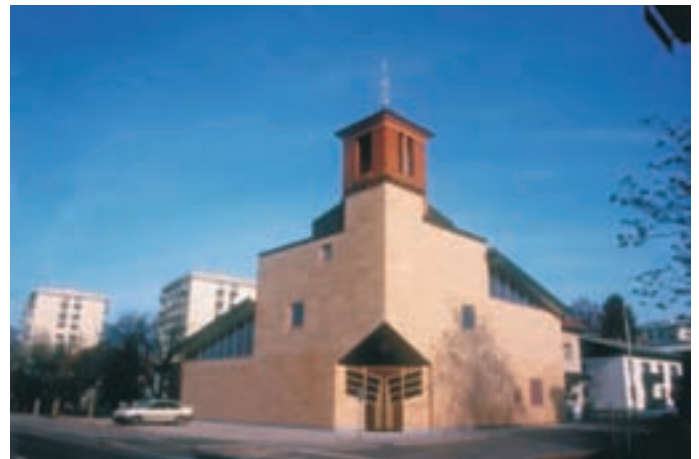
Slika 4: Pogled z vogala. Corner view.