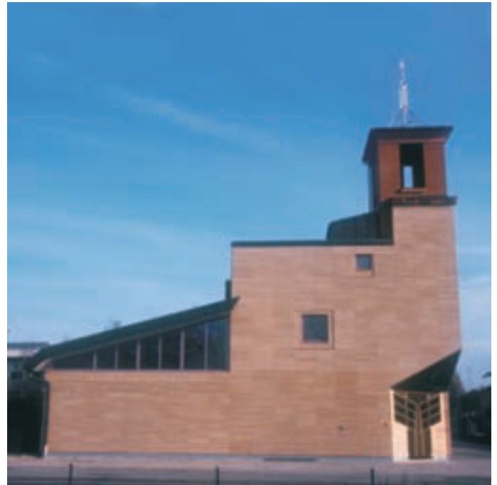
Slika 3: Zahodna fasada. West elevation.