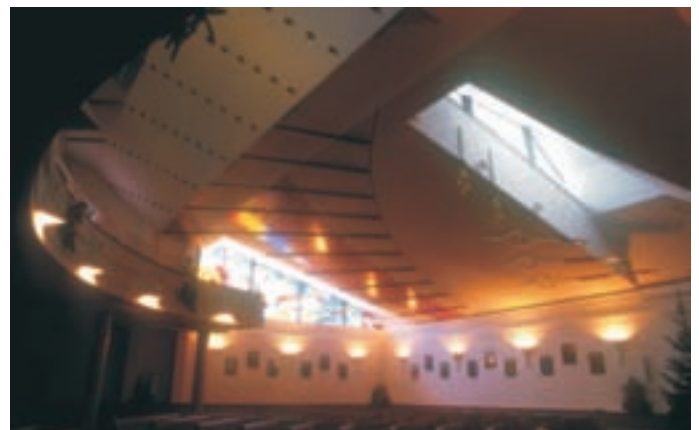
Slika 5: Strop nad osrednjim prostorom. The ceiling above the main hall.