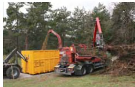
Stroj za izdelavo sekancev na terenu

izkoriščamo možnosti gospodarskega izkoriščanja lesa, še posebej pa oplemenitenja v dodelavi namesto prodaje lesa kot surovine v tujino.