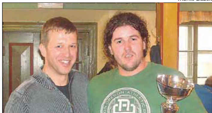
Predaja pokala zmagovalcem KŠD Draga