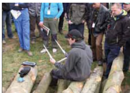
Elektronsko merilo za hiter izračun posekanega lesa

izkoriščamo možnosti gospodarskega izkoriščanja lesa, še posebej pa oplemenitenja v dodelavi namesto prodaje lesa kot surovine v tujino.