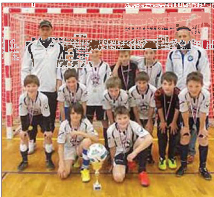
Prvaki ekipa Velikih Lašč