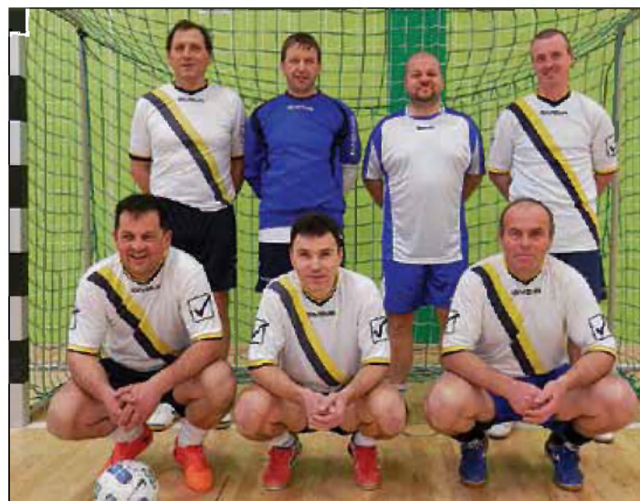
Ekipe NK Velike Lašče veterani

V novi športni dvorani v Sodražici je bila v minuli zimi prvič organizirana veteranska futsal liga. Nastopilo je pet ekip, med njimi tudi veteranska ekipa NK Velike Lašče. Tekmovanje je bilo dvokrožno, tako da je vsaka ekipa odigrala po osem tekem. Vse tekme so bile zanimive in zelo izenačene. Od skupaj 18 odigranih tekem se jih je namreč kar tretjina končala neodločeno, v odločenih tekmah pa je bila samo trikrat razlika 3 ali 4 gole v prid zmagovalcem.