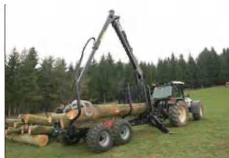
Samonakladalna prikolica z daljinskim upravljanjem

Po predstavitvi je vse udeležence čakal dober domač golaž, ki so ga prav tako pripravili na kmetiji Zgonec.