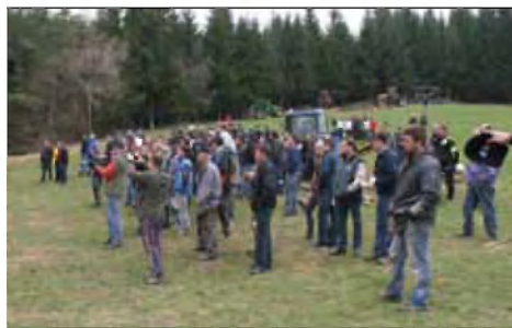
Več kot sto udeležencev je z zanimanjem spremljalo vse predstavitve