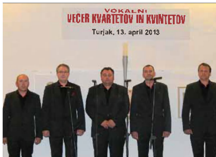
Quercus Quintet iz Goriških brd

Že šesto leto zaporedoma smo bili na Turjaškem gradu priča lepemu prepevanju in čudovitim glasovom slovenskih mož in fantov. Na šesti prireditvi Večer kvartetov in kvintetov, ki je potekala v Viteški dvorani, se je zbralo šest kvartetov in kvintetov.