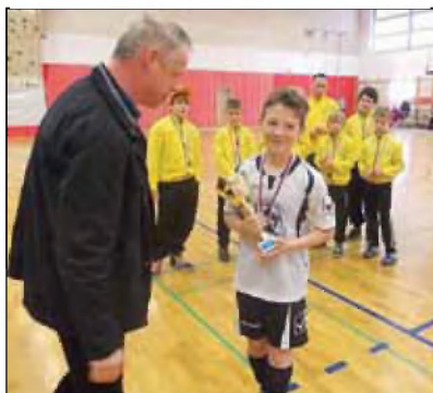
Kapetan Velikih Lašč