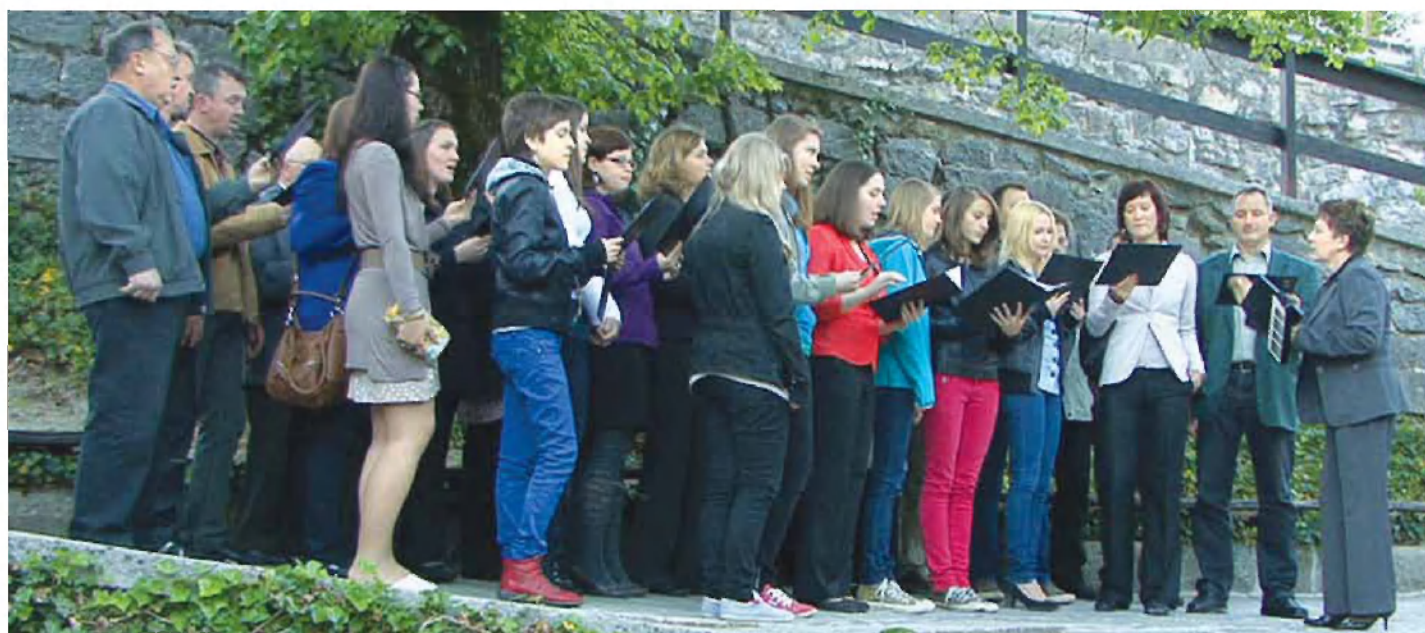
Cerkveni MePZ župnije Velike Lašče