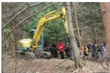
Stroj za sekanje in nalaganje lesa

Mogoče ni odveč na tem mestu ponovno ugotoviti, da Slovenci premalo