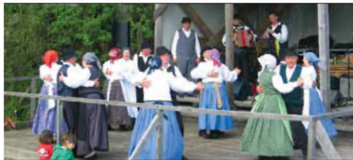
Nastop folklorne skupine Blagovna