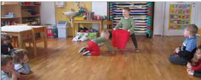
Spoznali smo prave španske bikoborbe.

Dotaknili smo se Španije s pomočjo glasbe, plesa in instrumentov ter pričarali vtis bikoborb.