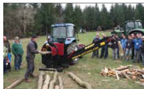
Učinkovit sekalnik za pripravo cepljenih drv