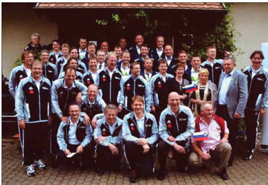
Slovenski in nemški župani

na lesno biomaso), medtem ko v občini porabijo 7 MWh električne energije in 12 MWh toplote. Kot primer dobre prakse je nemški župan izpostavil dejstvo, da je večina elektrarn v lasti občanov, saj so se odločili za združni sistem.