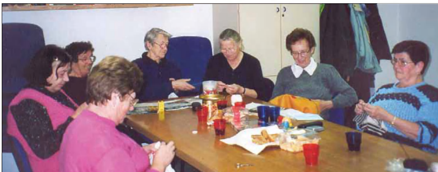
Naša prva druženja v prostorih občinske stavbe