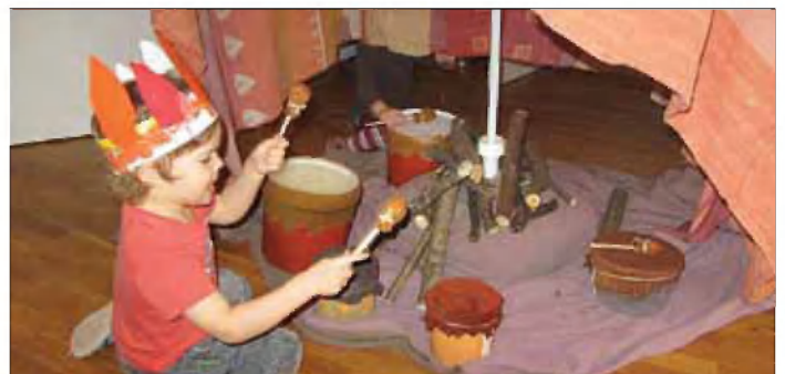
Igra na bobne v tipiju je zelo zabavna.

bobne in trstenke, se igrali z loki, pripravili »oganj«, zaplesali ob indijanski glasbi, izdelali perjanico, vazo in peščeno sliko.