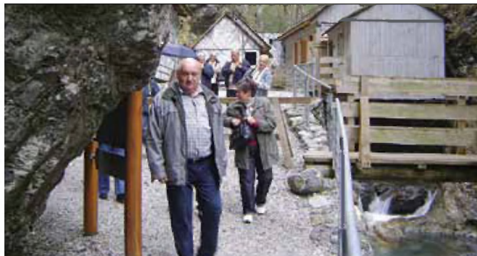
Med obiskom bolnišnice Franja

Kar zgodaj smo se pripeljali v Škofjo Loko, si jo malo ogledali kar z avtobusa in ugotovili, da zanjo potrebujemo cel dan in da bo to mogoče izlet za »drugič«. Zato pa smo se ustavili v 4 km oddaljeni vasici Crngrob in obiskali romarsko cerkev, ki prevladuje na hribčku. Lokalna vodička je ugotovila, da nobene skupine ni imela že tako zgodaj zjutraj in »vsa sveža« je pripravila res dobro predavanje. Že pri urah umetnostne zgodovine sem poslušala o biserčku te sakralne arhitekture, poslikav in opreme in obnovila pozabljeno znanje.