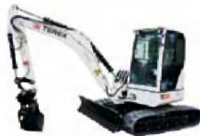
MINIBAGER 6 TON

IZKOPI PREVOZI S KIPERJEM GRADBENA DELA UREDITEV DVORIŠČ ASFALTIRANJE PRODAJA IN VGRADNJA ČISTILNIH NAPRAV