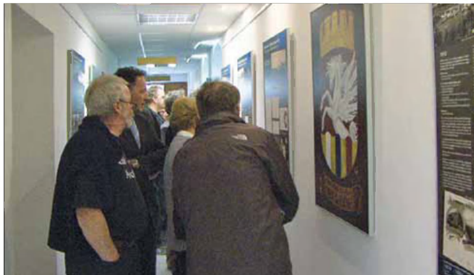
Ob odprtju razstave v občinski stavbi