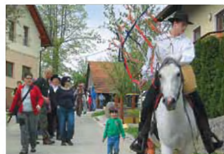
Zeleni Jurij na pohodu

Pod bližnjim Zoretovim kozolcem so si obiskovalci lahko ogledali nekaj starih opravil, pod novim Zabukovčevim kozolcem pa stalno zbirko starega kmečkega orodja. Otroci so se zabavali s pastirskimi igrami, še posebej so bili navdušeni nad samostojno pripravo hrane, saj so si nad ognjem na palicah sami spekli hrenovke in kruh. Ob 18. uri je v pomoč pomladnemu soncu zagorel