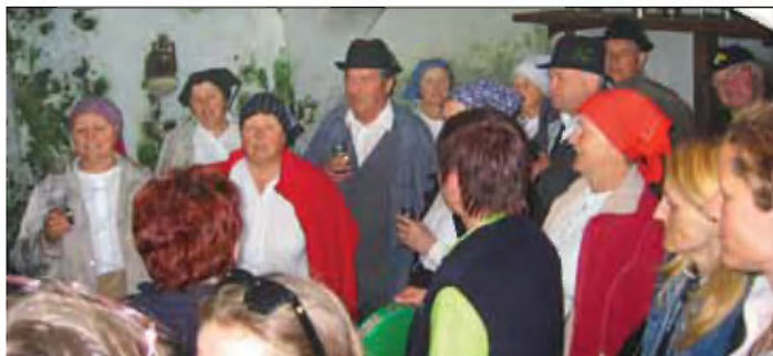
Petje v stari Koroščevi kleti