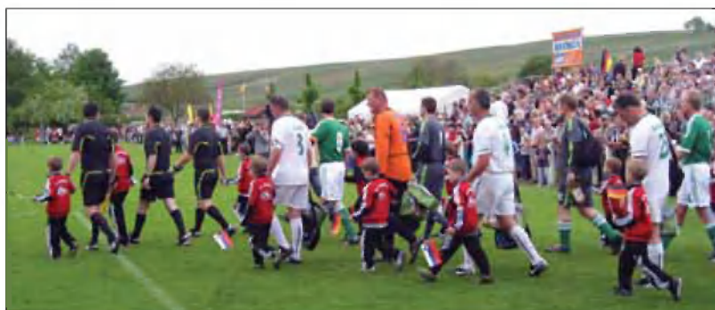
Prihod reprezentanc na igrišče