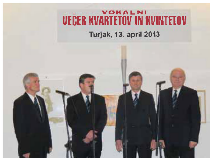
Planika iz Škofljice