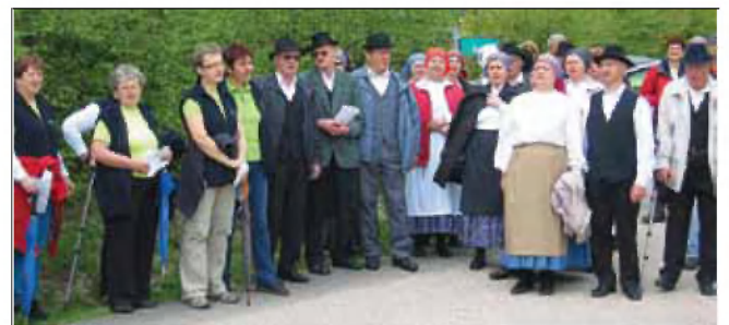
Ubrano petje pred pohodom