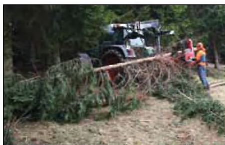
Švedski priključek za obsekovanje vej