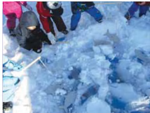
Kdo bo ujel več rib?

Vživelimo se tudi v življenje Eskimov (Inuitov), spoznali njihova oblačila ter polarne živali. Zgradili smo iglu na snegu in lovili ribe.