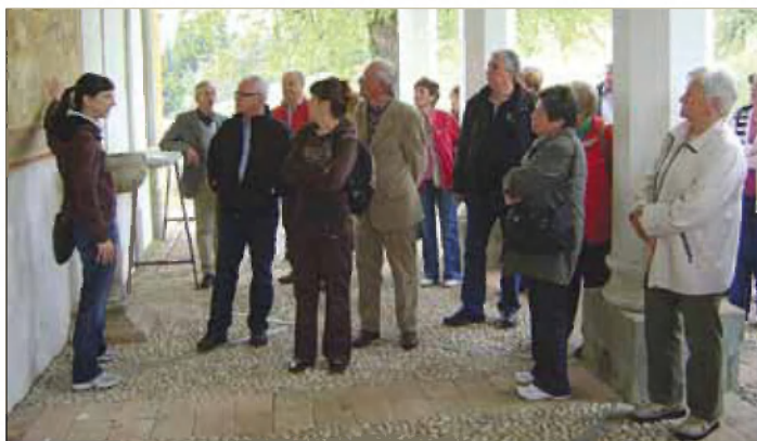
Predavanje v Crngrobu