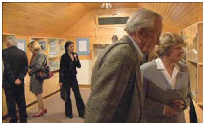
Z razstave v čitalnici na Trubarjevi domačiji