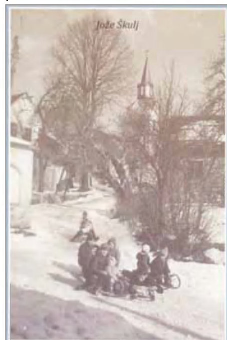
Vaško sankanje na klancu 1967. leta