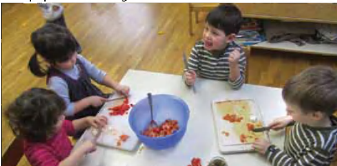
Kaj je dobra, kako zdrava je grška solata!

Preverili smo tudi, kako dobro znamo zaplesati grški Sirtaki, in si sami pripravili okusno grško solato.