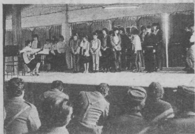
Proslava v prostorih vojašnice na Velikih Blokah — teritorialcem so jo pripravili učenci OŠ Toneta Trtnika-Tomaža iz Sostrega