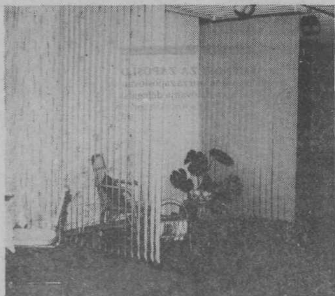
Del ambience v novih prostorih steljeja tozd Veta