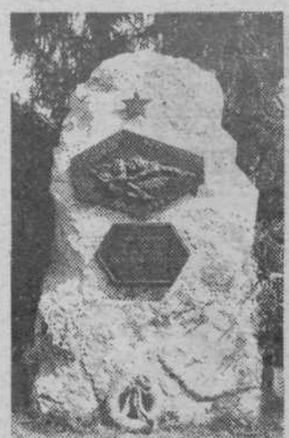
Obeležje Dolenjskemu odredu