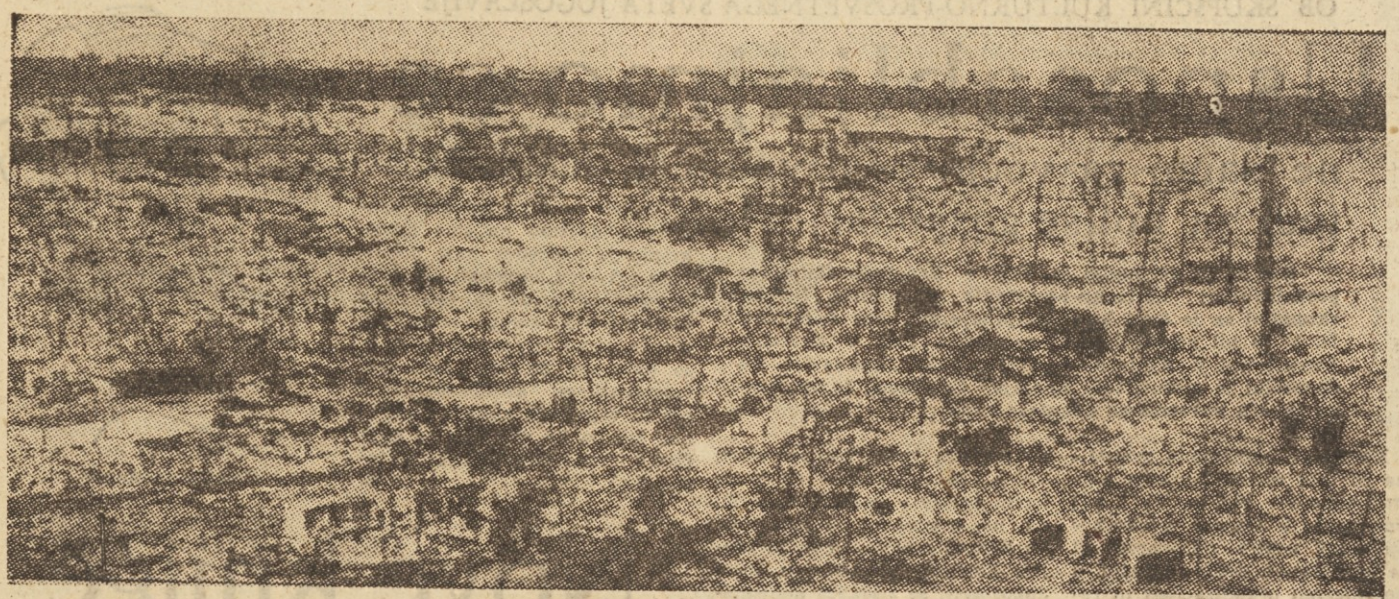
Hirošima: uničenje v desetmilijoniki sekunde