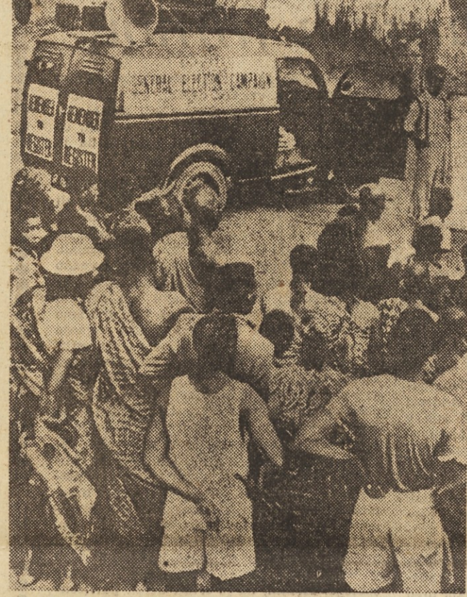
Tako so prebivalci mlade afriske države Gane volili svoj parlament

bijka naj bi ostal v podjetju, v katerem bi lahko z le-tim samostojno razpolagali, delji pa bi naj ga sindikat ob sodelovanju vsega članstva. Vse to so posebno pozdravili delavci, za katere so bile vse te misli povsem nove in so pomenile prekinitev z vso dotedanja prakso. Na temelju tega so se pojavile tudi odkrite misli o potrebi večjega sodelovanja širših delovnih množic in upravljanju proizvodnje. To je edina vsebina in tudi okvir za vse debate na omenjenem plenumu sovjetskih sindikatov, ki je prišel z delom 12. t. m. O tem je govoril tudi predsednik sovjetskih sindikatov Grišin. V svojem govoru je dejal, da bodo pane podjetij obravnavali na skupnih sindikalnih konferencah v podjetjih in še posebej na proizvodnih posvetovanjih. Opozoril je na potrebo boja proti birokraciji, predvsem v