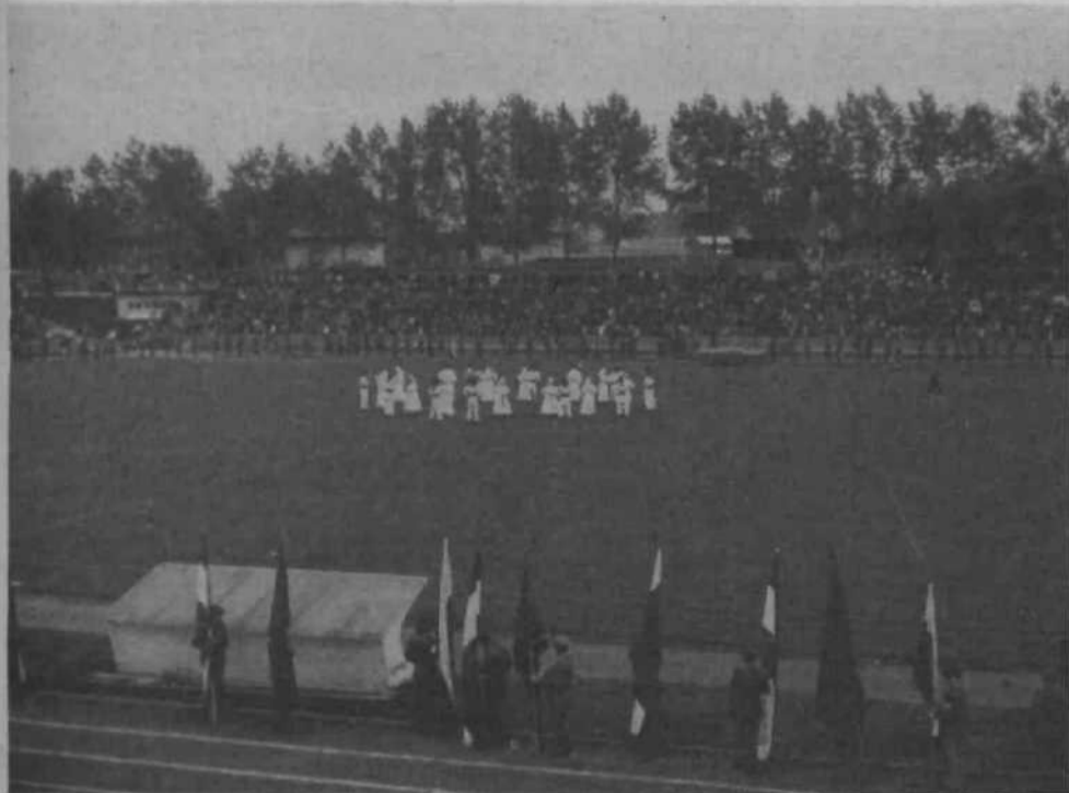
ŠTAFETA MLADOSTI V LJUBLJANI