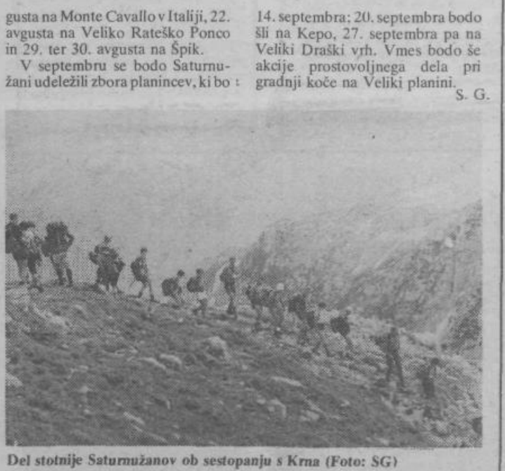
Del stotnije Saturnužanov ob sestopanju s Krna

Še številnejše pripombe pa so bile k prostorskemu načrtu za Zg. Kašelj MS 8/5, ki je bil razgrnjen do 15. t. m. na občini in v KS. Prevladovale so pripombe na sedanjo in na predlagano prometno ureditev Kašlja ter Vevč, ki je osrednji problem v tem 90 odstotno pozidanem prostoru. Osrednji del Kašlja je nujno prometno boljše odpreti in povezati z Zaloško cesto mimo Petrolovih skladišč, na Vevškem delu pa urediti prometnico z mostom. S. G.