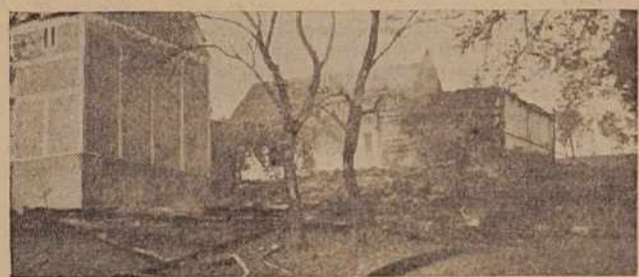
Pogorišče — ob večji skrbi za varnost pred ognjem ga ne bi bilo...

Dolžnost občnih zborov je vsekakor ta, da o teh in podobnih problemih v gasilskih društvih govorijo in sprejmejo ustrezne sklepe.