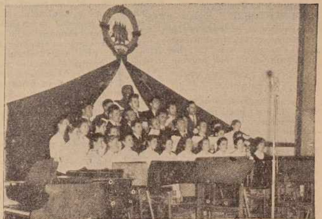
S I. oddaje Radia Murska Soba — nastop pevskega zbora

Da nekako »prebujemo ledo« bo brez dvoma tudi tukaj pomagala avdicija za oddajo »Pokaži kaj znaš«, ki jo je izvedla predvčeršnjim ekipa RTV Ljubljana v Ljutomeru. Rezultati te poskušnje nam sicer še niso znani, vendar lahko upamo, da je tudi na pomurskih tleh zrastle kaj takega, s čemer se lahko predstavimo širši javnosti.