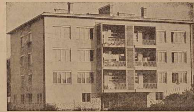
Lansko leto smo imeli v Murski Soboti in tudi drugih mestih zelo živahno gradbeno dejavnost, tudi kar zadeva stanovanjsko graditev. Upajmo, da bo tudi letos tako. Na sliki: Novi stanovanjski blok v Stefana Kovača ulici v M. Soboti

Lani so pri petih požarih obvarovali gasilci za 2 milijona din ogrožene imovine. Komisiji, ki sta pregledali kurilne in dim-