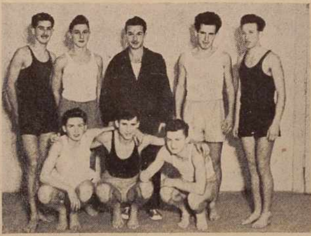
Ekpa soboškega »Partizana«, pred leti prvak LRS v ljudskem mnogoboju (iz arhiva PV)

Program, ki so ga sprejeli na seji Okrajne zveze »Partizane« v Soboti ob zatonu preteklega leta, je mnogo obetajoč in bo po uresničenju prinesel pomembne dosežke in osvežitve na področju telesne vzgoje v pokrajini.