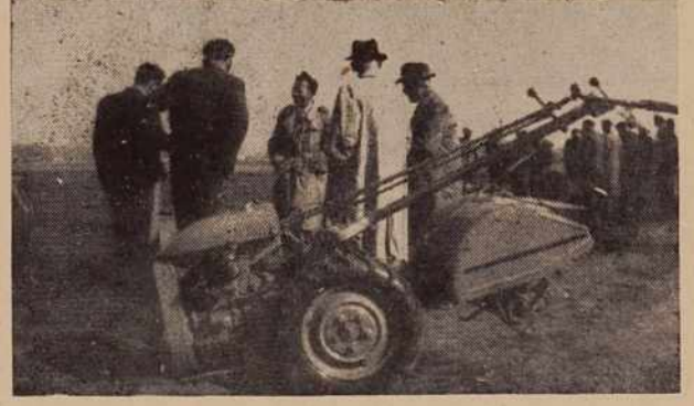
Se več takih poskusov...

ključkov, niti da plugov ne morejo dobiti... V strokovnih krogih pa menijo, da se za to, ne povsem umestno kritiko skriva nekakšen odpor proti najnovejšim originalnim priključkom traktorja »Ferguson«