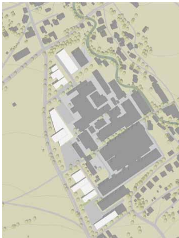
Slika 2: Vstop v Begunje.