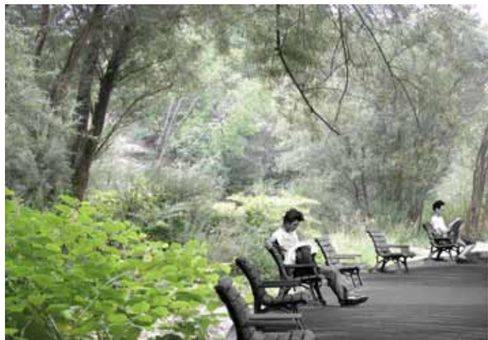
Slika 8: Območje ceste lesce - Bled.