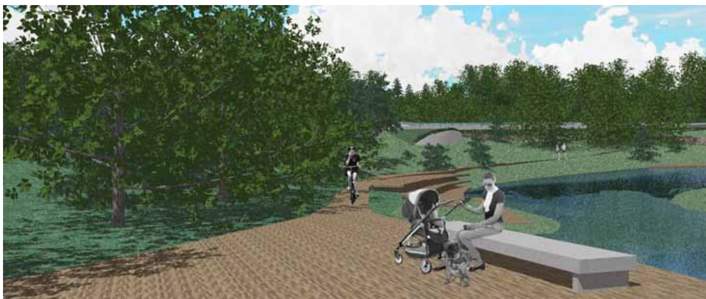
Slika 4: Območje ceste Lesce - Bled.