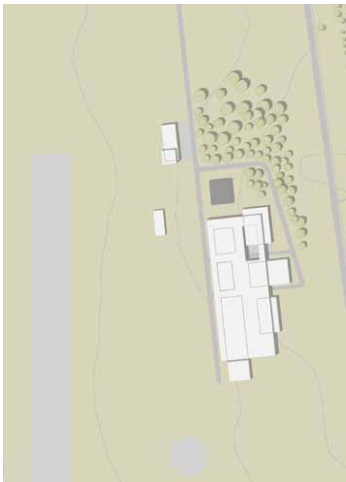
Slika 6: Območje Letališča Lesce.