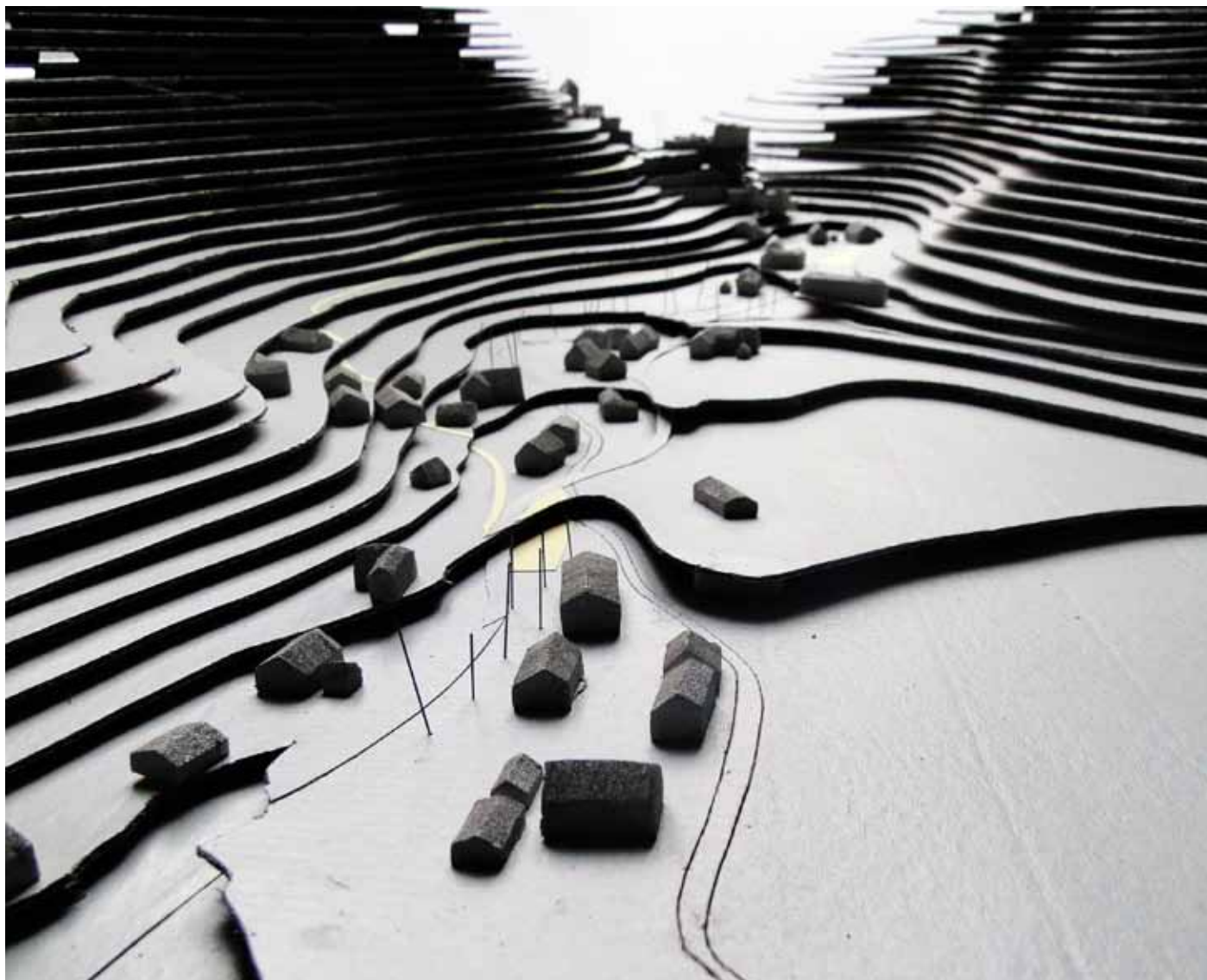
Slika 3: Dostop h gradu Kamen.