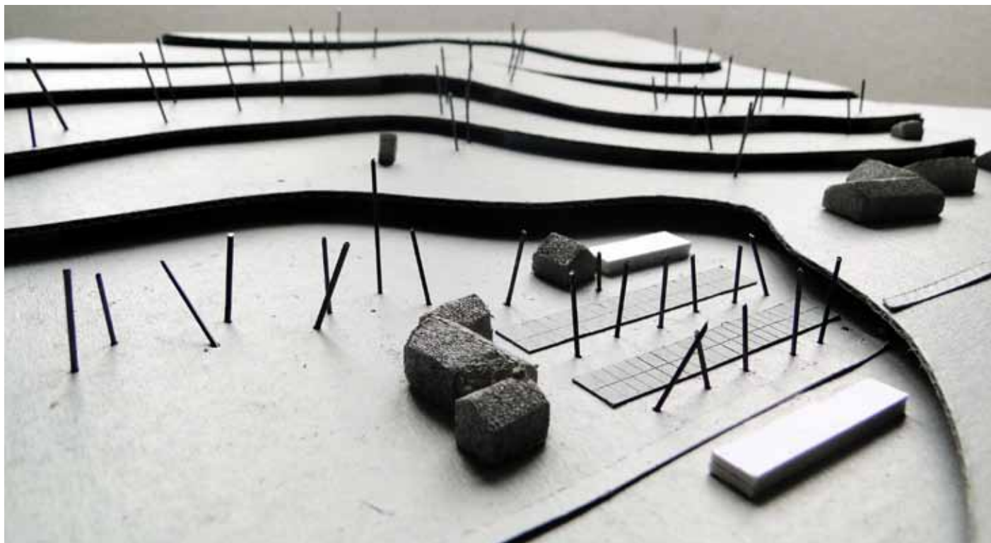
Slika 5: Predlog pokopališča v območju Doline.