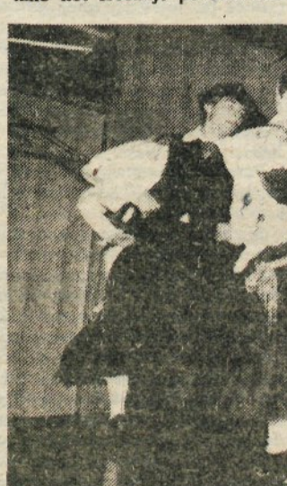
Domači folklorni ansambel se je na reviji predstavil z osmimi pari. Čeprav ga sestavljajo mladi plesalci, je v treh letih doživel že precej kadrovskih sprememb. Razveseljivo je, da se mu bo letos pridružila nova skupina plesalcev. K sodelovanju pa vabijo še nove člane, tako plesalce kot inštrumentaliste, ki se lahko vpišejo vsak četrtek ob 20. uri v šoli Moste.

Obiskovalci so z aplavzi pokazali, da si tovrstnih prireditev še želijo in da bi tudi revija folklorne, tako kot srečanje pevskih zborov, lahko postala vsakoletna.