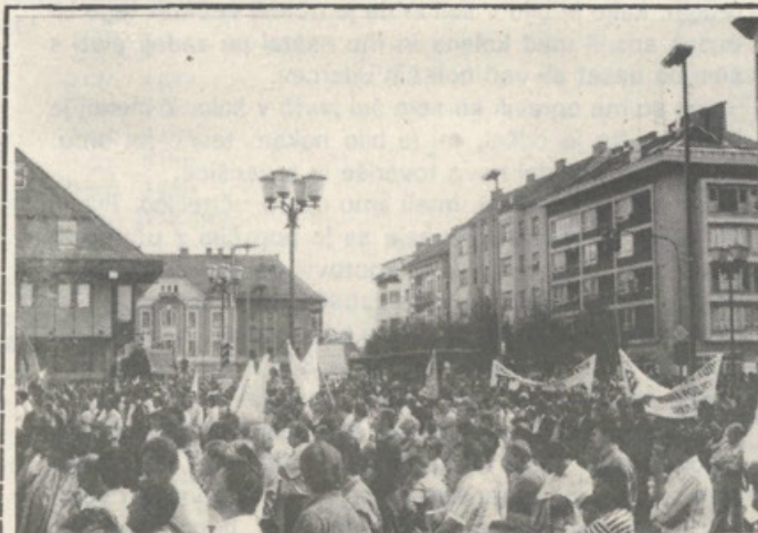
PROTEST PROTI MOSKOVSKI VOJNI V CHECHNYA