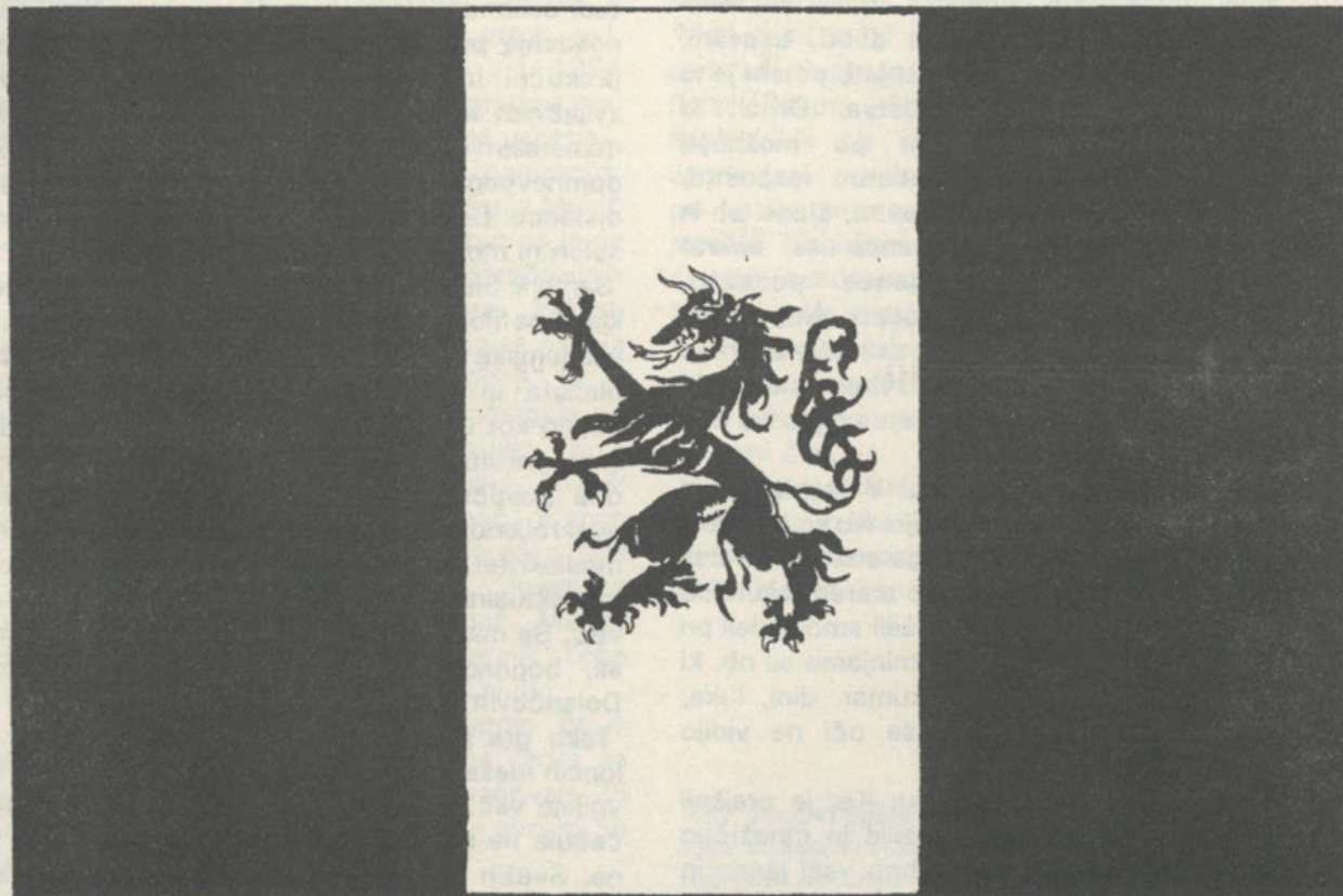
Karantanski prapor s panterjem in njegove barve: črna - bela - črna, izrisan po današnjih merilih.

Sponsoring organizations: League of Ukrainian Canadians, League of Ukrainian Women in Canada, Ukrainian Youth Association of Canada, Society of Veterans of UPA, University of Toronto Ukrainian Students' Club, Croatian Democratic Union, Croatian Liberation Movement, Bosnian Canadian Community Association, Bosnian Canadian Relief Association, Bulgarian National Front, Lithuanian Canadian Community, Estonian Central Council, Latvian National Federation of Canada, Latvian Relief Society, Slovenian National Federation of Canada, Romanian World Congress.