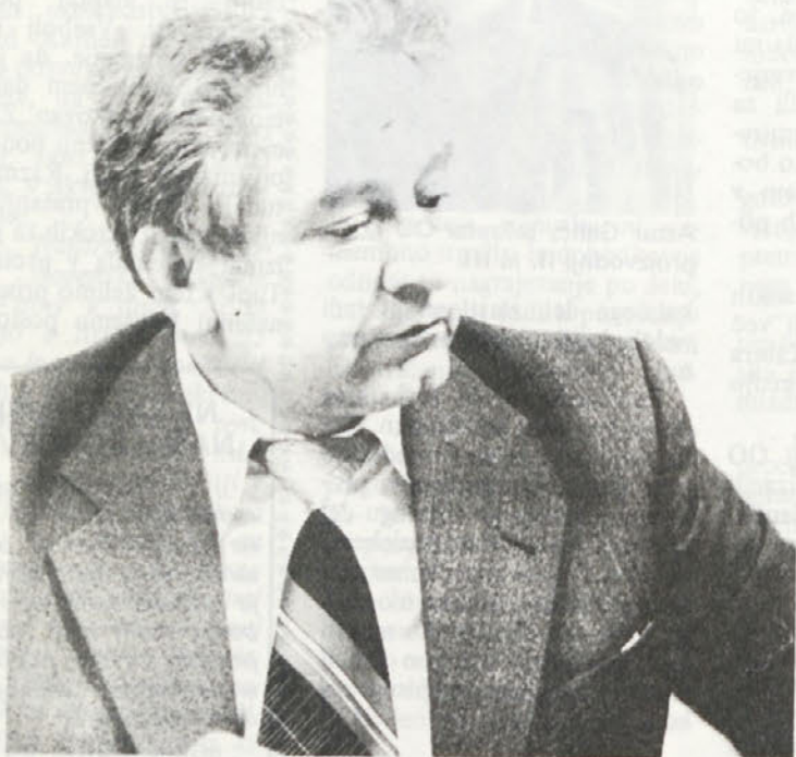
„Delavec lahko pričakuje, da bo v bodoče zmeraj boljše izkoriščal svoj delovni čas, s tem pa tudi več proizvajal, kar je pogoj za dvig njegove življenjske ravni.“