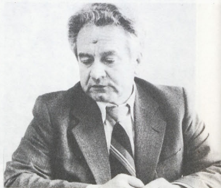
„Vsi delavci, ki imajo vodilna delovna mesta, bi si morali avtoriteto zgraditi z zaupanjem in odkritostjo, s tovariškim odnosom do podrejenih.“

Kljub takemu položaju, njegove težavnosti pa nihče ne zanika, smo še v situaciji, da z ustrezno organizacijo in dodatnim angažiranjem vseh dejavnikov v zadnjem „kvartalu“ lahko izvršimo še vse proizvodne naloge. Večina kadrov, ki dela pri organizaciji in vodenju posameznih proizvodenj, si izredno prizadeva in se zaveda skupaj s