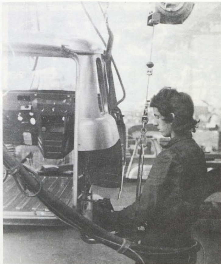
Na kongresu ZSM Slovenije je bilo ugotovljeno, da se mladi premalo vključujejo v samoupravljanje. Ali je tudi pri nas tako?

V Novem mestu se bo začelo poskusno svetovanje novembra. Potekalo bo dva zaporedna dneva, vsak dan po štiri ure za 15 parov oziroma 30 posameznikov. Udeležijo se ga lahko vsi, ki sami ali s svojim partnerjem (dekletom, fantom) želijo obiskovati poskusno svetovanje za bodoče zakonce. S tem bodo mladi pridobili nekaj koristnih