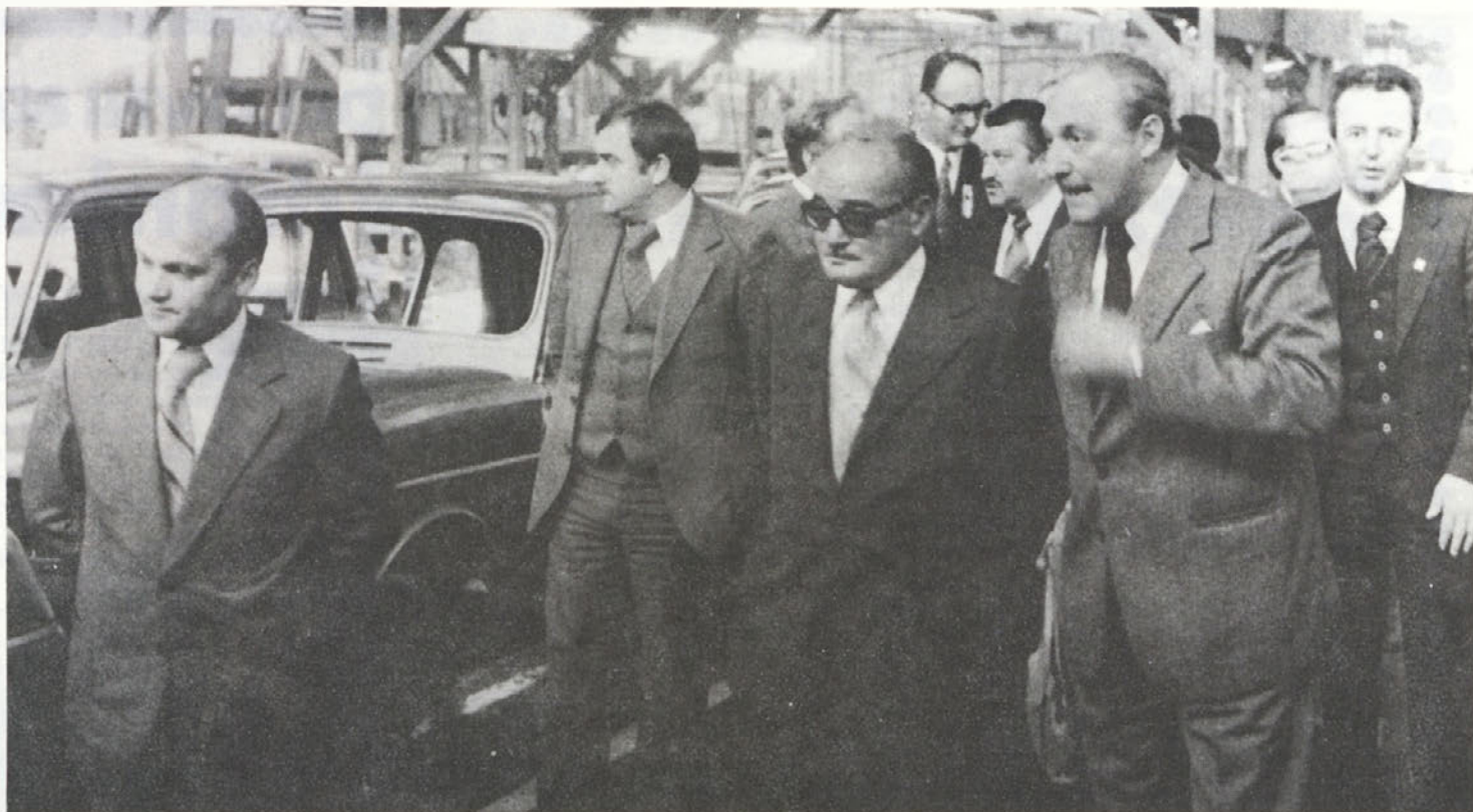
Obiskal nas je predsednik skupščine SFRJ Dragoslav Markovič, ki se je med ogledovanjem proizvodnih prostorov zelo zanimal za naš gospodarski položaj