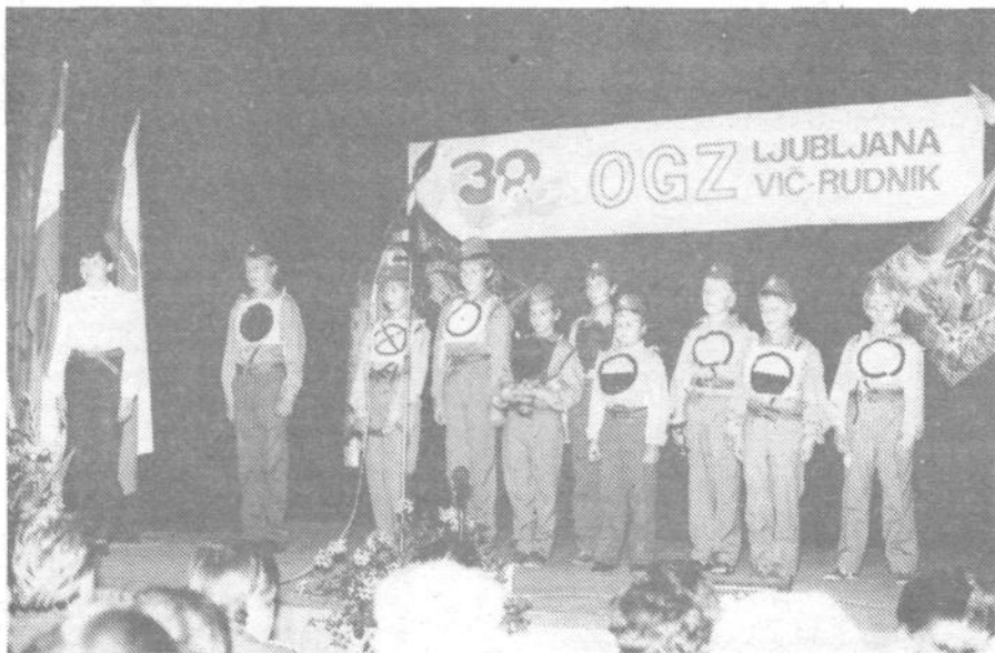
Ko smo opazovali iskren nastop mladih iskovarskih gasilcev, smo si želeli: da bi vsi ti fantje in dekleta tudi čez deset, petnajst let tako strumno stali v gasilski enoti in opravljali naloge, o katerih so odločno pripovedovali