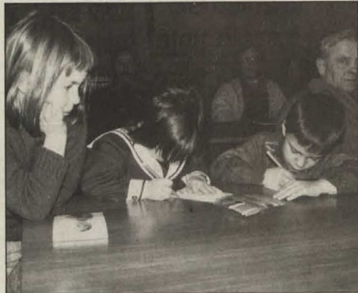
Starši in otroci v Celovcu pričakujejo, da jim bojo odgovorni tudi v glavnem mestu Koroške omogočili za dvojezičen pouk v javni ljudski šoli.

Nedavni dogodki pa so pokazali, da niti koroška deželna vlada niti mesto Celovec pa tudi avstrijska vlada niso znali ali hoteli izkoristiti te edinstvene priložnosti, da bi se izkazali za zaveznike in pospeševalce razvoja slovenske manjšine. Iz golega političnega oportunizma, politične bojazljivosti in ozkosrčnega ravnanja s slo-