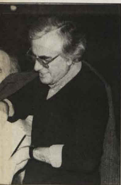
je bilo mnogo zanimanja, uredniki