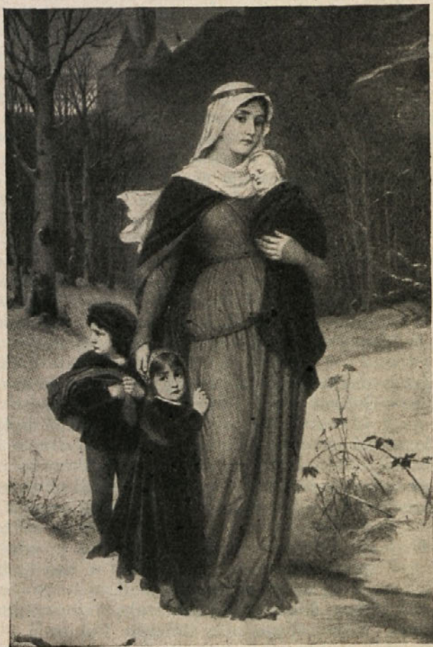
R. Beyschlag: Kneginja Elizabeta zapušča grad Wartburg.

L e pobožna pripovedka ali legenda je, ki nam poroča, kako je sveti Francišek poslal svoj plašč svoji prvi in največji nemški učenki Elizabeti v prekipevajočem veselju nad njeno ljubeznijo do uboštva — kake druge zemeljske imovine asiški ubožec ni mogel podariti. In takisto spada zgolj med legende pripoved, da je Franciškova velika hči nosila poslej ta plašč svojega duhovnega očeta in da ga je nosila pred