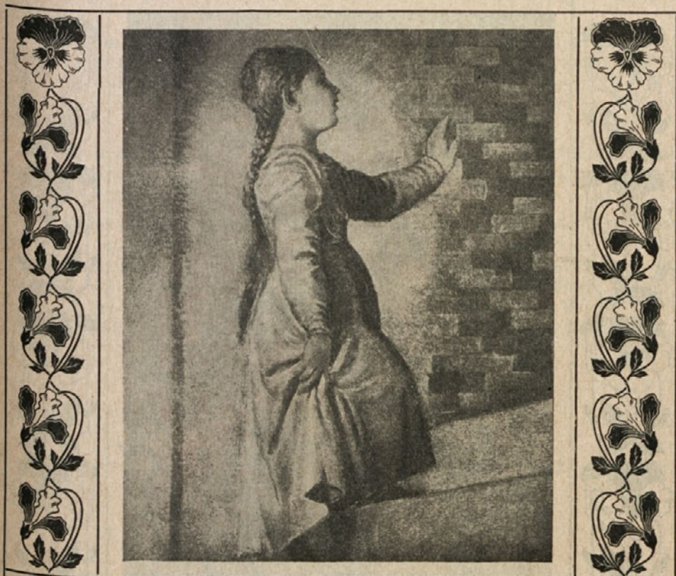
Tiziano Vecellio: Marija na stopnicah templja.

Toda zaupanje v Njega, ki se mu daruješ, je brezmejno. Božje oko te je pogledalo z ljubeznijo, ki je samo pri Njem doma. Vsaka pot navzgor je strma, tvoja pot gre do zadnjih višin — do Njega samega, skrivnostnega, Večnega, Nepojmljivega.