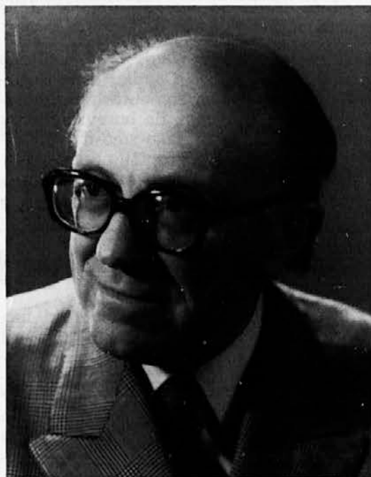
št. 2: prof. BORIS PAHOR Pisatelj, urednik Zaliva, podpredsednik Mednarod- nega združenja za zaščito ogroženih jezikov in kultur AIDLCM. Bivši interniranec, borec za s'ove- sko samobitnost, za pravice narodnostnih skupnos- ti in odpiranje v Evropo.

Slovenska skupnost svetuje, da glasujemo DA in da torej prekrižamo na glasovnici »si«.