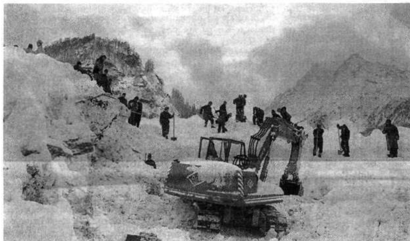
Strašne posledice snežnega plazov – švicarski vojaki skušajo rešiti, kar se še da rešiti.

turisti so hoteli za vsako ceno dobiti sedež na prvem možnem poletu, čeprav so vsakemu človeku v kraju sporočili, ob katerem času je zanj rezerviran sedež in nikomur sploh ne bi bilo treba čakati. Tako je morala na pristajališču delati red gorska žandarmerija. Pri prevozu so imeli prednost predvsem starejši ljudje in dopustniki, ki so zboleli zaradi nekajdnevnega mraza – približno 6000 stalnih in začasnih prebivalcev je namreč ob pomanjkanju elektrike kar precej zmrzovalo. V vasi so ostali le tisti (predvsem domačini), ki so to izrecno želeli, in seveda tisti, ki so bili zaradi svojih posebnih znanj pri reševanju nujno potrebni.