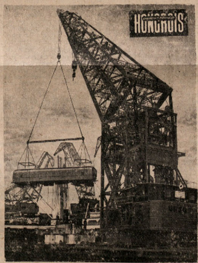
Trst je mednarodno pristanišče z velikim zaledjem...