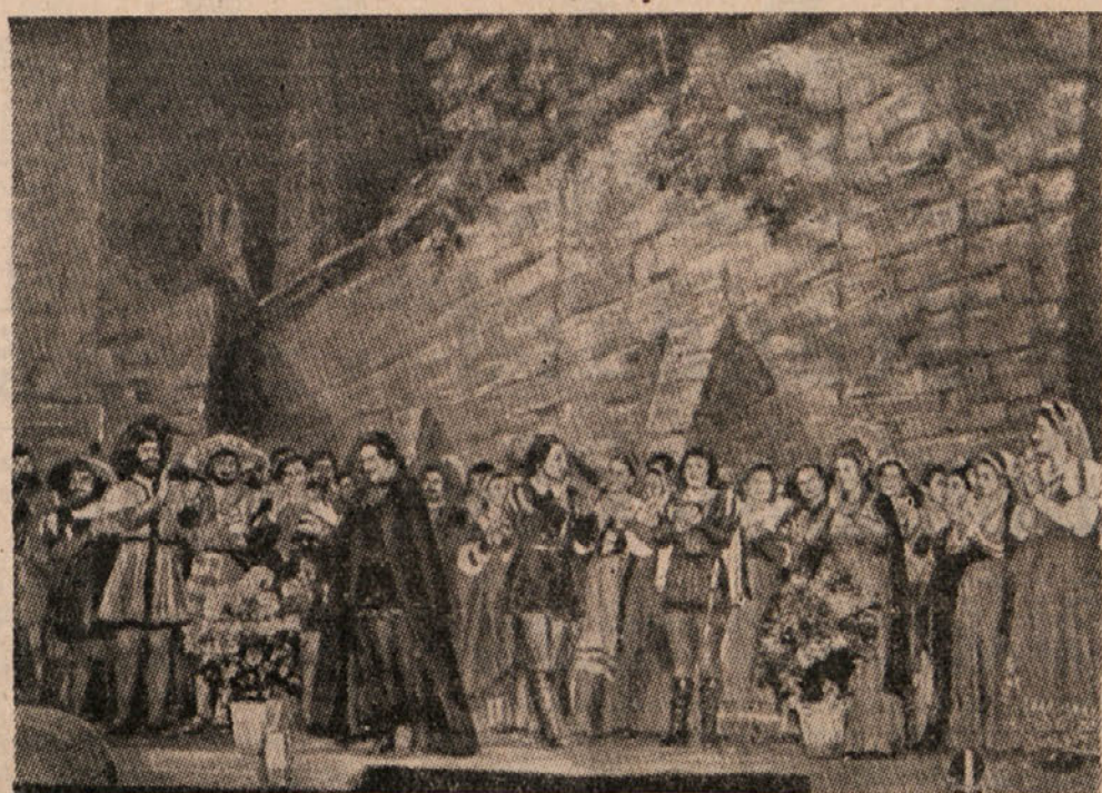
Prejšnji mesec je skupina jugoslovanskih opernih pevcev...