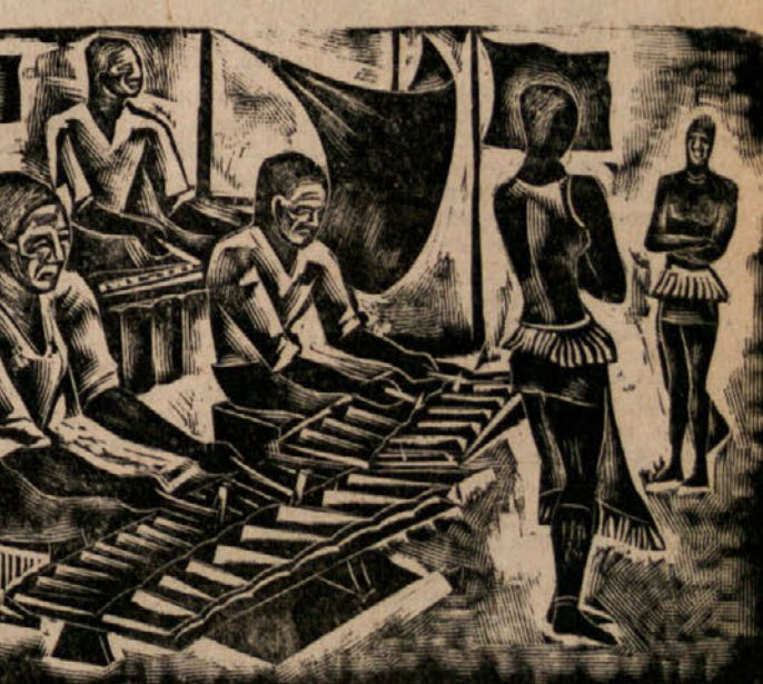
EZOTIKA LESOREK PROF. A. CERNIGOJA