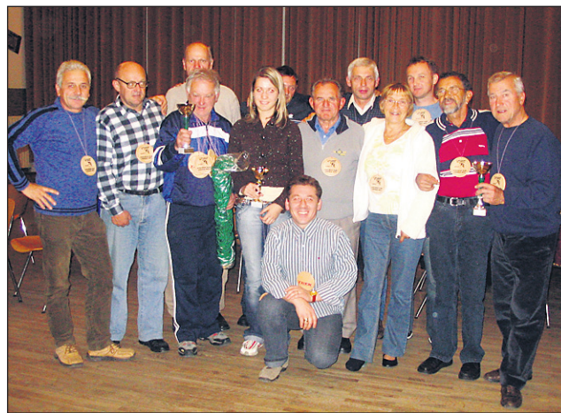
Prejemniki priznanj ob koncu kolesarske akcije S kolesom na Areh

na koncu, z mislimi pa smo že v naslednji, za katero se bo potrebno dobro pripravljati že v zimskem času, hkrati pa je