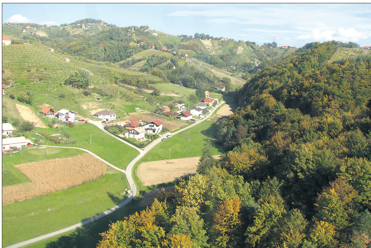
Število turistov, ki si želijo ogledati Haloze, se iz leta v leto povečuje.