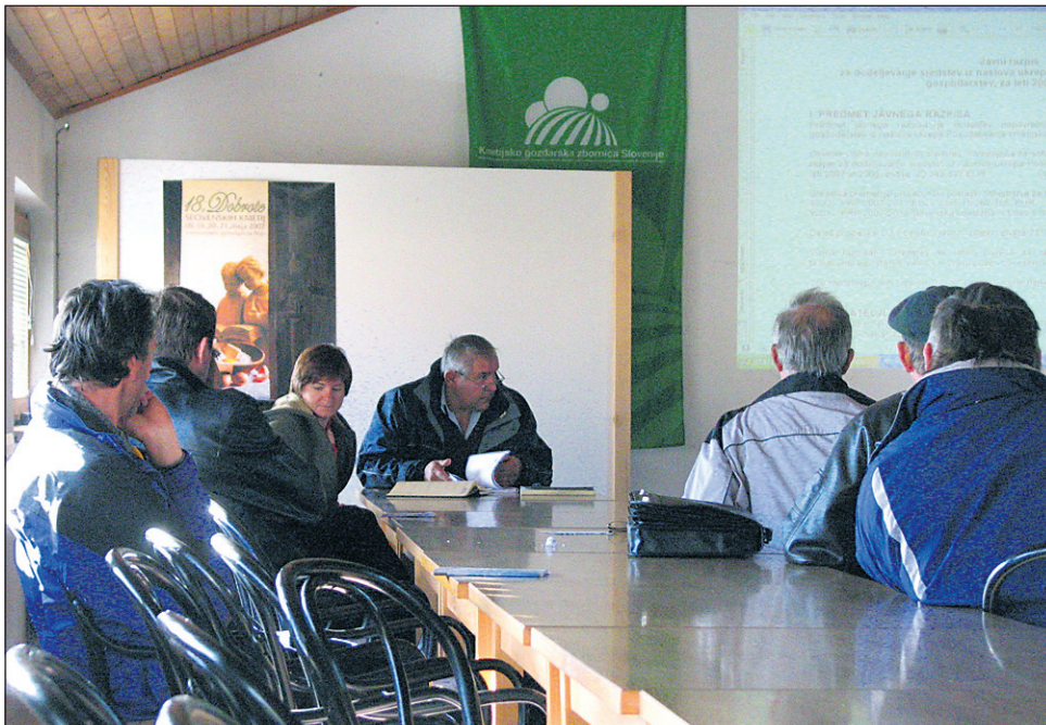
Prvotni interes kmetov za prijavo na razpis je bil izjemno velik; potem, ko so slišali zahtevne pogoje, pa je slušateljstvo bilo vedno manj.

Z vsemi zahtevami in možnostmi za prijave na razpis