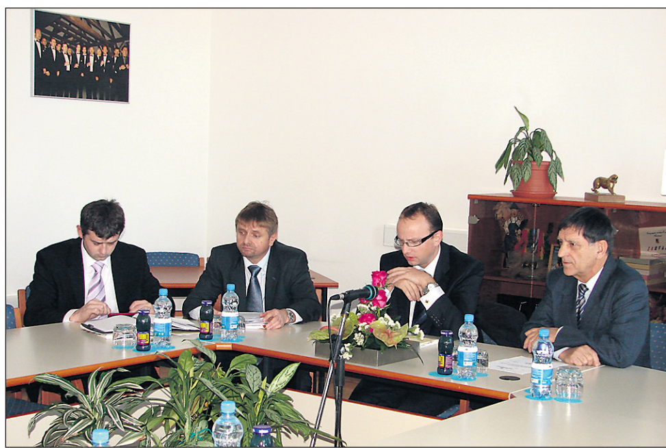
Minister za promet mag. Radovan Žerjav na obisku v občini Markovci.

Poleg obiska v občini Gorišnica je minister Žerjav obiskal tudi občino Markovce. Že več let se govori o predvideni gradnji hitre ceste Ptuj-Ormož. Cesta je sicer že umeščena v prostor, težave pa so na lokaciji med Markovci in Ptujem. Občine želijo, da se cesta umesti v Šturmovcih, tik ob jezeru. Tako bi cesta najmanj posegla v bivanjski prostor ljudi. Po drugi strani pa naravovarstveniki opozarjajo, da gradnja ceste na tej lokaciji zaradi zaščitene območja Natura 2000 ni mogoča. Minister je v Markovcih poudaril, da je edina možna lokacija za cesto na lokaciji Markovci-Ptuj na severni in ne na južni strani, kot je bilo predvideno. “Potrebno bo razmišljati o severnih varian-