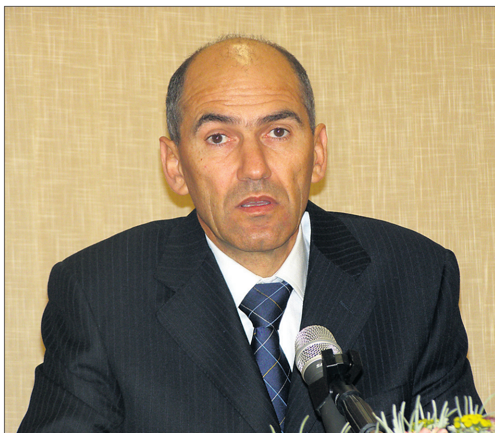
Predsednik vlade Janez Janša

Kot je dejal, je v času od zadnjega obiska Spodnjega Podravja prišlo do realizacije