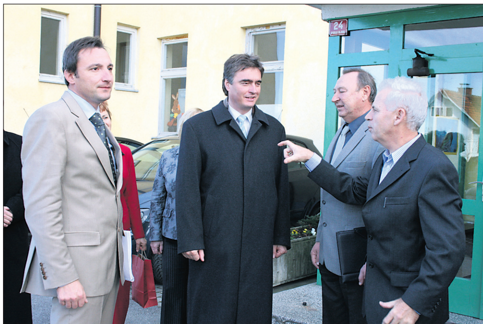
Minister Zver s sodelavci se je na šoli Hajdina pogovarjal o predvideni izgradnji prvega vrtca v občini.

Kot je dejal šolski minister Zver , so po novem usmerili še dodatni del investicijskih sredstev v prav sofinanciranje predšolske vzgoje, v prihodnjih letih naj bi se ta del še povečal, na splošno pa je dejal, da je standard na tem področju v Sloveniji dober. V vrtce je po zadnjih podatkih vključenih blizu 60.000 otrok, tudi sicer pa so vrtci po mnenju ministra Zvera zelo pomembni pri kasnejši socializaciji otrok. Nameri občine Hajdina, da izgradi svoj vrtec, je minister že dal podporo, ob tem pa spomnil