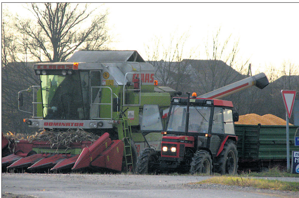
Na razpisu bo možno dobiti nepovratna sredstva tako za kmetijsko mehanizacijo kot za investicije v kmetijsko infrastrukturo.

Odločbe o uspešni kandidaturi na razpisu pa je pričakovati januarja naslednje leto, pri čemer pa je treba vedeti, da se odobreni denar ne dobiva vnaprej, ampak na podlagi predračunov oz. računov po izvedeni naložbi oz. po izvedenih fazah naložbe.