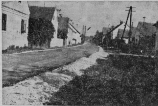
Letos že druga asfaltirana ulica v Središču ob Dravi

nezaupanja med Središčem in Obrežem je tudi tukaj prišla na površje. Prebivalci Obreža so zahtevali delitev sredstev, da si ne bi Središčani asfaltirali svojih ulic tudi z njihovim denarjem. Prisotni so po daljši in žolčni razpravi smatrali, da bi kakršnakoli odločitev te vrste lahko bila nepremišljena in zaradi tega zaletava. Zato so zadožili predsednika