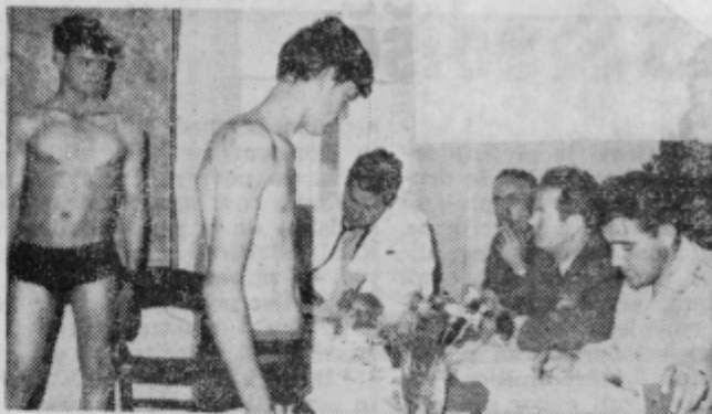
Pred naborno komisijo