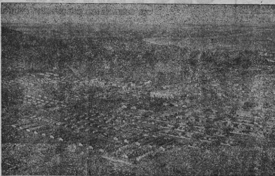
Comodoro Rivadavia, kje rse nahajajo veliki petrolejski vreli pri katerih so zaposleni tudi naši rojaki. Zanimivo bi bilo, če bi kdo opisal kakšne so razmere tam.