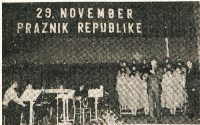
29. NOVEMBER PRAZNIK REPUBLIKE