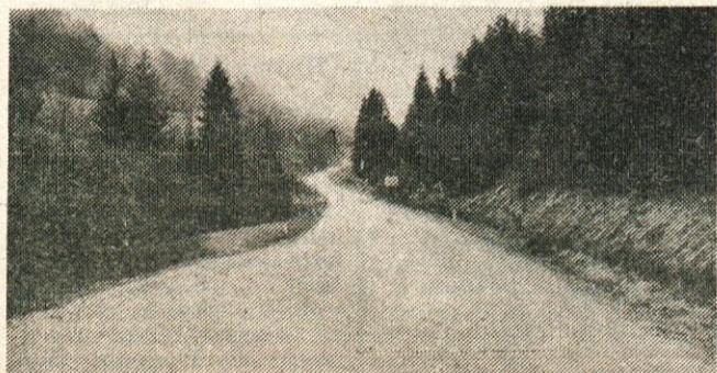
Velika pridobitev za Tuhinjsko dolino – sodobna cesta čez Kozjak