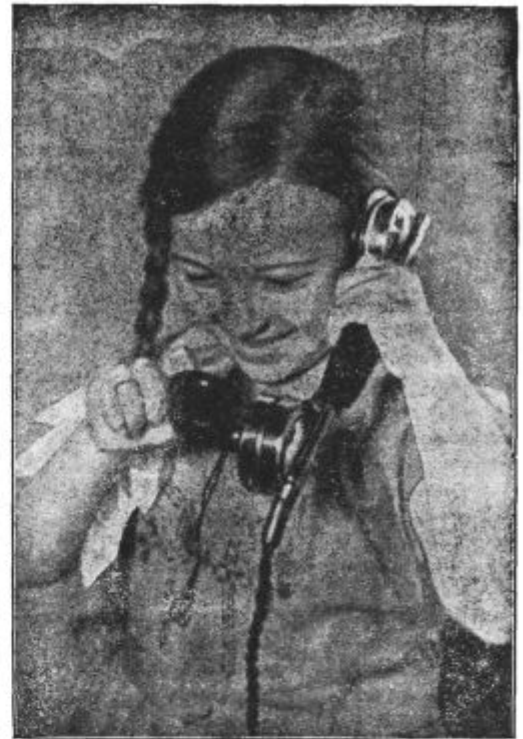
Pogovor s papanom.

Sedaj se pa zdí, da bodo tudi v oddajni tehniki vsaj za določene svrhe ubrali popolnoma novo pot glede modulacije. Novi način modulacije ni v principu nič novega, le uporabljal se od sedaj ni in teoretično ni bil raziskan. Pravtako je bil tudi princip superheta že mnogo let znan preden je — kar čez noč — obvladal vso sprejemno tehniko.