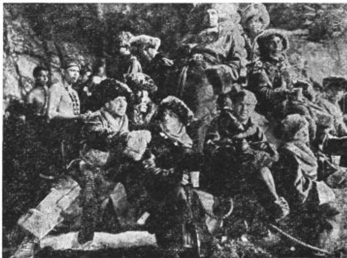
Prizor iz filma »Nekje v Tibetu«. — Film ima na sporedu kino Union.

Vprašajmo se, ali more tudi v naših časih služiti glasba narodu tako, kakor smo prej orisali. Saj vendar vemo, da se je v današnjih časih, ki imajo smisel za vse drugo kakor za umetnost, pomaknila v ozadje. Vprav v sodobnosti pa raste pomen glasbe čedalje bolj. Čim bolj izstopa nacionalna problematika, čim bolj se nižajo estetski instinkti in izginja vrednost člo-