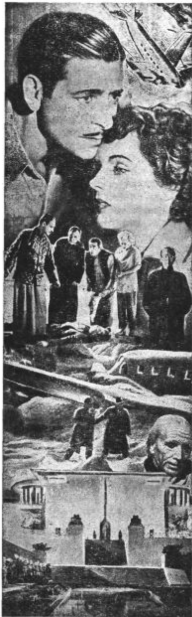
Iz filma »Nekje v Tibetu«. Kino Union.

Gre za čistost v družini, za čistost prijateljstva. Borba se vrši torej za velike moralne vrednote. V tem je pa tudi notranja, vsebinska vrtdnost komedije. To, in pa resnost s katero je avtor zagrabil snov dviga delo nad navadne komedije, ki služijo zgolj zabavi. V tem tiči tudi upravičenost.