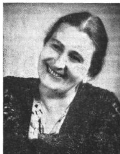
Ga Marija Tutta poje samospeve 30. junija ob 21.15.

Zanimivo je, da obravnava avtor ta že tolikanj uporabljen in zlorabljen motiv na čisto originalen, domač način in ne brez marsikaterih fines. Težišče franco-