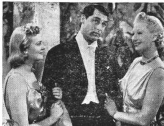
Iz filma »Nekje v Tibetu«. Kino Union.