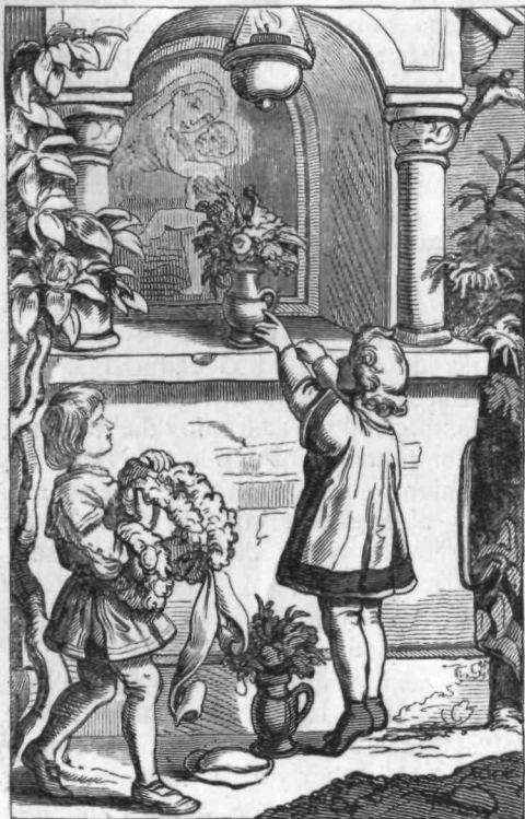
Sv. Francišek Saleški zaljša Marijin altar.

sv. očeta za Marijinega otroka na zemlji, v nebesih to potrdi Jezus Kristus. Tako si pravi otrok Marijin! Glej, kolika sreča te čaka v Marijini družbi!