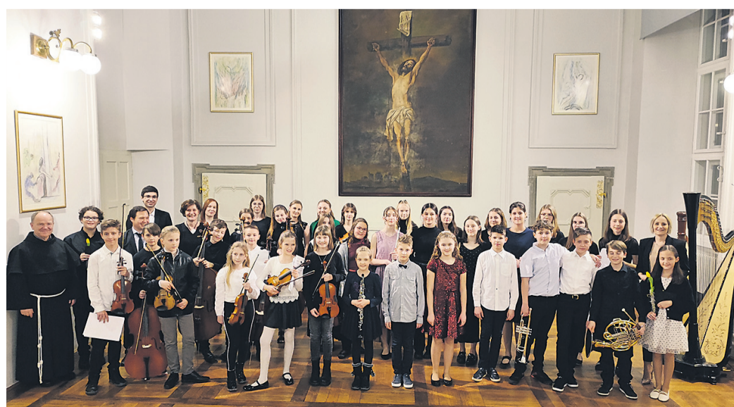
Udeleženci 12. gala koncerta