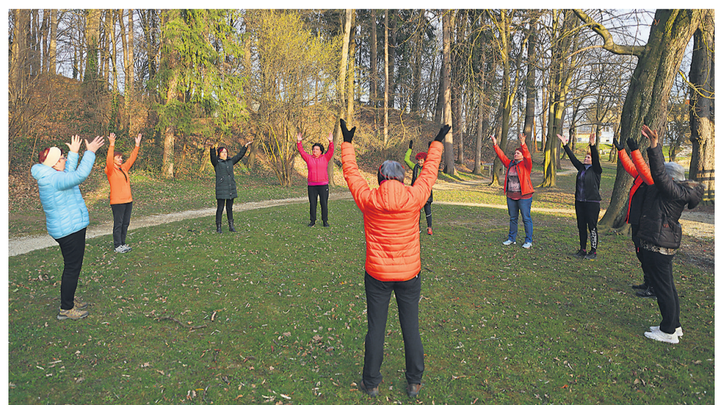
Od prvega marca tudi na Ptuj vsako sredo v Ljudskem vrtu poteka projekt Dihamo z naravo.