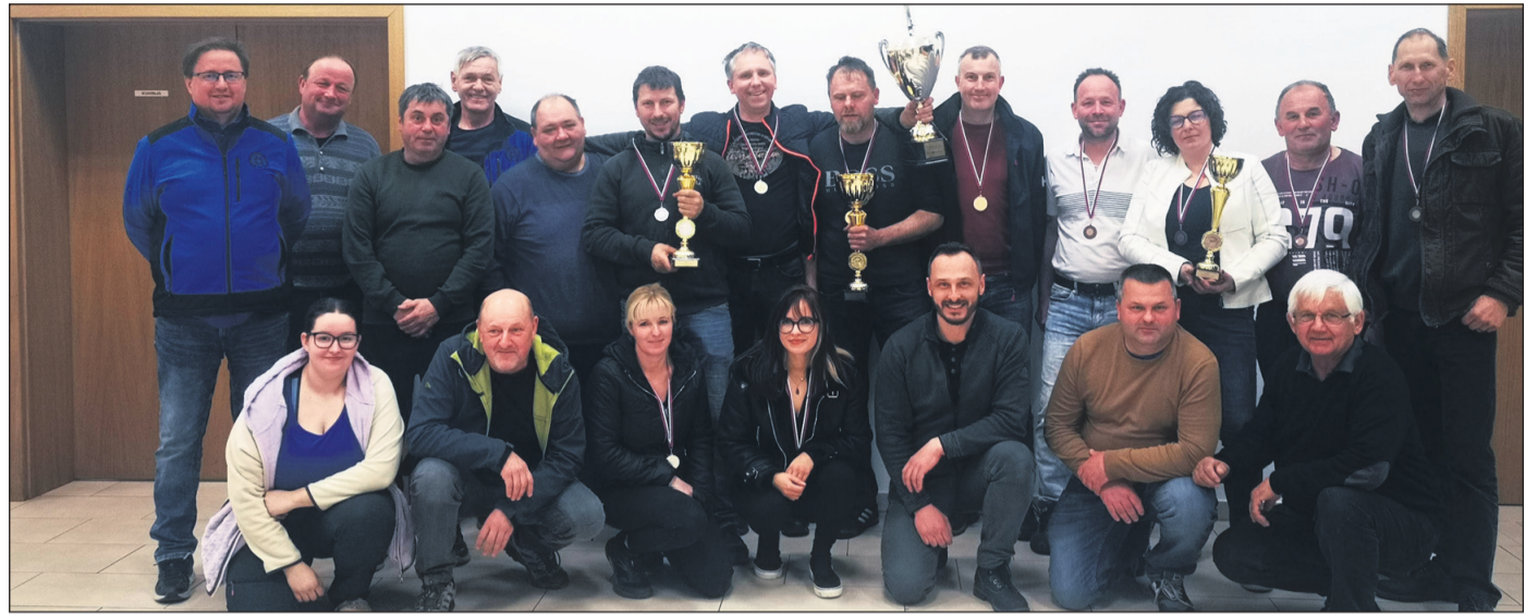
Skupinska slika vseh sodelujočih v Medobčinski ligi, zmagovalna ekipa SD Osek je v sredini

V sredini marca se je na strelišču v Trnovski vasi zaključila letošnja Medobčinska liga. Na sporedu je bilo pet krogov, v šestih ekipah je tekmovalo 24 posameznikov. Vsako sodelujoče društvo je na svojem strelišču organiziralo po en krog tekmovanja. V ligi so sodelovala naslednja društva: SD Selce, SD Vitomarci, SD Osek, SD Cerkevjak, SD Benediški vrh in SD Trnovska vas.