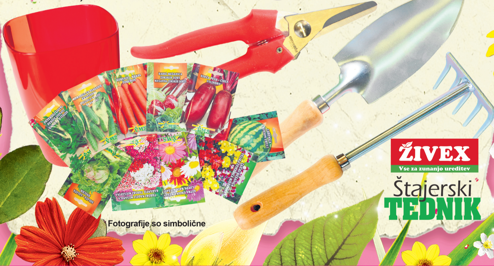
Fotografije so simbolične

ZIVEX Vse za zunanjo ureditev Štajerski TEDNIK