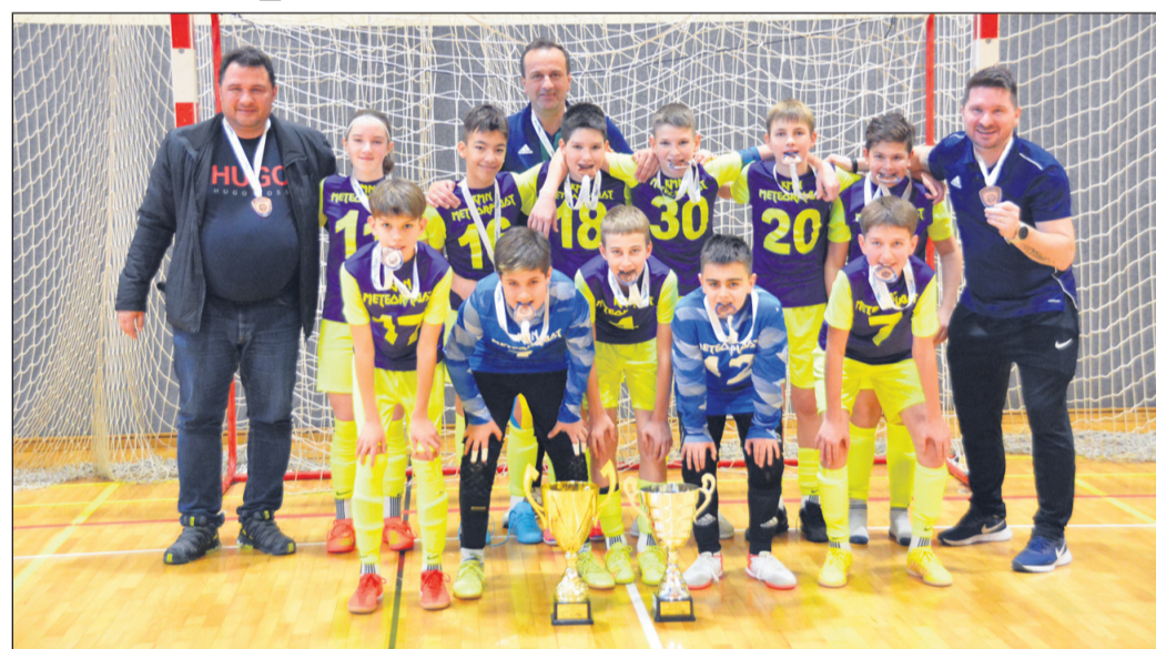
Igralci KMN Meteorplast Šic bar so se veselili bronastih kolajni.

Pred kratkim se je končalo državno prvenstvo v futsalu za selekcije U13. Prvak je postal ajdovski Kix, srebrno kolajno so osvojili igralci škofjiskega Bronxa, bronasto pa futsalerji