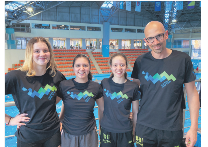
Ptujski del reprezentance Slovenije v Sarajevu