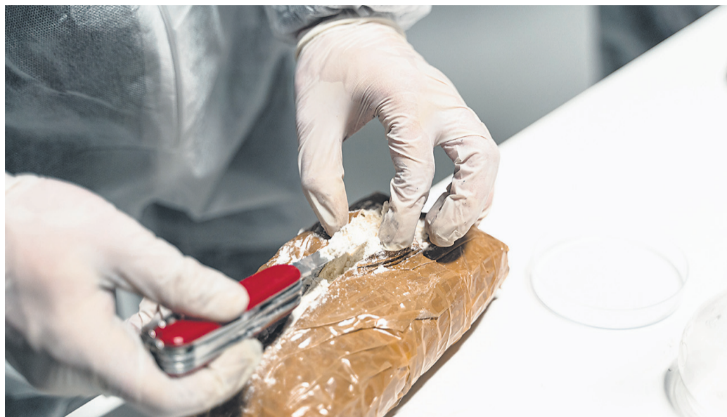
Slovenska policija je v preteklih dveh letih zasegla poldrugo tona kokaina.

Na Generalni policijski upravi (GPU) so povedali, da je bila večina v zadnjih letih uspešno izpeljanih akcij zasega droge rezultat sode-