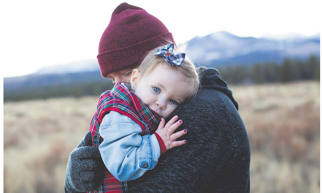
Bolj kot z delovanjem države so vprašani v anketi zadovoljni s svojim življenjem.

venca so deljenega mnenja pri oceni stanja gospodarstva v državi, bolj spodbudno pa ocenjujejo stanje evropskega gospodarstva, saj več kot polovica oziroma 55 odstotkov Slovencev meni, da je to dobro, na ravni EU pa so ocenjevalci bolj zadržani, tako menita le dva od petih vprašanih.