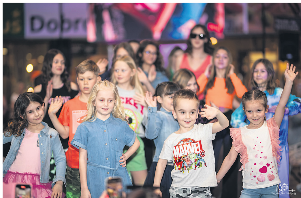
Predstavili so tudi modele oblačil za najmlajše.