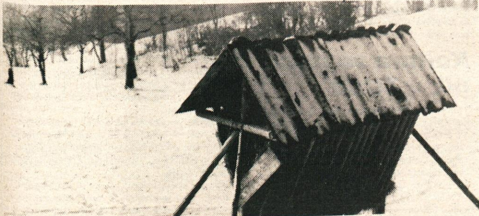
V hudi zimi vse sledi peljejo h krmilnici. Tudi tale nad Županjimi njivami je bila letošnja zimi dobro obiskana.