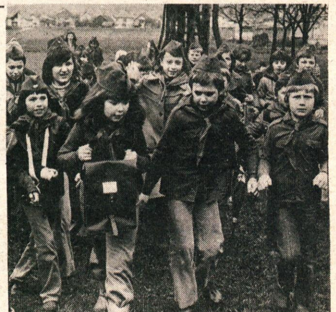
Pionirji-kurirji so krenili na pot s pozdravi in čestitkami tovarišu Titu.