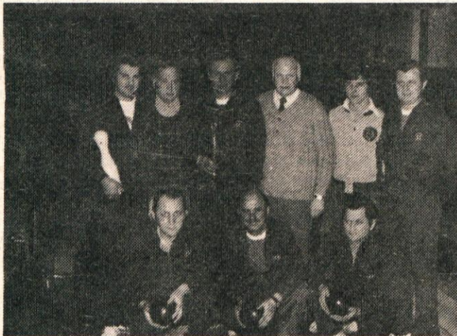
Člani in vodstvo zmagovite ekipe Titana.

Kegljanje postaja med najbolj zanimivimi in množičnimi športi v Kamniku, po ustanovitvi kluba pred nekaj leti pa je postalo še bolj organizirano. Najbolj zanimivo pa je postalo redno tekmovanje posameznih kegljaških sekcij, ki jih sestavljajo tekmovalci iz kamniških delovnih organizacij. Te že vrsto let tekmujejo v A in B ligi, vsaka šteje po 10 ekip.