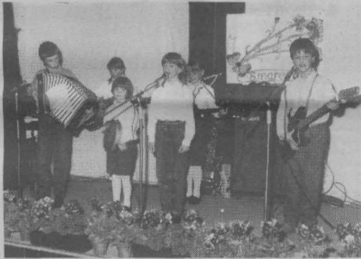
Veselje in potrebo do nastopov začuti pri nas že mlado bitje – najmlajša v »ansamblu« še ne hodi v šolo.

Po dobri, praznični večerji nam je zopet do poznih nočnih ur igral in pel ansambel OBZORJE iz Bevk, ki ga bomo še povabili med nas. Tudi godci pravijo, da jim je lepo v naši družbi.