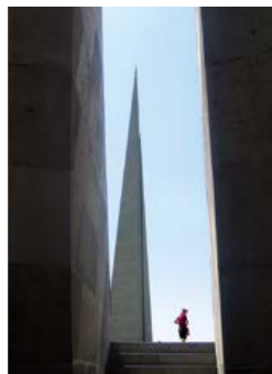
Spomenik armenskemu genocidu v Erevanu