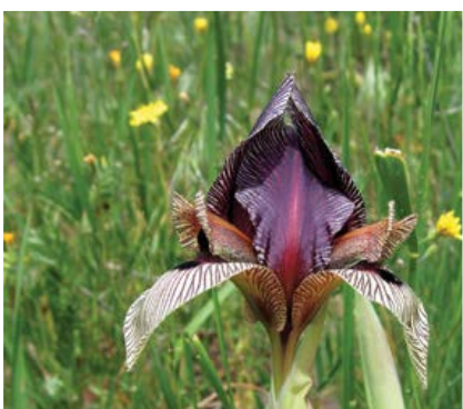
Ogrožena in redka vrsta IRISA ( Iris grossheimii )

Kavkaz. V državi obstaja okoli 110 vrst sesalcev, več kot 330 vrst ptic, 48 vrst plazilcev, 11 vrst dvoživk in 160 vrst rib. V Gruziji je nekaj spektakularnih lokacij za opazovanje ptic, pri čemer je vsaka izmed njih vabljiva zaradi raznolikosti vrst. Ker je na razmeroma majhnem ozemlju veliko različnih ekosistemov, je to zelo ugodno za opazovanje velikega števila vrst ptic v kratkem času in na majhnih razdaljah. Ornitopustolovci so nagnjeni predvsem k iskanju »velikih petih vrst«. To so endemična kavkaška skalna kokoš ( Tetraogallus caucasicus ), katere žalostni klici se slišijo daleč naokrog, sramežljivi kavkaški ruševac ( Lyrurus mlkosiewiczzi ), skoraj endemični prebivalec najstrmejših pobočij, čudoviti kavkaški škrlatec ( Carpodacus rubicilla ), kavkaška listnica ( Phylloscopus lorenzii ) in prečudoviti beloglavi pogorelček ( Phoenicurus erythrogastrus ), ki prebiva na alpskih meliščih Kavkaza.