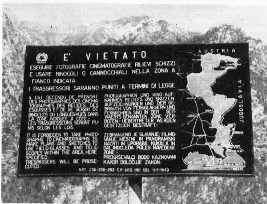
Una delle tante tabelle (in cinque lingue: italiana, tedesca, slovena, inglese e francese) che fanno divieto di eseguire fotografie. Senza dubbio tale divieto costituisce un serio ostacolo allo sviluppo turistico in quanto tiene lontani i forestieri

Na ta zadnji argument, ki je med najbolj aktualnimi in najbolj čutečimi, se bomo še povrnili. Za danes smo le opozorili naše prijatelje, katerim priporočamo, naj nikar ne izgubljajo časa, kajti sedaj se je treba zganiti, da dosežemo cilj, ki bo res zadovoljil vse prebivalce slovenskega jezika videmske pokrajine.