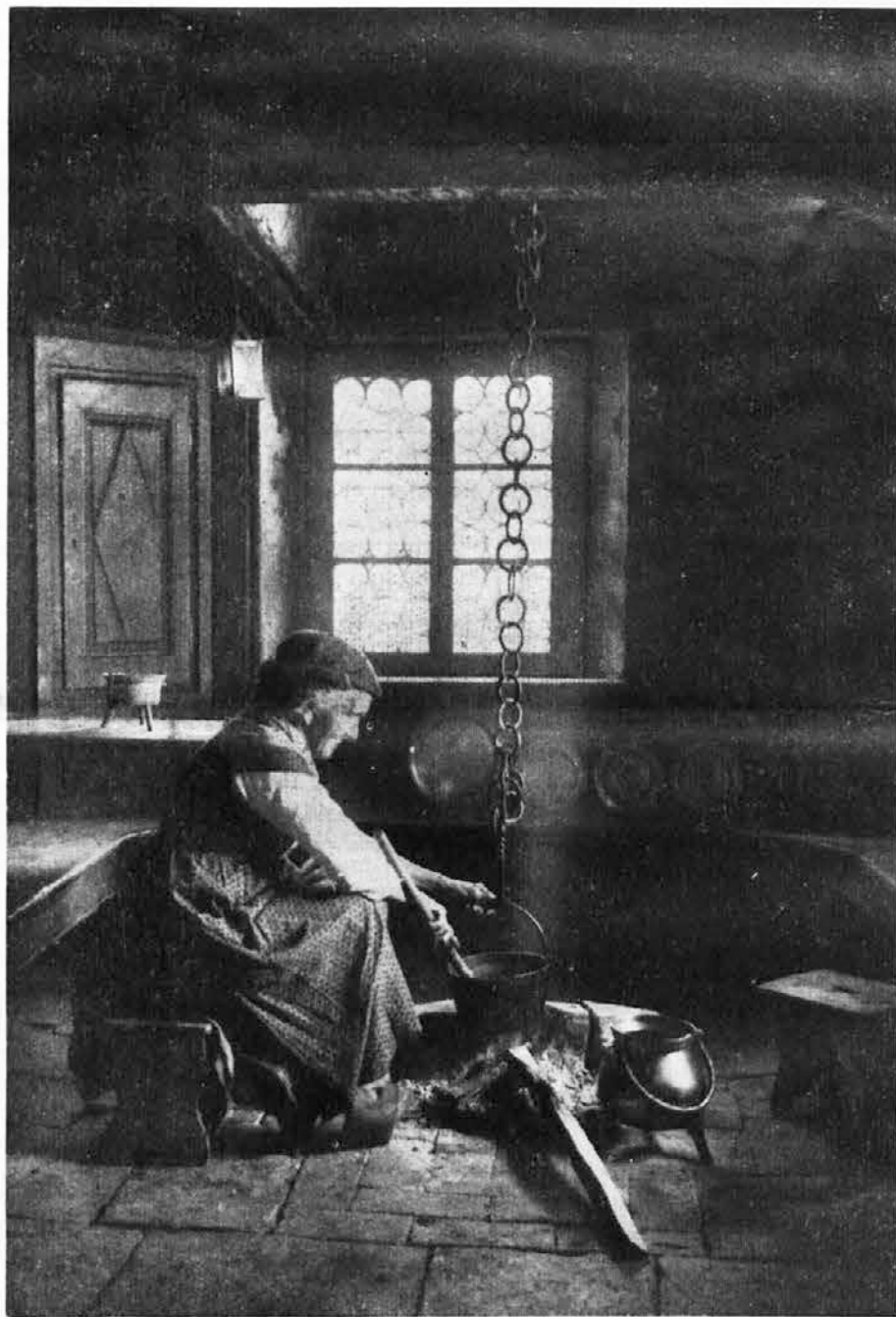
Un tipico focolare slavo, tradizionale, a nord di Tarcento

Ma in merito a quest'ultimo argomento che è uno dei più attuali e maggiormente sentito, ci ritorneremo sopra. Per oggi basta aver messo sul «chi va là» tutti i nostri amici ai quali raccomandiamo di non perdere tempo per giungere alla soluzione ritenuta più decorosa e che maggiormente soddisfa, anche per un certo orgoglio, le aspirazioni di tutti i cittadini di parlata slovena della provincia di Udine.