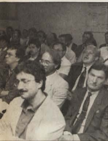
Številni naši zadrुžniki.