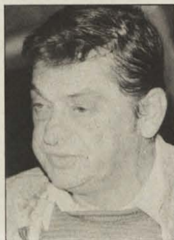
Režiser P. Militarov