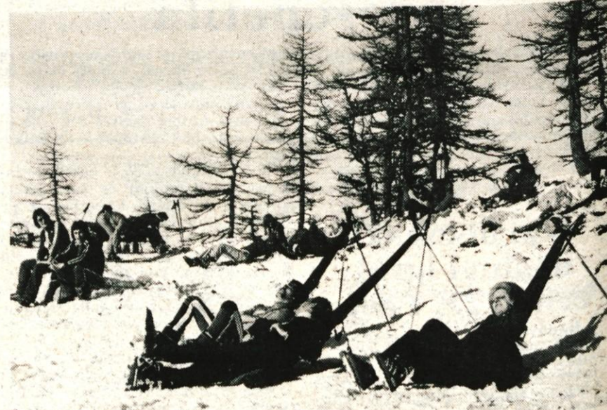
SMUČARSKA NEDELJA — Prenekaterega ljubitelja smučanja je nedeljsko oblačno jutro odvrnilo od tega, da bi se podal na smučišče. Tisti najbolj vztrajni in smuke željni, ki so se podali na Kravac, v Kranjsko goro ali na Vogel, pa so bili lahko zares zadovoljni. Omenjena zimska turistična središča na Gorenjskem so se dobesedno že zjutraj kopala v soncu. Tako so se smučišča na Kravcu in v Kranjski gori okrog polpodneva že kar precej napolnila. Le na Voglu, kjer obratuje približno polovica žičnic naprav in kjer je približno meter snega, je bilo le okrog 250 smučarjev. Na Kravcu in v Kranjski gori pa jih je bilo kar prek 2000. Lahko bi rekli, da so smučišča poudobro pripravljena, le da snega ni ravno na pretek. Sicer pa so tako na Kravcu kot v Kranjski gori v nedeljo obratovala vse žičnice. Cesta v zgornjo savsko dolino je bila sorazmerno dobra in se je promet po njej normalno odvijal; le proti Bohinju je bila na nekaterih odsekih zares slabo splužena in je bila potrebna zelo previdna vožnja. — A. Ž.