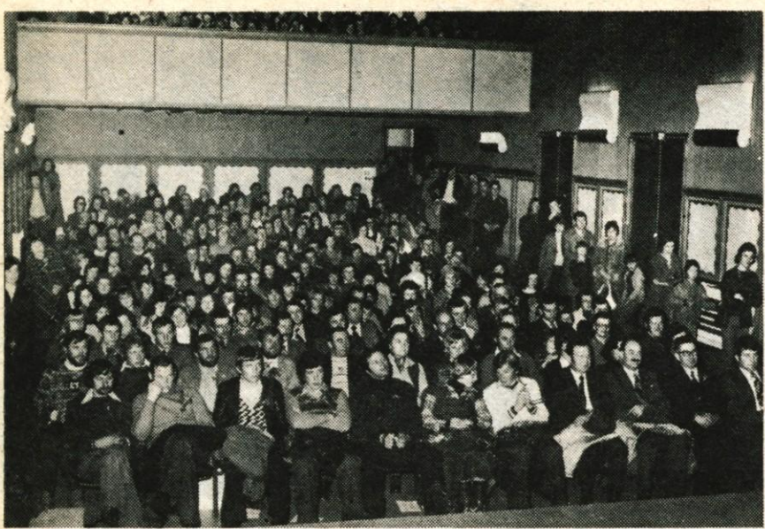
Tržičani so v četrtek zvečer do zadnjega kotečka napolnili dvorano Cankarjevega doma. Prireditelj jih je navdušila.