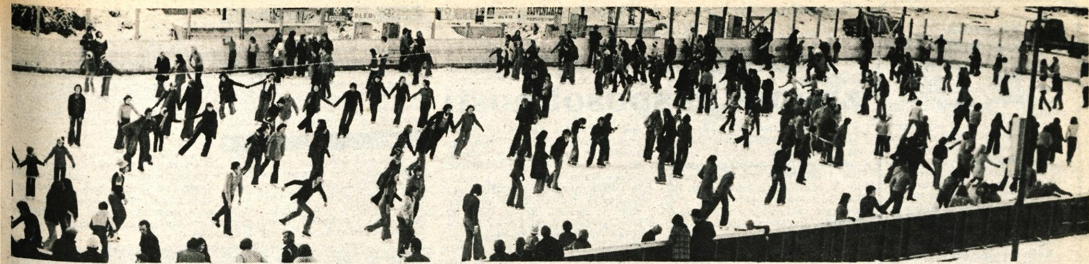
Na Bledu so v nedeljo odprli umetno drsališče, ki ima zdaj urejene garderobe, sanitarije in streho nad njimi ter stroj za čiščenje oziroma glajenje ledu. V letošnji zimski sezoni bo drsališče upravljal Zavod za napredek in razvoj turizma na Bledu. Urnik za rekreacijsko drsanje in treninge ter cene bodo objavili danes. Sicer pa si na Bledu obetajo dobro zimsko turistično sezono. — A. Ž