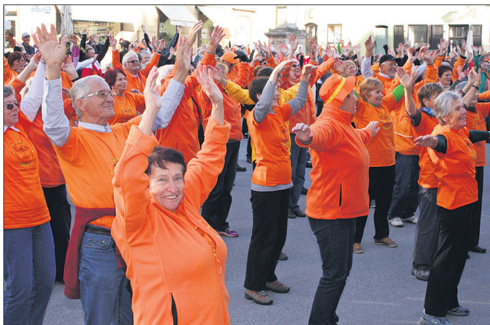
Z drugega srečanja skupin Šole za zdravje na Ptujju.