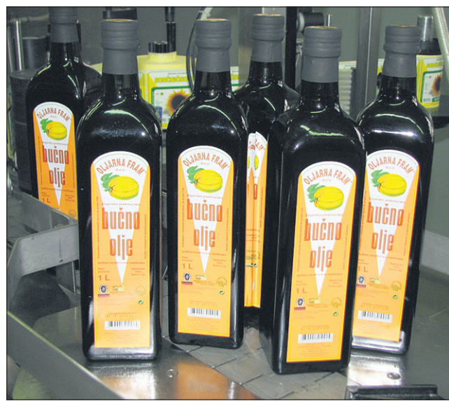
Oljarna Fram, ki je najstarejša oljarna pri nas, po besedah lastnikov deluje dobro in po zastavljenih načrtih.