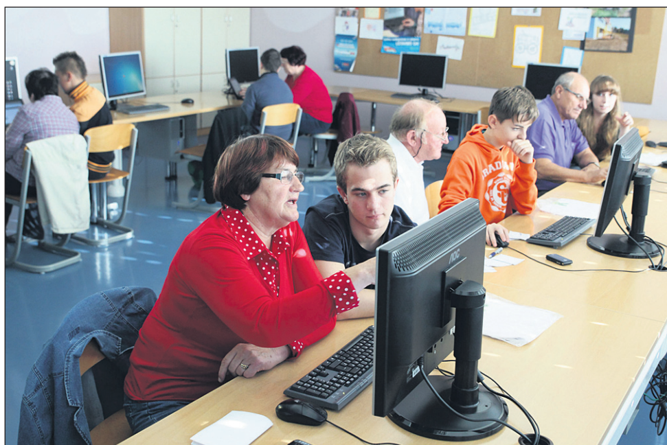
Na Ptuj je nova znanja s področja računalništva in telefonije pridobivalo 45 starejših.