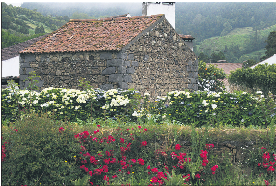
Stare kamnite hiške, obdane z cvetjem

Po ameriško naporni noči in nepredstavljivo visokem hotelskem računu se z nahrbtnikom na rami odpravim do bližnjega mesta Angra de Heroismo, sicer nekdanje prestolnice Azorskih otokov. Dobršen del mesta je danes pod zaščito Unesca, prvi stalni portugalski naseljenci pa so po ulicah veselo poskakovali že leta 1450. Kot celoten del portugalskega Atlantika je tudi Terceira in sploh Azorski otoki plod bujne domišljije in pretkanosti mogočnega pomorščaka Henrija Navigatorja, ki je kmalu po najdbi naselil otok. Današnje ime Angra de Heroismo (beri »herojstvo«) pa je tesno poveza-