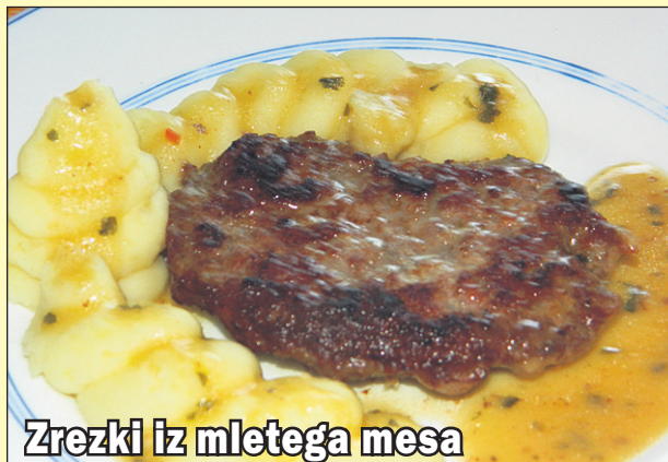
Zrezki iz mletega mesa