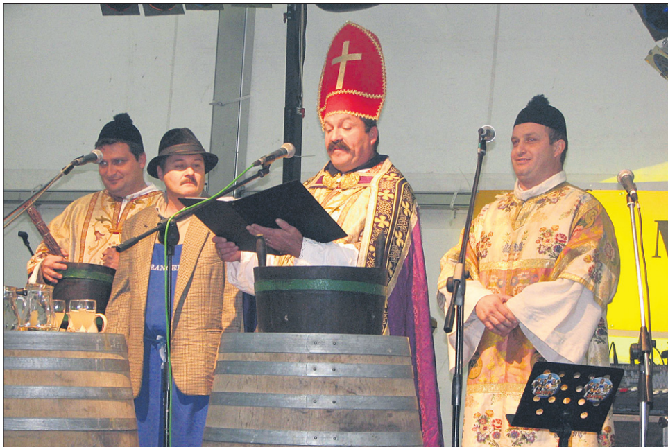
Tudi letos bo prikazan šaljivi krst mošta, ki se na martinovo spremeni v mlado vino.

Sobotno dogajanje se bo pričelo z 10., jubilejnim Martinovim pohodom med ormoškimi goricami. Dopoldan bodo potekali muzejski vikend z delavnico za otroke, ogledi kleti P&F Jeruzalem Ormož, gradu in Grajske pristave ter Martinova tržnica s kultur-