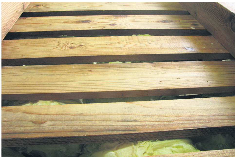
Glave zelja kisamo brez obtežbe z vretenom.

Kislo zelje hranimo v hladnem, temnem prostoru. Obtežimo ga samo še z 10 % teže od skupne mase kislega zelja.