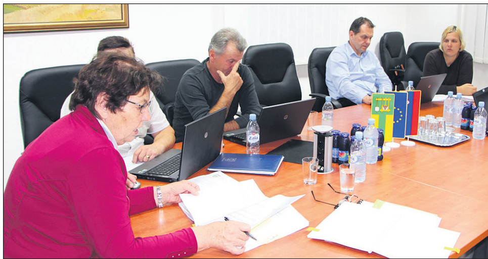
Svetniki občine Zavrč so določili novo ceno vrtca, ob tem pa sklenili, da bo stroške razlike med dejanskim številom in zgornjim normativom do zapolnitve mest krila občina. O ukinitvi kritja stroškov plenice in posteljnine v vrtcu zaenkrat ne razmišljajo, kljub temu da tega mnoge občine ne financirajo.