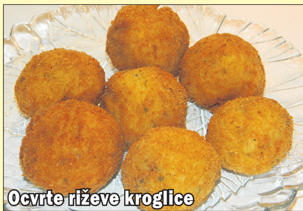
Ocvrte riževe kroglice