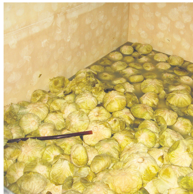
Glave zelja z vreteni (koceni), pripravljene na kisanje.

Napačna barva pomeni prisotnost napačnih bakterij, ki so običajno posledica prisotnosti zraka ob kisanju. Pospešen