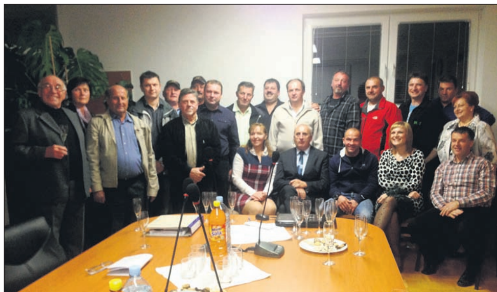
Utrinek s sprejema pri županu občine Juršinci