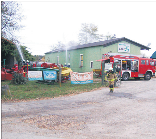
Pri gašenju domnevnega požara na objektih podjetja Agroles so uporabili tudi požarno vodo iz naselja, ki so jo zagotovili prek požarne verige iz hidrantnega omrežja.