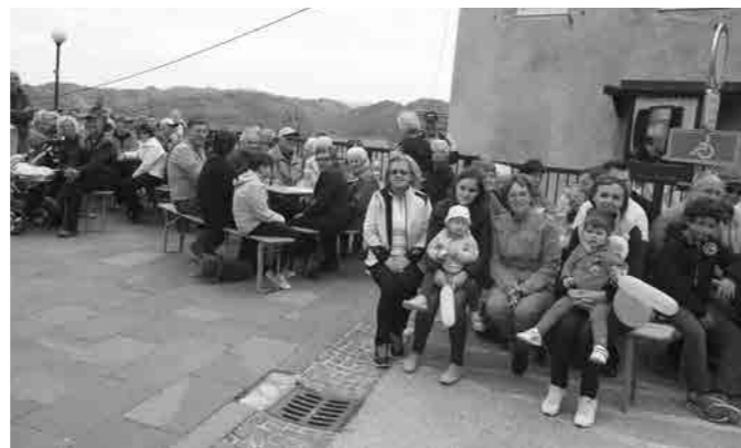
Zbrani na trgu