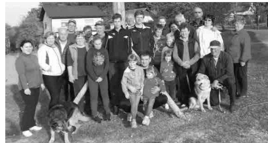
Zbrani ob majpanu na Dvoršni

poskrbeti je bilo potrebno za okras drevesa, izkopati jamo za postavitve »majpana« in izvesti še razne nujno potrebne aktivnosti. Vremensko dogajanje na dan postavitve je bilo dobro, relativno toplo in sončno vreme je privabilo lepo število udeležencev. Pri postavitvi drevesa je moškimi dana možnost, da pokažejo svojo moč, saj velja tradicija ročne postavitve, kot nekoč. Toda letos smo vsi navzoči nemočno zaznali veliko moč narave, ko je bilo drevo že skoraj postavljeno, je nepričakovano, iznenada zapihal orkanski veter, izredna moška moč je morala kloniti moči narave in drevo je padlo, hvala bogu, ni prišlo do nesreče. Po umiritvi vetra so požrtvovalni moški postopek ponovili in uspešno postavili drevo. Ob pijači in slastni jedi ter pecivu iz kuhinj naših gospodinj se je začelo veselo in prijetno druženje, izmenjali