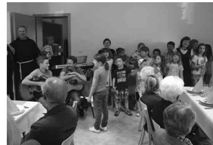
Starejše so razveselili mladi pevci in glasbeniki