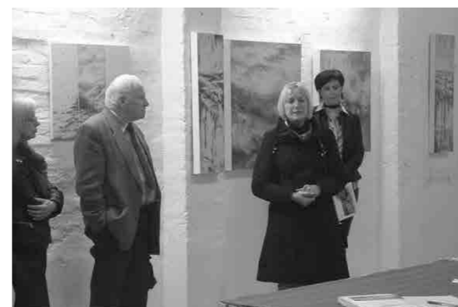
Ob odprtju razstave je spregovorila tudi gospa županja