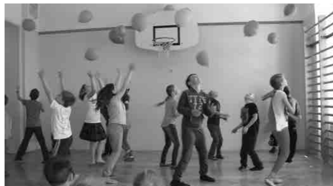
Ples z baloni