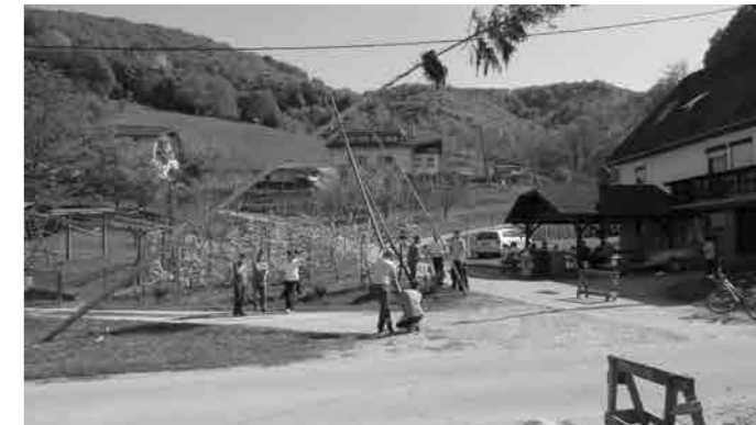
Majsko drevo se je dvigovalo kvišku