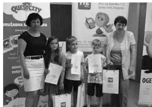
Nagrajenci z mentoricama

Na razpisu je sodelovalo 439 likovnih in literarnih del pod vodstvom 81 mentorjev. Nagrajena likovna in literarna dela niso rangirana, ampak so med seboj enakovredna. Čestitamo!