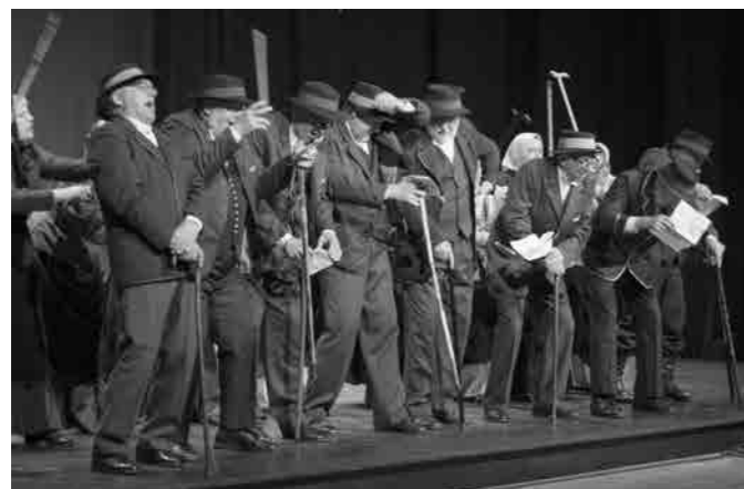
V Bergltancu so se izkazali veterani AFS Študent

ravljeni na pričetek 51. rednega letnega nastopa Akademске folklorne skupine Študent Maribor. Na odru KPC-ja je nastopilo okrog 100 plesalcev, med njimi tudi veteranska skupina KUD Študent Bela krizantema, ki je občinstvo navdušila z »Bergltancom«. Moram priznati, da so me plesni veterani navdušili ne le z energijo, pač pa tudi s pravo gledališko igro na odru in njihova točka je bila zadetek v polno.