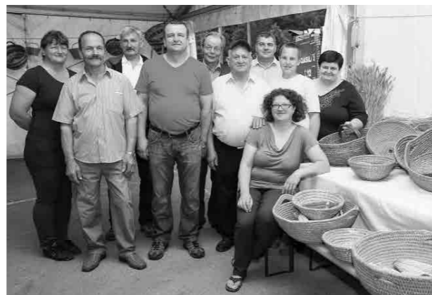
»Varuhi« podeželja v Stopercah

družina Lorber iz Zg. Sveče, s katerim so »ogrebali« čebele ali pa je služil kot začasni panj. Po podelitvi priznanj smo izžrebali tri »srečnice«, ki so dobili bogate nagrade. Prav tako pa smo se prijaviteljnim domačijam zahvalili za skrb pri ohranjanju kulturne dediščine domačega kraja s priznanjem, fotografijo