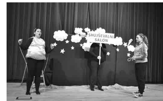
Luna v Shujševalnem salonu

Kot mentorica, režiserka, dramaturginja lahko z veseljem in ponosom trdim, da je bilo delo z dekleti zelo lepa izkušnja, saj