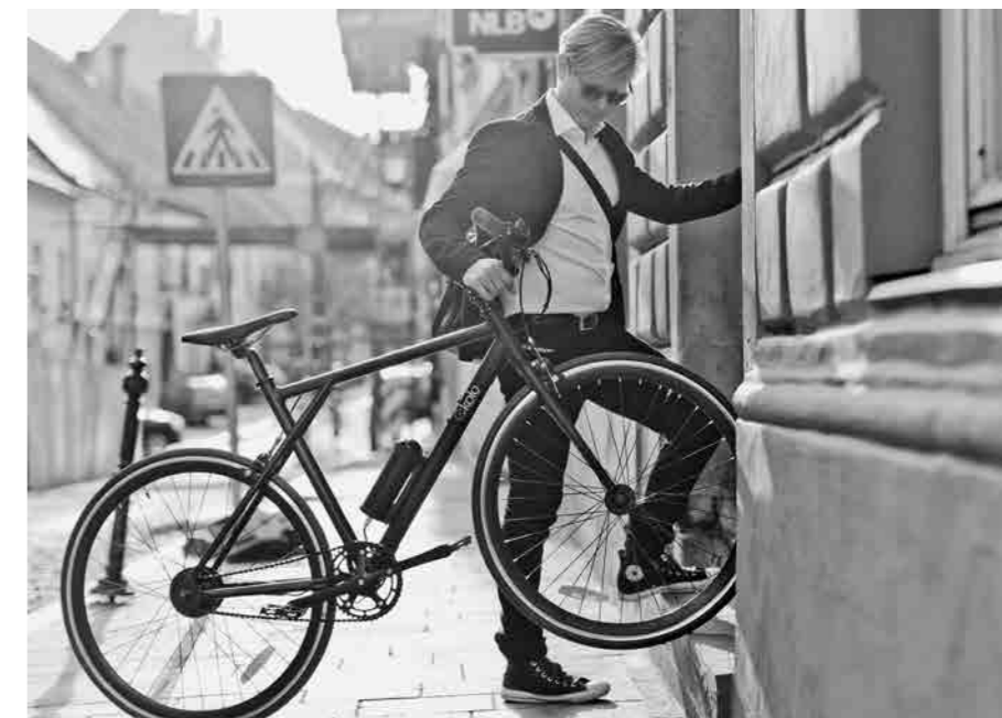
Z e-kolesom v službo in nazaj

Kolesa so naprodaj, nudimo pa tudi hiter servis ter možnost za dnevni, mesečni ali sezonski najem koles za posameznike in podjetja.