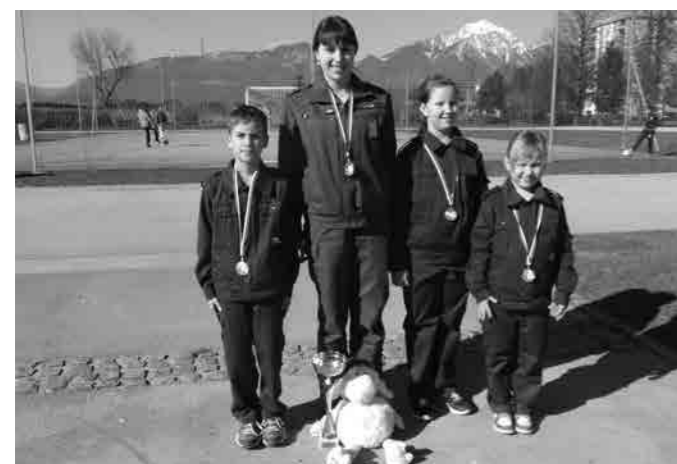
Zmagovalna ekipa – državni prvaki!