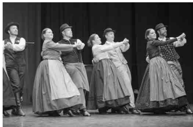
Folkloristi so zaplesali tudi haloške plesne

ravljeni na pričetek 51. rednega letnega nastopa Akademске folklorne skupine Študent Maribor. Na odru KPC-ja je nastopilo okrog 100 plesalcev, med njimi tudi veteranska skupina KUD Študent Bela krizantema, ki je občinstvo navdušila z »Bergltancom«. Moram priznati, da so me plesni veterani navdušili ne le z energijo, pač pa tudi s pravo gledališko igro na odru in njihova točka je bila zadetek v polno.