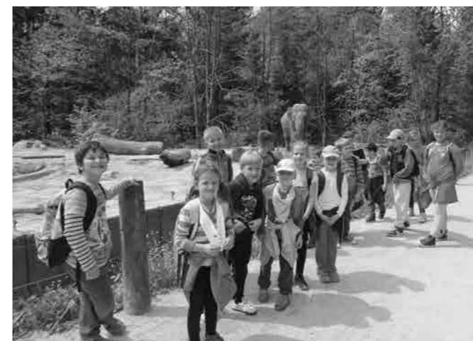
Bili smo tudi v živalskem vrtu

pina je odšla najprej na ogled, mi pa smo se rokovali z živalmi. Voditeljica je prinesla žival in vsi smo vedeli, da je kača in res, prinesla je kraljevskega pitona. Lahko smo ga pobožali, tipali in ga imeli okrog vratu. Nato je prinesla kunca, ki je bil zelo srčkan. Za tem smo odšli na kratek ogled po živalskem vrtu z Asimom; spoznali smo zebre, žirafe, bobre in dva morskata