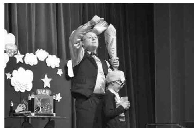
...in mleko, ki izgine v neznano

Kaj vse smo videli! Čarodej Janez se je igral z Luno, ki se mu je nenehno skrivala, imel je težave z nagajivimi ruticami, fantu je potegnil eno iz rokava... Seveda je imel na odru tudi