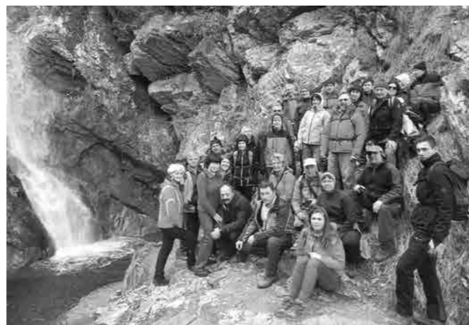
V Borovniškem peklu

na njegov južni vrh, ki ponuja pravo malo adrenalinsko doživetje. Do samega vrha je pot v zadnjih metrih speljana preko ozkega z jeklenicami zavarovanega prehoda. Na samem vrhu, kjer je prostora samo za 10 do 15 ljudi, pa dobiš občutek, kot da stojiš nekje visoko na razgledni ploščadi. Zanimivo je bilo to, da so otroci najbolj uživali prav na tem zadnjem vzponu. Pot smo zaključili v Rimskih Toplicah, kjer smo se sprehodili skozi zdraviliški park, ki nas je presenetil z ogromno sekvojo, za objem katere smo potrebovali kar 12 parov otroških rok. Prvomajski prazniki so bili že tradicionalno namenjeni