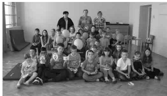
Postali smo člani Rdečega križa

V drugem razredu smo bili v torek, 19.5.2015, sprejeti med