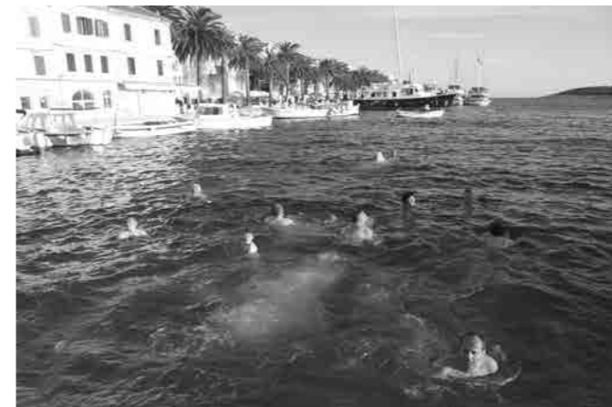
Osvežilni skok v morje na Hvaru

spoznavanju otokov pri naših sosedih Hrvatih. Letos smo planinarili po Hvaru. Na samem potepanju smo prvi dan z ladjico spoznali znamenite Paklene otoke. Drugi dan je bil prav planinski, saj smo po začetnem ogrevanju z ogledom