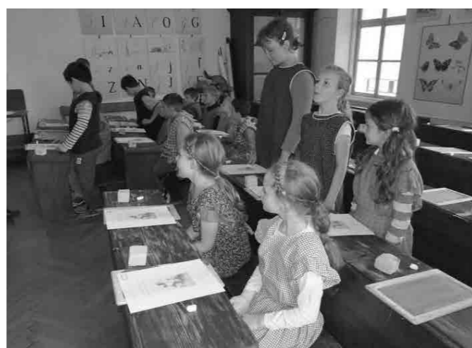
V »stari« šoli

Ko smo prišli v Ljubljano, smo najprej pojedli sendviče na Kongresnem trgu in nahranili golobe z ostanki naše malice, nato pa odšli v šolski muzej. V muzeju smo se razdelili v dve skupini in si najprej ogledali razstavo. Po ogledu smo zavrtili čas nazaj in odšli na učno uro iz leta 1865, ki jo je vodil gospod učenik. Bilo strašno in ura mi ni bila niti malo všeč, ampak videli smo, kakšen pouk so imeli v nedeljski šoli. Ura je bila končana in vsi smo si oddahnili. Z avtobusom smo se odpeljali v živalski vrt, ki smo ga že nestrpno čakali. Ko smo prispeli, smo najprej malicali in si ogledali domače živali ter opice. Kasneje smo se zopet razdelili v dve skupini. Prva sku-