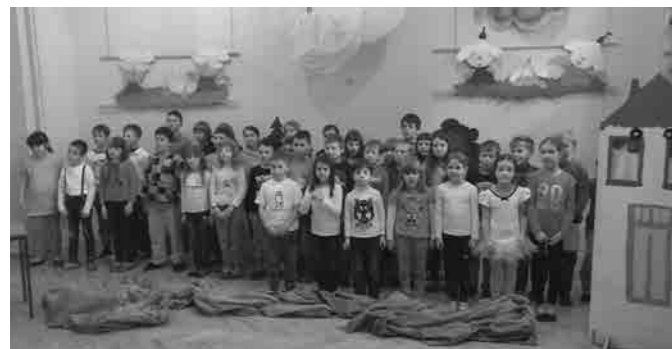
Pomlad so v naše kraje vabili tudi na Ptujski Gori

Prireditve se je začela s slovensko himno, ki jo je zapel šolski pevski zbor. Učenki, ki obiskujeta baletno šolo, sta zaplesali