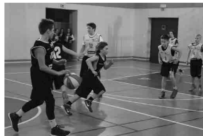
Sobota (20:40). Tekmovanje smo zaključili z drugim mestom, kar pomeni 9. – 16. mesto v državi. Čestitamo.

Polfinalno tekmovanje je organizirala najboljša šola iz Prekmurja. Tekma z drugo najboljšo šolo iz Maribora, OŠ Ludvika Pliberška, je bila prikaz odlične igre. Najboljša predstava v dosedanem tekmovanju naše ekipe! Po zmagi z OŠ Ludvika Pliberška (54:29) so pošle moči v tekmi proti OŠ I. Murska