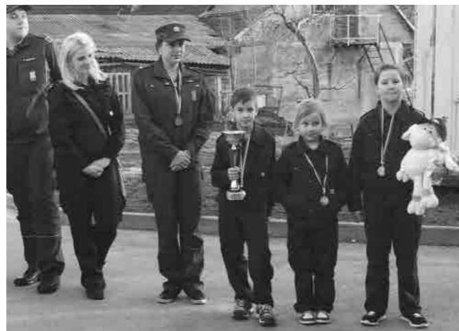
Ponos ob prejeti medalji in pokalu!

Pomembno je, da ponese ime lokalne skupnosti, ime občine Majšperk po širni Sloveniji in pomembno je vedeti, da imamo v občini že druge državne prvake v gasilsko-tekmovnih disciplinah, zraven članic 112 iz PGD Majšperk je to uspelo še pionirjem iz PGD Majšperk – Breg. Ja, očitno je gasilski talent doma v naši občini.