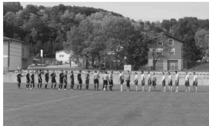
Pred pričetkom tekme