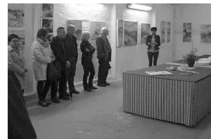
Zbrani ob razstavljenih delih dveh sošolcev

slovenskega krajinarstva, ki gradijo svoj prepoznavni likovni izraz na tradicijah barvnega realizma in impresionizma, ohranjajoč hkrati običaj ustvarjanja na prostem, kar se pri umetniku odraža tudi v smislu številnih udeležb na slikarskih kolonijah povsod po domovini.