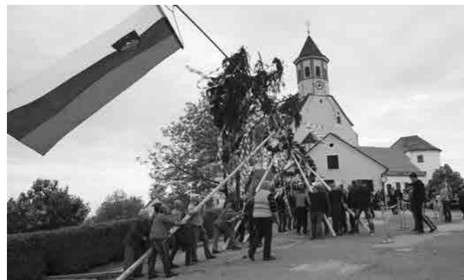
Postavljanje majskega drevesa