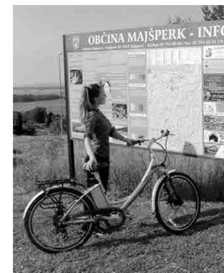
E-kolo tudi v Majšperku

so razvita in dizajnirana v sosednji Avstriji, kjer so v preteklih letih širom sveta prodali že preko milijon koles. Imajo tudi TÜV in CE certifikat ter Samsung baterije in elektroniko«, še doda sou-