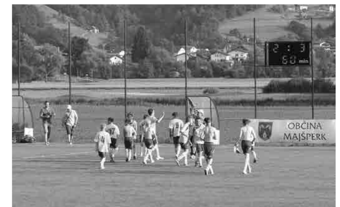
Veselite na igrišču je bilo izjemno!

Po finalnem obračunu s prvakom vzhoda NK Leskovec so postali našo mladi upi postali ŠAMPIONI, saj so prvaki lige mlajših dečkov MNZ Ptuj za sezono 2014/2015. VSE ČESTITKE, FANTJE!