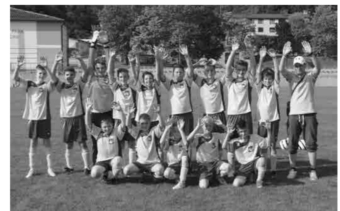
Tako so uspeh proslavili naši šampioni!