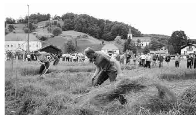
Stoperčani so hitri kosci

V šotoru so si lahko obiskovalci ogledali razstavo izdelkov iz slame, KPD Stoperce je namreč letos v svojem natečaju zbiralo te izdelke. V natečaju je sodelovalo 7 stoperskih kmetij,