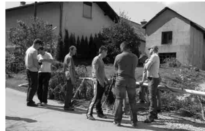
Med pripravami na postavitve mlaja