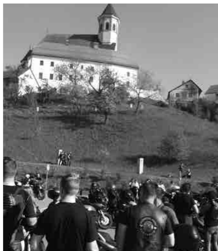
Motoristi na parkirišču pod baziliko

V soboto, 25. aprila, 2015, na lep pomladni dan je potekalo tradicionalno srečanje in blagoslov motorjev in motoristov na Ptujski Gori. Organizatorji srečanja so bili, kot vsako leto do sedaj, MK Tulipan iz Cirkovc, ki so poskrbeli za samo dogajanje v njihovem kraju. S kraja dogajanja so se podali na čudovito panoramsko vožnjo skozi okoliške kraje proti Ptujski Gori. Srečanja in blagoslova so se udeležili številni motoristi od blizu in daleč. S svojimi konjički so se pripeljali na spodnje parkirišče pod baziliko Marije