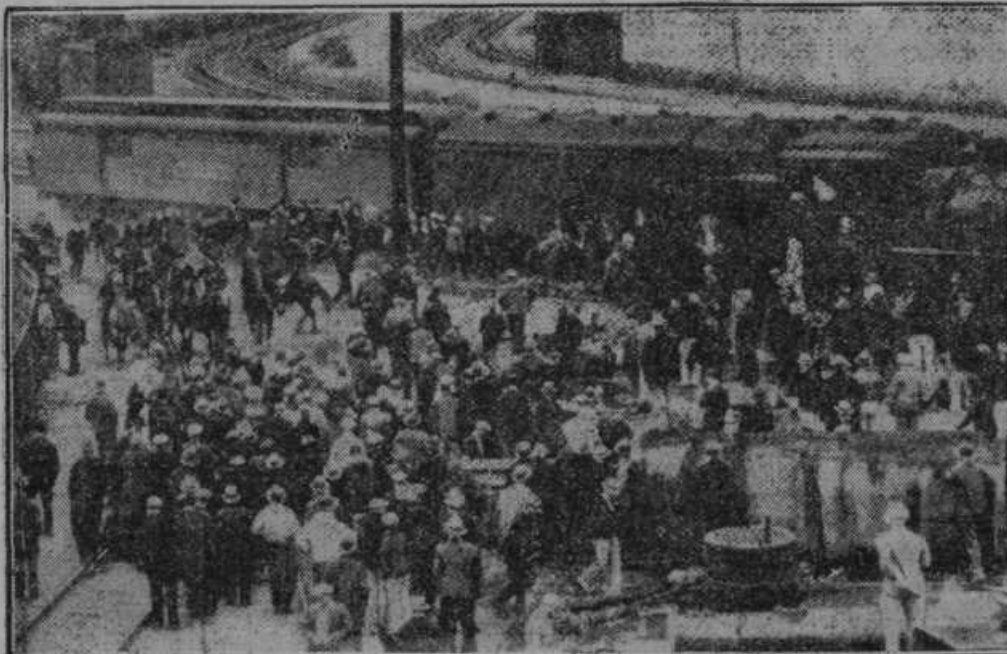
Policija na konju naganja v ameriški prestolici v Washingtonu stavkarje iz koločvora.

bilo omenjenega popoldne pri: Sv. Venčeslu, Sp. in Zgor. Ložnici, na Cigoncah, Videžu, Zafostu in Črncu.