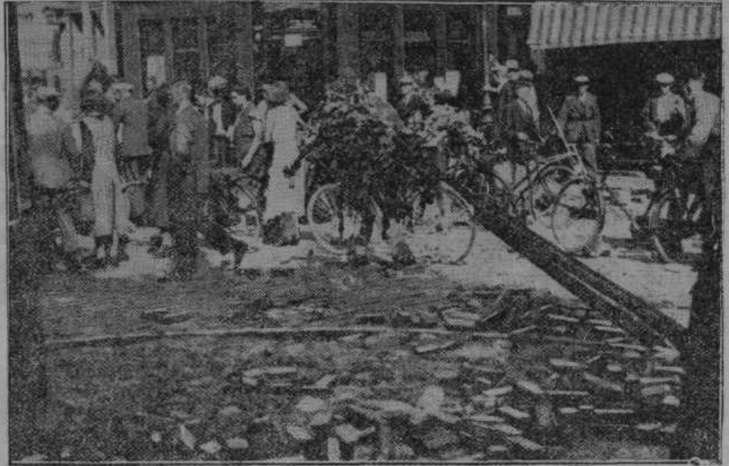
Komunistična razdejanja v Amsterdamu na Holandskem