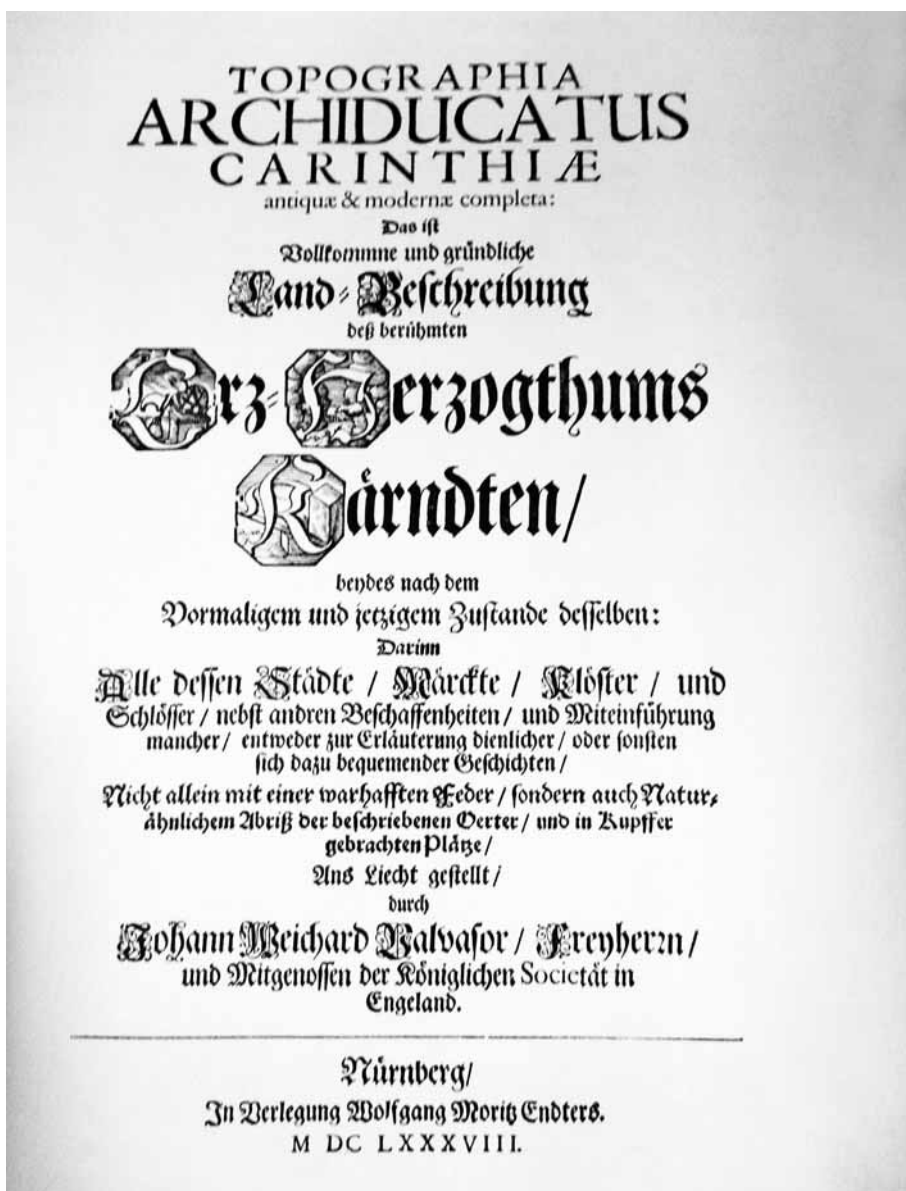
Slika 3: Naslovnica Popolne topografije Koroške iz leta 1688.