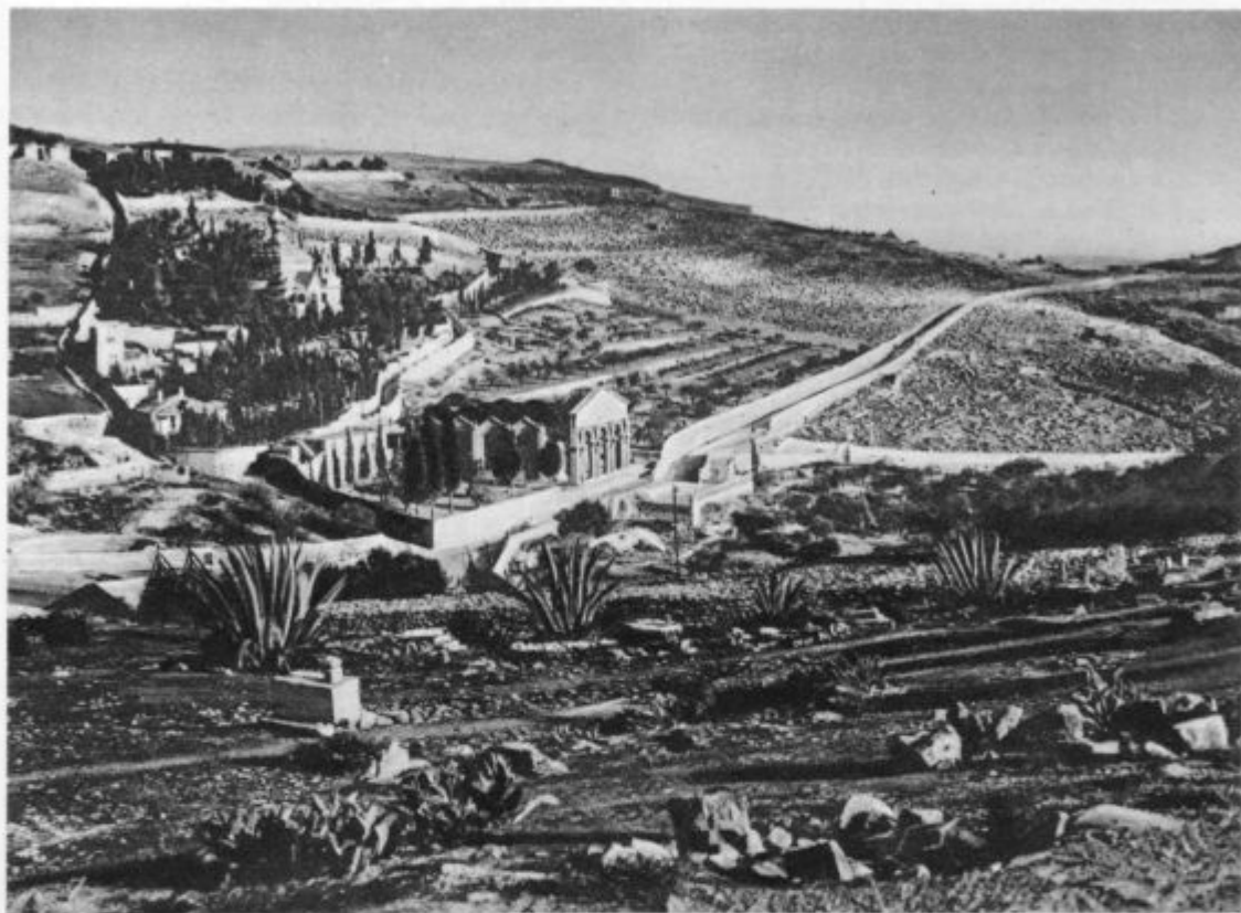
Jeruzalem. Oljska gora z vrtom Getzemane

ve, se je ženska skrila za pretkani zagovor, da ji je vse to zaupal tak človek, ki vse dobro ve in je vse to že sam preskusil. Zanimanje za očetovski klic je za nekaj časa zaspalo z izgovorom, da hočemo imeti mir med seboj in da se kregali in prepirali ne bomo. In sovražili tudi ne. In vendar so skoraj isti ljudje stali vsak teden pred vrati okrajnega sodišča, kjer so prali in čistili in izmivali razžaljeno čast in se pravdali za prazne besede. Ko pa po dobljeni ali izgubljeni pravdi čast ni bila niti za las boljša, denarnica pa precej lažja, so se hudovali nad Petrom ali nad Pavlom in še nad Jakom, da »nas je spravil v take stroške...«