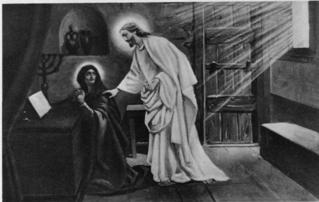
Jezus se prikaže po vstajenju Mariji

Bogu ne moremo ničesar dati, česar že nima; mar mu je samo eno: naša ljubezen do Njega.