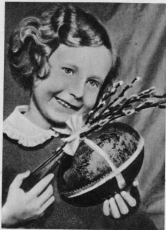
„Voščim vsem obilo velikonočnega blagoslova in želim lepih pirhov!“

Oče se je zamislil, mati se je zresnila in tudi Francki je bilo nerodno pri srcu. Nekaj je slutila, pa ničesar razumela.