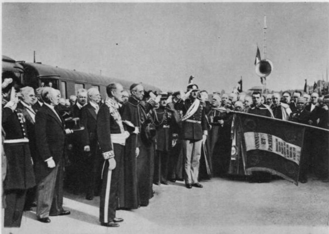
Sprejem kardinala Evgena Pacelli-ja, sedanjega papeža, ko je prišel (1937) kot zastopnik Pija XI. v Lisieux k posvečenju nove bazilike sv. Terezije Det. J.