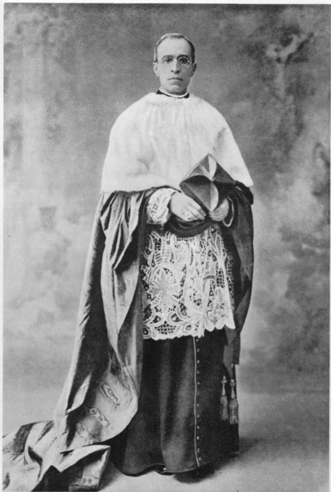
Papež Pij XII.