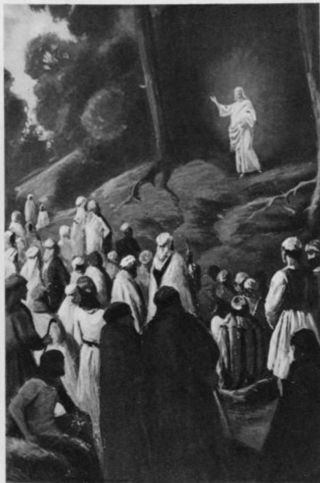
„Potem se je (Jezus) prikazal več ko 500 bratom naenkrat.“ (I. Kor 15, 6.)

Kar svet ima zdaj skrito, bo enkrat vse očito.