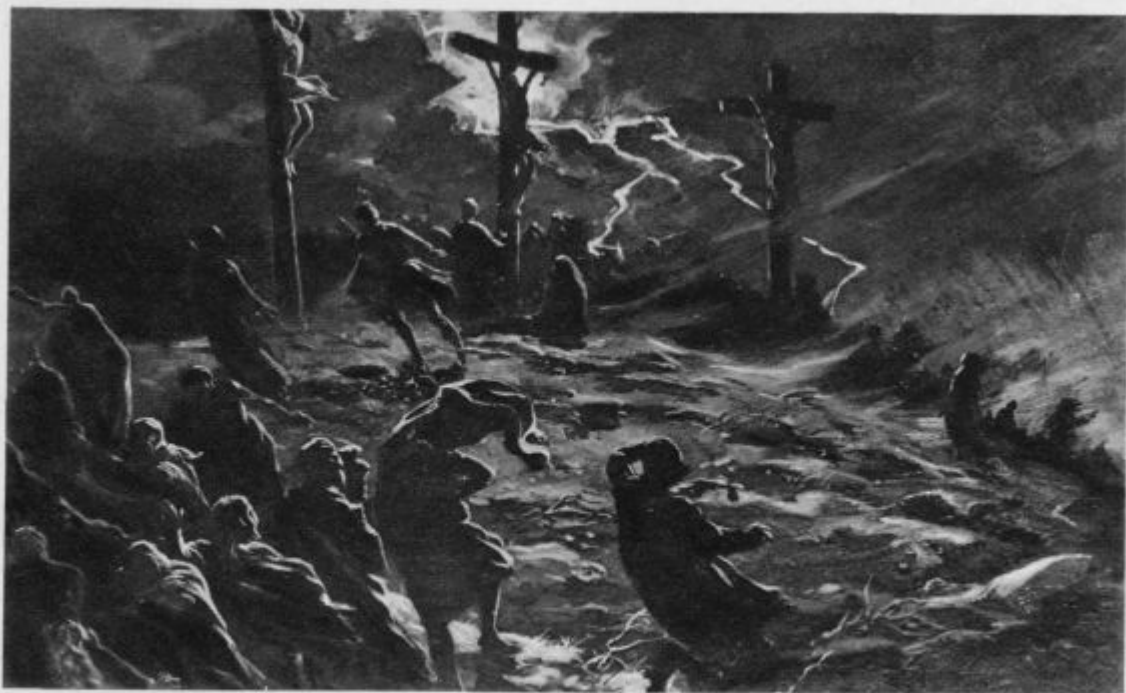
Jezus umrje na križu. — „Jezus je zaklical z močnim glasom in izdihnil. In glej... zemlja se je stresla, skale so se razpočile, grobovi so se odprli in mnogo teles svetnikov je vstalo.“ (Mt 50—53.)

Armenski in grški begunci, ki so vsled grško-turške vojske zašli v težave, so dobivali od Pija XI. vsestransko pomoč. Nič manj ko