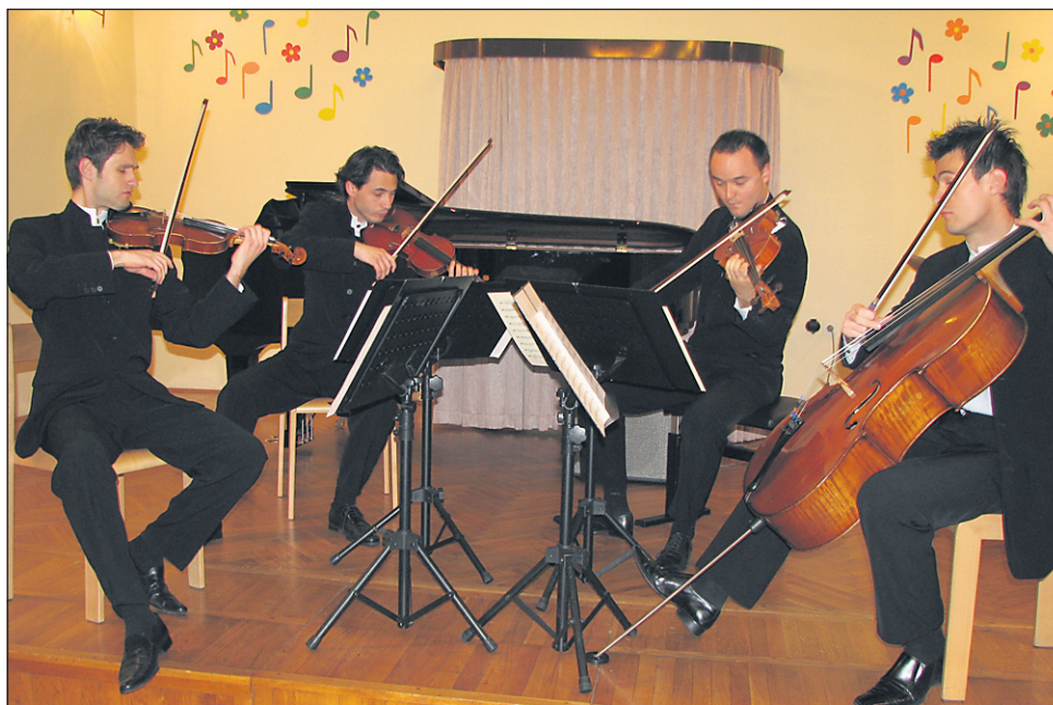
Koncert se je začel z nastopom Godalnega kvarteta Feguš.

Ker so učitelji ponavadi tisti, ki k vadbi spodbujajo učence, nas je zanimalo tudi, kako je videti, ko morajo vaditi oni sami. »Ko se začnejo priprave na koncert, zavladajo posebno vzdušje. Začnemo se dogovarjati, iskati skladbe ter