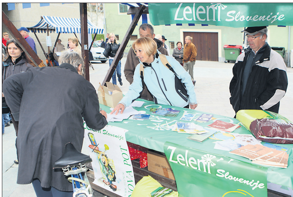
Zeleni Ptuja so ob dnevu Zemlje izvedli tudi anketo, ki jim bo služila za pripravo potrebnih ukrepov za izboljšanje stanja okolja na Ptuj in v Spodnjem Podravju.