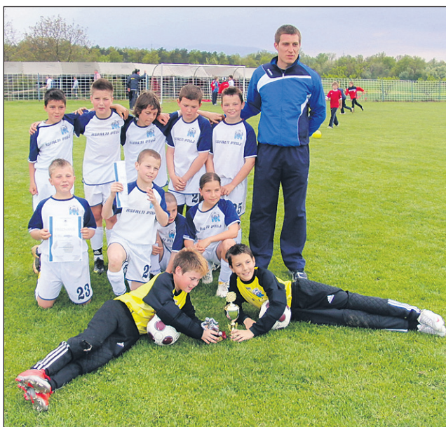
Zmagovalna ekipa turnirja U-10 v Zlatoličju: NŠ Poli Drava Ptuj