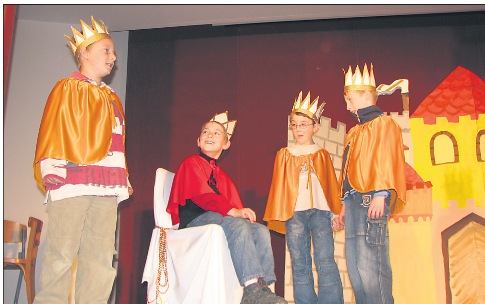
Mali gledališčniki OŠ Stanka Vraza Ormož med predstavo Kralj in njegovi trije sinovi

S temi predstavami je zaključila ogled letošnje sezone, v kateri je spremljala več kot 60 uprizoritev: »Ugotavljam, da tudi v otroško gledališče prihaja ogromno glasbe in plesa. Nenavadno je, da sem videla precej muzikalov, saj je to težka gledališka zvrst. Letos je najbolj množična produkcija tretje triade, zato bo moj izbor temeljil na želji prikazati najboljše iz te produkcije. Teksti za to stopnjo so zelo šibki ali pa jih skoraj ni, zato se mentorji lotevajo priredb, pišejo celo sami. Tukaj vidim nalogo Javnega sklada – treba je začeti spodbujati avtorje, ki bi pisali tudi za otroke med 13 in 16 letom.«