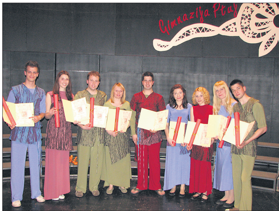
Na koncertu ob petletnici so pevci, ki so v zboru že od vsega začetka, tudi prejeli bronaste Gallusove značke, priznanja za več kot petletno udejstvovanje v ljubiteljski glasbeni dejavnosti.

Ta dogodek se bo tako pridružil že mnogim nepozabnim iz njihove preteklosti, na primer koncertom Na svetu lepše rož' ce ni, Božična glasbena skrivnost, Glasbene raz-