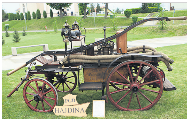
Na priložnostni razstavi vozil iz petih občinskih gasilskih društev je največ občudovanja vzbudila ročna vprezna črpalka iz leta 1913, ki so jo v PGD Hajdina uporabljali do leta 1955. Leta 1913 so zanjo plačali 2269 kron.