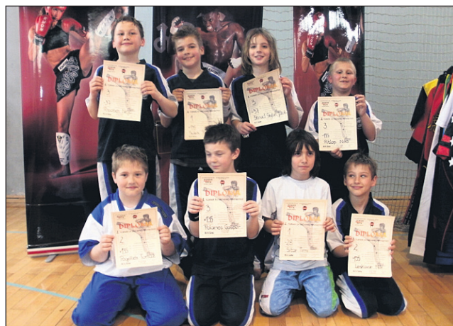
Najmlajši tekmovalci Ptujja v Murski Soboti