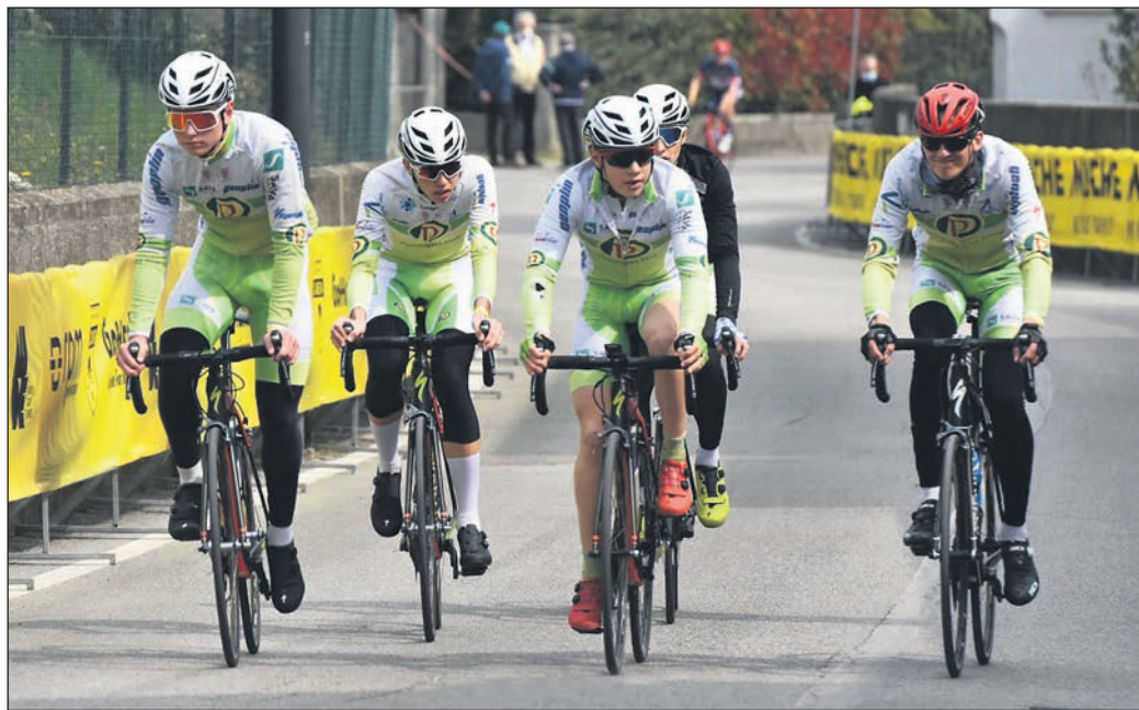
Člani ekipe starejših mladincev KK Perutnina Ptuj na tekmovanju v Italiji