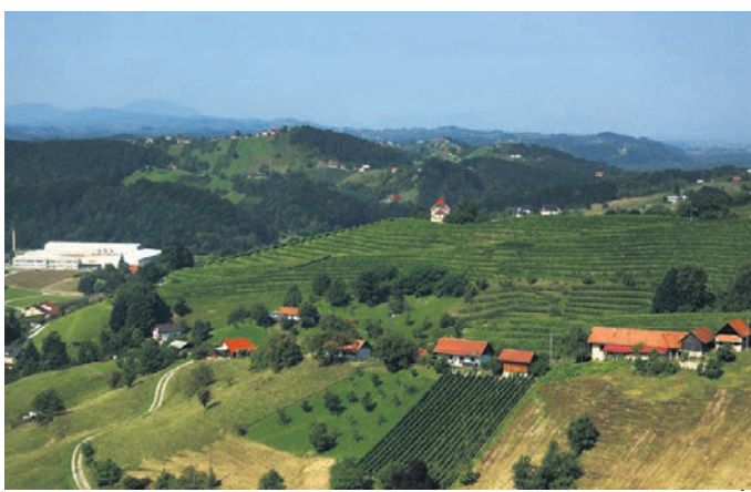
Podjetja ali podjetniki v obmejnih občinah lahko pridobijo denar tudi za nakup turističnih nastanitvenih objektov.

Po besedah Ksenije Golob iz Bistre gre za sofinanciranje vzpostavljanja nove poslovne enote ali širitev obstoječih zmogljivosti, če gre za razvoj novih proizvodnih storitev ali bistveno spremembo proizvodnega procesa. Podjetja lahko denar porabijo za nakup strojev in opreme, ki so v primeru malih in srednjih podjetij lahko tudi rabljeni, denar pa lahko vložijo tudi v nematerialne naložbe, kot so