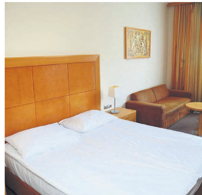
Foto: CG Hotel Primus je zadnje goste sprejel oktobra lani. Pogled na prazne sobe je žalosten.

Epidemija koronavirusa in ukrepi, povezani s tem, so mnogim podjetjem povzročili ogromno gospodarsko škodo. Med najbolj prizadetimi je prav področje turizma. Turistične kapacitete so zaprte že polnih pet mesecev. In očitno bodo še kar nekaj časa. O tem, kakšna je poslovna škoda na ta račun in ali je že rezultirala v odpuščanjih, v skupini Sava turizem, ki zaposluje okrog 1.500 ljudi, pravijo: »Naše turistične kapacitete so za turistične goste, torej lani in letos, zaprte že skupaj skoraj šest mesecev. Izpad prihodkov iz naslova zaprtja