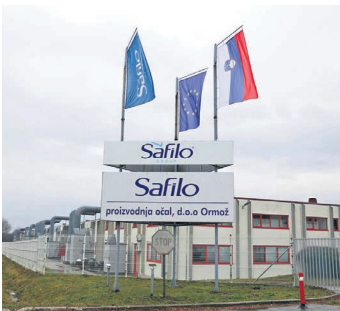
V ponedeljek je potekal pomemben sestanek za skoraj 560 zaposlenih v ormoškem Safilu. Sestali so se predstavniki sindikata delavcev in vodstvo Safila. Še zadnji upi, da bi proizvodni obrat v Ormožu obstal, so se razblinili. Sindikatu tako ne preostane drugega, kot da poskuša izpogajati čim višje odpravnine.

Izdatna državna pomoč bi najbrž lastnike ormoške proizvodnje očal lahko prepričala, da obrata še ne zaprejo. S trendi zaposlovanja, ali bolje rečeno odpuščanja zaposlenih, pa so lastniki obrata v zadnjih letih jasno nakazali, da dolgoročnih načrtov v Ormožu nimajo. Niti za obstoj obrata, kaj šele za dodaten razvoj. Tako je povsem na mestu razmislek, s koliko javnega denarja je sploh še smiselno podpirati obratovanje proizvodnje. Če že, bi bilo krepko bolj smiselno z javnim denarjem podpreti podjetja s perspektivo razvoja na tem problemskem območju. Preprosteje rečeno, namesto da se z državnim denarjem podaljšuje 'umiranje' proizvodnje italijanskega mogotca, bi ta sredstva lahko omogočila razvoj domačega gospodarstva, ki ima cilj razvijati se in rasti v Ormožu.