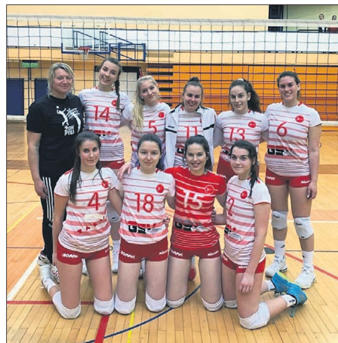
Mladinska ekipa ŽOK GSV Ptuj na turnirju v Rušah

Najbližje zmagi je bil ŽOK GSV Ptuj na obračunu proti Formisu.