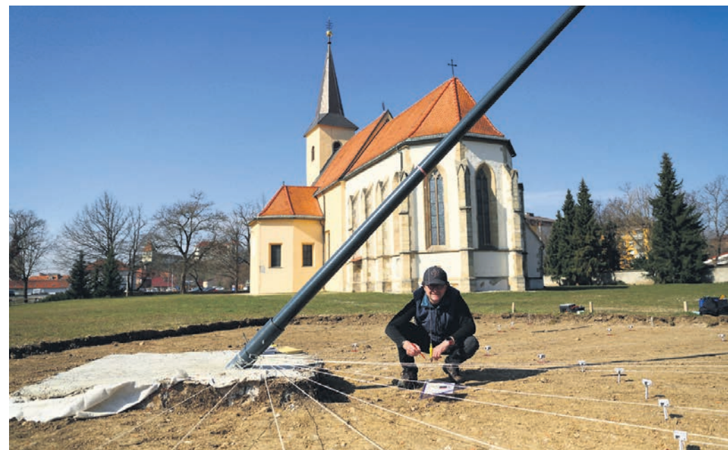
Boštjan Pavlič na delovišču sončne ure.