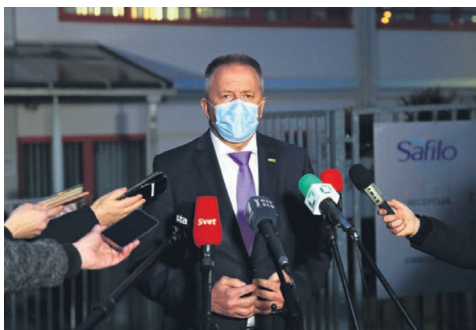
Gospodarski minister Zdravko Počivalšek je ob obisku v Ormožu obljubil pomoč države. Kot je zdaj znano, naj bi lastnikom Safila ponudili možnost sofinanciranja plač zaposlenih, a to ni bilo sprejeto.

Da je bila pomoč v tej obliki lastnikom podjetja ponujena, na