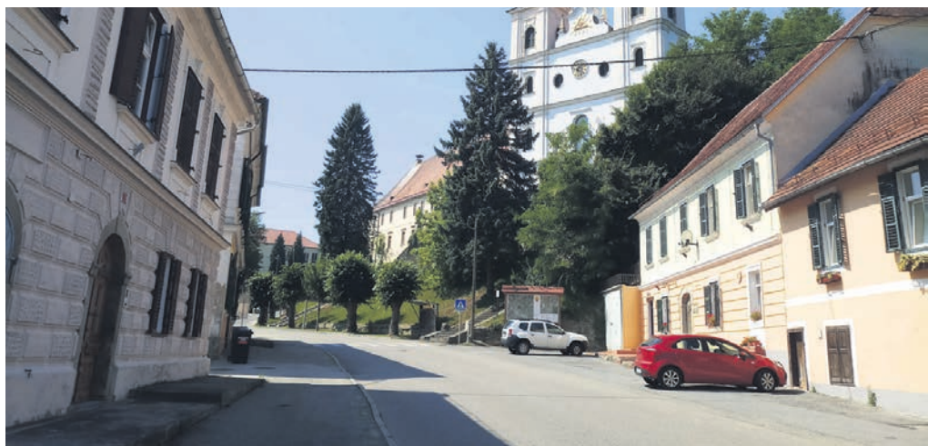
Če bi bila kupnina nižja, bi občina odkupila klasicistično stavbo v trškem jedru, v kateri sta ustvarjala pisatelja Alojz Kraigher in Ivan Cankar.

Spomnimo, da je bil pred dve-ma letoma v počastitev 60-letnice Kraigherjeve smrti v Sveti Trojici pod častnim pokroviteljstvom Slovenske akademije znanosti in umetnosti (SAZU) organiziran simpozij z naslovom Trojica pred Škrobarjem in po njem, istega leta pa so na Trojiškem trgu odkrili tudi spomenik našemu največjemu pisatelju Ivanu Cankarju, ki ga je njegov prijatelj Kraigher v Sveti Trojici gostil med novembrom 1910 in majem 1911. Javnosti je še vedno slabo poznano dejstvo, da je umetnikova največja mojstrovina Lepa Vida nastala prav v času Cankarjevega bivanja v Sveti Trojici.