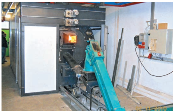
Primer kotlovnice na biomaso z avtomatskim doziranjem lesnih sekancev.

Med lesno biomaso spadajo lesna polena, lesni sekanci in peleti.