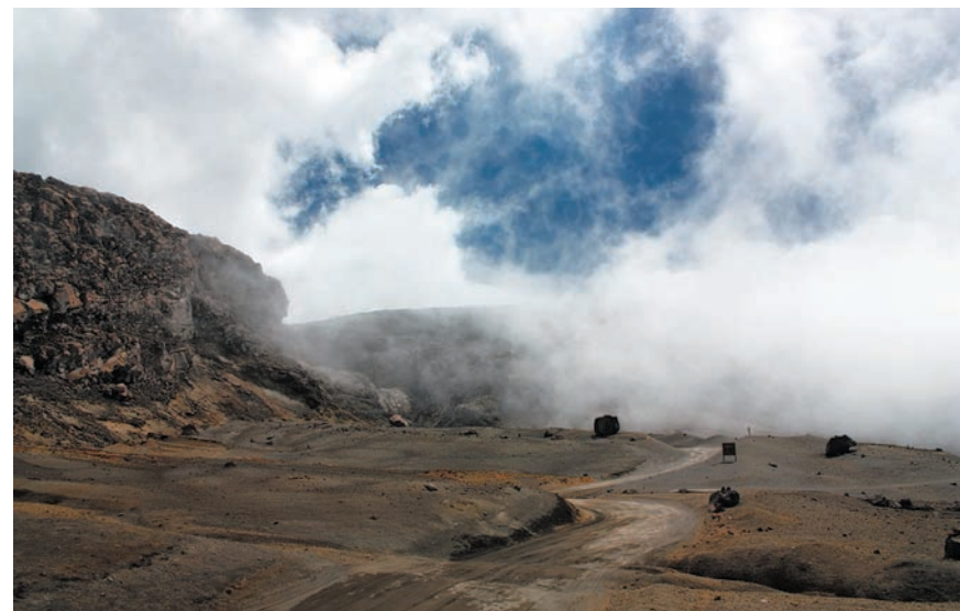
Na višini 4900 metrov, do koder je bilo v času našega obiska dovoljeno iti, se je vreme spreminjalo iz minute v minuto. Vzrok, da nismo smeli iti prav do vrha, je bila rumena stopnja nevarnosti za izbruh vulkana.

pristanke v glavnem mestu Bogota, ki predstavlja eno najvišje ležečih prestolnic na svetu. Leži namreč na nadmorski višini kar 2640 metrov, kar je približno