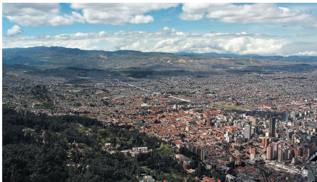
Prestolnica Kolumbije Bogota leži na nadmorski višini naše Kredarice in šteje kar devet milijonov prebivalcev.

Doživeli smo poučno in zanimivo predstavitev, kjer so nam pokazali postopek gojenja, obiranja in predelave te zelo razširjene rastline. Rastlina je zanimiva in občutljiva, zato je končni okus kave odvisen od mnogih dejavnikov, kot so npr. klimatske razmere, podlage, na kateri raste, načina obiranja, obdelave, skladiščenja in tudi transporta. Pri obdelavi je glavni po-