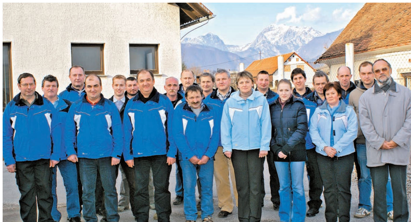
Pretežni del 24-članskega kolektiva podjetja Zarja Koviš d.o.o., ki se je v dvajsetih letih razvilo v eno pomembnejših podjetij na področju energetskih sistemov in projektov.

V kamniškem podjetju Zarja Koviš se že več kot dvajset let ukvarjajo z načrtovanjem in izvedbo večjih in manjših energetskih sistemov, proizvodnjo kovinskih konstrukcij in inženiringom. Fleksibilna, strokovno usposobljena in uigrana ekipa zaposlenih predstavlja temelje podjetja, zgrajenega na znanju in izkušnjah ter inovativnih rešitvah, ki jih je večkrat nagradila tudi strokovna javnost, podjetje pa se je razvilo v eno pomembnejših na področju energetskih sistemov in projektov. Njihov najboljši vzorčni primer, tako v Sloveniji kot tujini, so kar domače Terme Snovik.