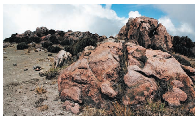
Vulkanske kamnine različnih oblik tvorijo pestro in razgibano pokrajino. Gre za piroklastične kamnine, ki vsebujejo velik odstotek poroznosti, kar pomeni, da so zelo lahke.