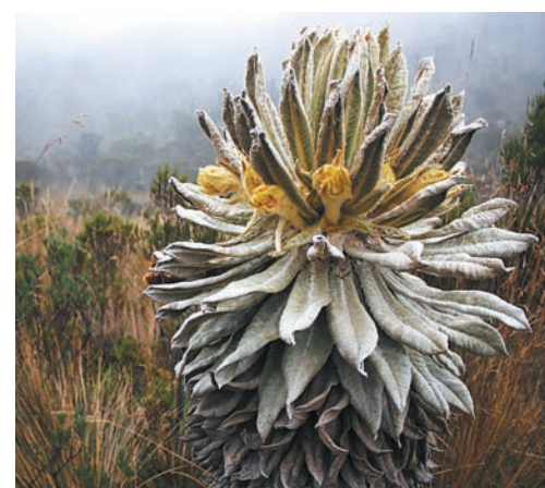
Območje okrog vulkana nudi ugodne pogoje tudi nekoliko bolj nenavadnim rastlinam.

za 5321 metrov visok vulkan, ki je bil dejaven od zgodnjega pleistocena približno dva milijona let, oblika sedanjega vulkanskega stožca pa se je izoblikovala pred približno 150.000 leti. V svoji