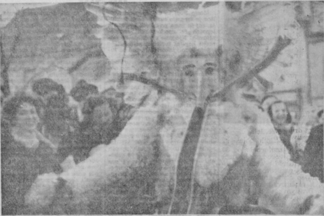
Kurenti so vsako leto najučinkovitejši buditelji predpustnega razpoloženja

prenosom glavnega dela prireditve na športni stadion »Dravec« smo omogočili številnim obiskovalcem, da so boljše videli in slišali program naših domačih in drugih pustnih skupin kot so prejšnja leta v sprednjem po mestnih ulicah in čez mestne trge.