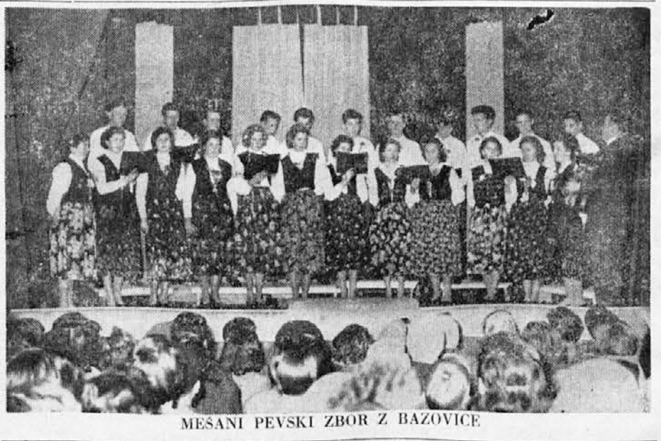
MESANI PEVSKI ZBOR Z BAZOVICE

V zadnjih desetletjih je Velika Britanija registrirala veliko več moških rojstev kot p ženskih. Leta 1920 je bilo na Angloškem 2 milijona več žensk kot p moških. Od takrat se ta razlika vidno manjša in prid moškim in, če se bo tako nadaljevalo, menijo strokovnjaki, da bo leta 1984 pol milijona več moških kot