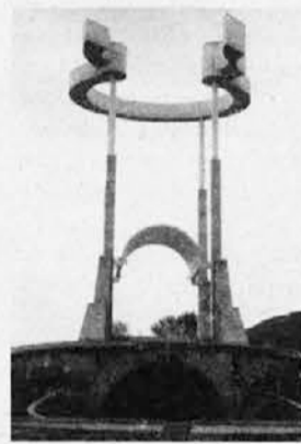
Spomenik v teharskem taborišču

Tudi tokrat so se pokazala ideološka razhajanja med poslanci vladajoče koalicije ter poslanci SDS in NSi, ki se ne strinjajo z vladnimi rešitvami, zlasti tistimi, ki zadevajo ureditev t. i. zamolčanih grobišč žrtev povojnih zunajsodnih pobojev vojakov in civilistov. Na ta grobišča bi morali zapisati, da gre za „žrtve revolucije“.