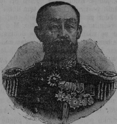
Japonski admiral Togo.

Iz tega sledi, da se je Stakelbergu deloma posrečilo izvabiti Japonce od združenja izpred Port Arturja. Boril se je junaško s sovražnikovo premočjo.