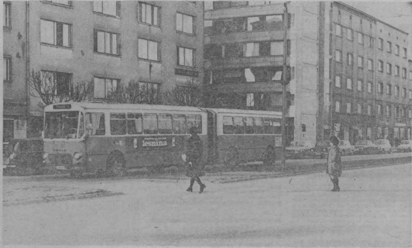
Na prehodu za pešce pred GR bo bolj varno, ker bo avtomobiliste opozarjal svetlobni znak