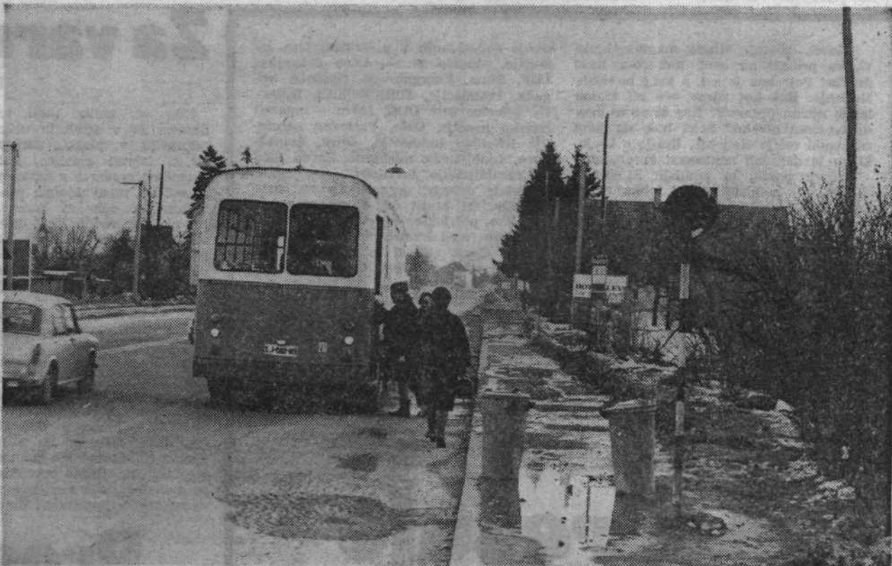
V letošnjem občinskem proračunu je predviden denar tudi za asfaltiranje pločnikov na obeh straneh Titove ceste, od Stožice do Ruskega carja. Doslej je bilo pri Ruskem carju avtobusno postajališče med lužami, blatom in posodami za smeti. Pločnik so razkopali pred letom dni, ta čas pa se nikomur ni zdelo vredno vreči nekaj lopat peska in pločnik vsaj za silo urediti. Končno bo vse v redu.

Ljubljana, 24. februarja 1972 Leto XII., številka 1 (95)