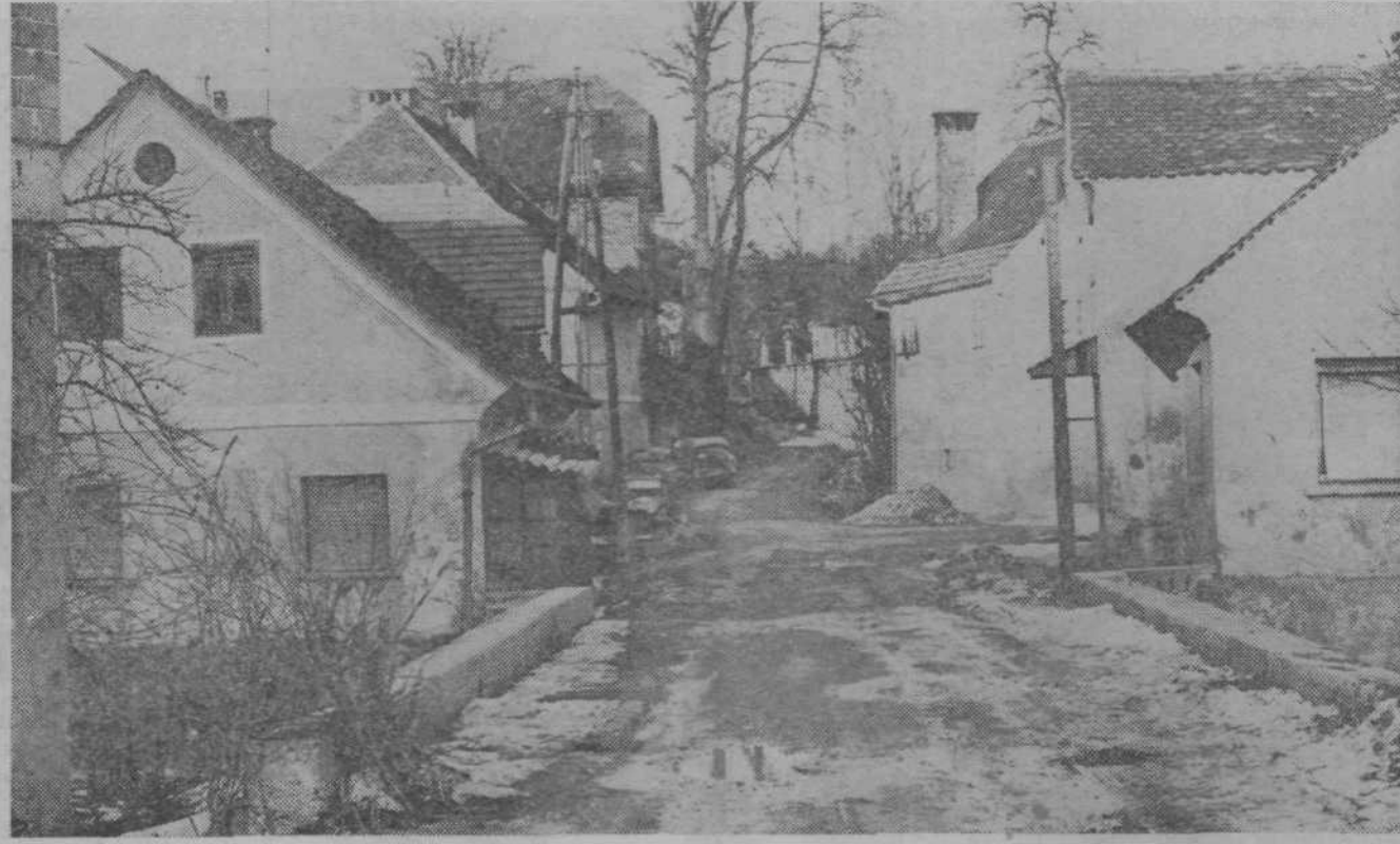
Tudi cesta Stare Crnuče je prišla na vrsto za asfalt. Kanalizacijo so uredili že lani