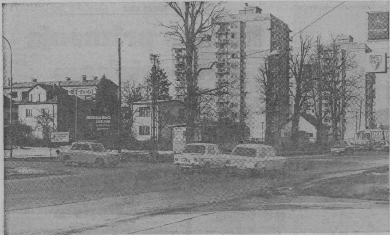
Na križišču Titove ceste in Tolstojeve ulice bo zaradi novega semaforja manj zastojev