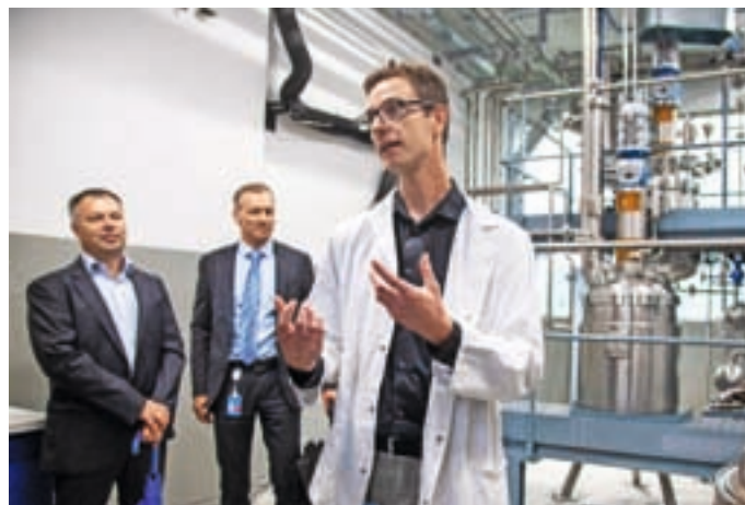
Predstavitve pilotnega reaktorskega sistema v Helios TBLUS