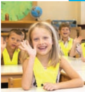
Prvi šolski dan na OŠ Preska