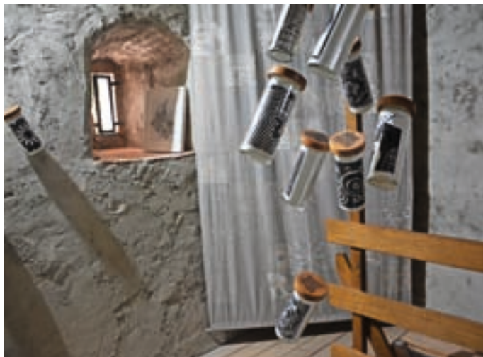
V cerkvi in v zvoniku so na ogled tudi skupnostni prti (v ozadju).

Glavni projekt Zavoda CCC z osrednjo razstavo v Žlebeh pri cerkvi sv. Marjete in z umetniškimi intervencijami na Domačiji pr' Lenart na Belem ter na Topolu tradicionalno predstavlja delovanje zavoda tistega leta in povabljenih umetnikov. Osnovno poslanstvo je sodobno umetnost pripeljati do ljudi, ki sicer v galerijske prostore ne zahajajo. »Osrednja nit je skupnost. To je vsebina, ki jo gradimo že več let, letos pa je resnično prišla do izraza. Predstavljen