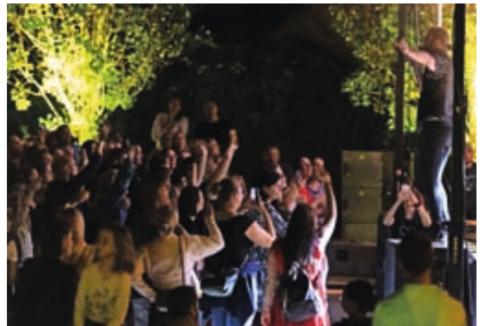
S koncertom skupine Hamo & Tribute 2 Love se je zaključilo Poletje med vodami, ki je ponudilo sedem različnih dogodkov. Koncert je bil dobrodelen, denar od prodanih vstopnic bo šel za prizadete v poplavih v Medvodah. M. B.