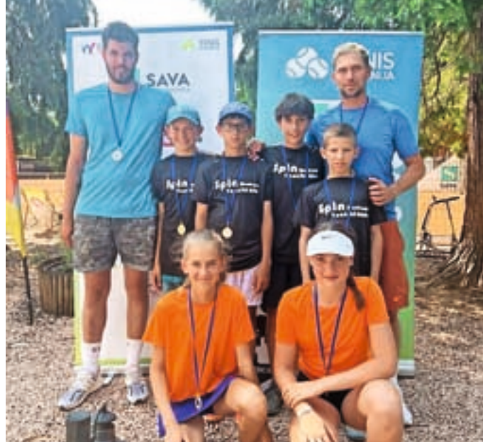
Medvoški tenisači so bili najboljši na ekipnem državnem prvenstvu za dečke in deklice do 12 let.