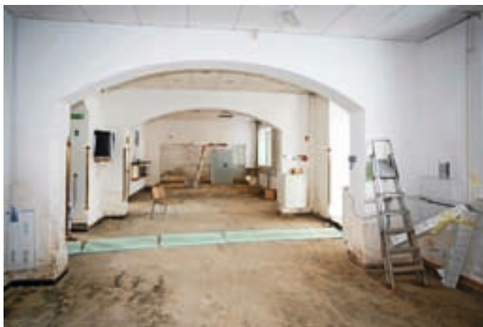
Takole je trenutno videti pritličje občinske stavbe. Krajevni urad Medvode bo še nekaj časa zaprt.