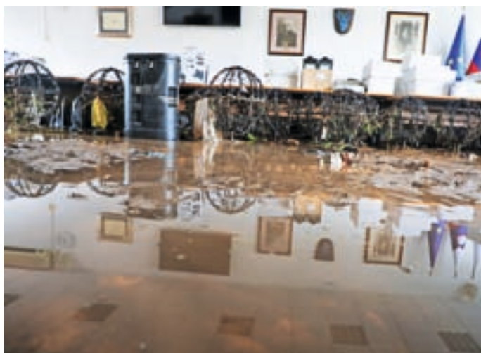
Uničena je tudi sejna soba v občinski stavbi.

Ob poplavah je bila pogosto slišana beseda 'hvala' vsem, ki so pomagali in tvegali tudi svoja življenja. Občani so pokazali povezanost in solidarnost.