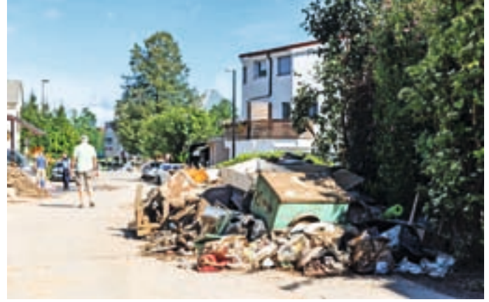
Stanovalci so odstranili vse, kar je bilo uničeno. Prizori, kot jih ne pomnimo.