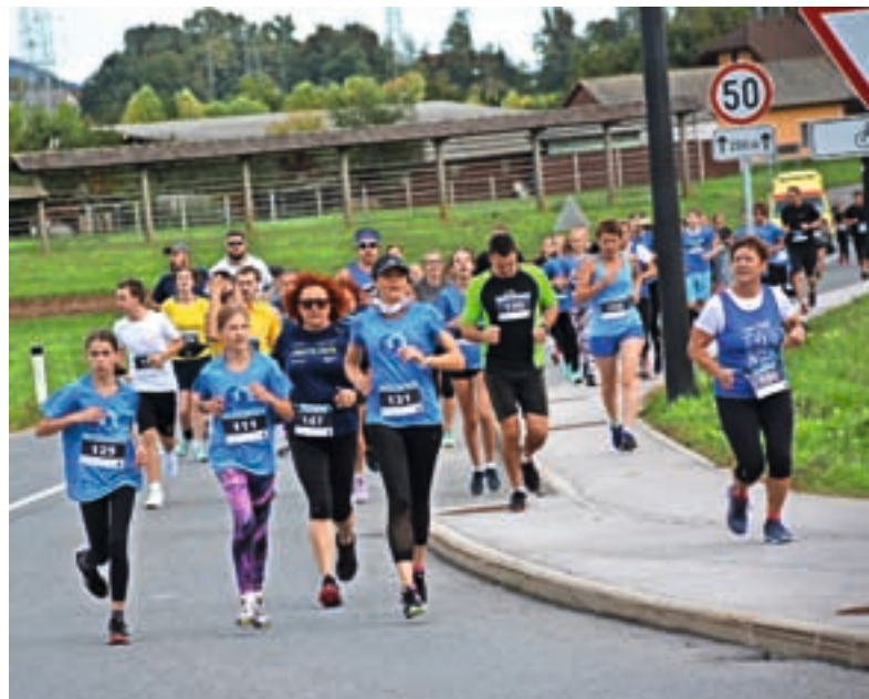
Medvoški tek vsako leto privabi številne ljubitelje teka. Fotografija je iz lanskoletne, devete izvedbe.

levo do vrtca in v cilj. Ob 15.30 bo start Vzajemkovega teka za otroke, ob 16. uri pa teka na daljših razdaljah. Od 15.30 do najkasneje 21. ure bodo ceste na trasi teka občasno zaprte s popolno zaporo. Organizatorji prosijo za razumevanje. Prijave na spletu že potekajo in so do 18. septembra po nižji ceni, prijavi pa se boste lahko tudi po tem datumu in še na dan dogodka. »Z odzivom tekačev in sodelujočih sem zelo zadovoljna, saj tek privablja tako rekreativce kot bolj resne