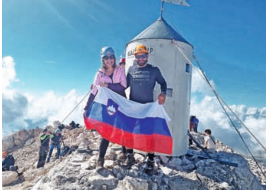
Pretekli konec tedna je z možem Matijem osvojila Triglav. Na najvišjem vrhu Slovenije je bila prvič. Pravi, da je bila hoja, poleg terapije, njena rešiteljica.

Seveda pridejo tudi slabi dnevi, ko se moram ustaviti in zajeti zrak, ampak sedaj vem, kakšna je lahko cena, če tega ne bom naredila, in niti za trenutek ne