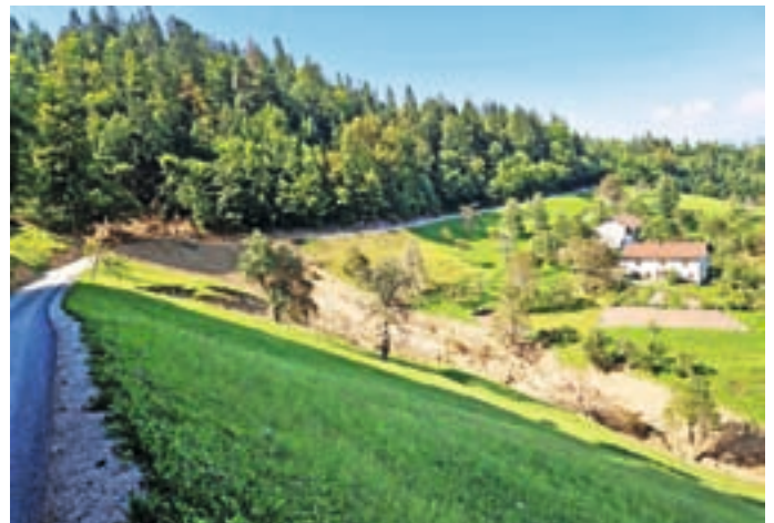
Prožili so se številni plazovi. Na sliki nekaj dni kasneje plaz na Osolniku.