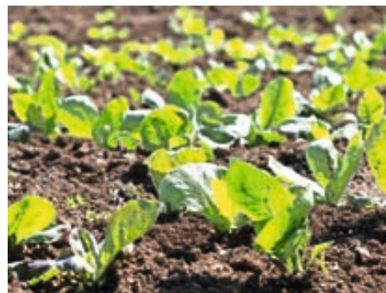
Pomembno je povečati samooskrbo z zelenjavo in sadjem.

Prihodnost je odvisna od nas. Glede na svetovno zamudo pri blaženju podnebnih sprememb teh ne moremo več ustaviti. Ni pa treba, da gre še na slabše. Prilagajanje je nujno tako pri infrastrukturi, pri prostorskem načrtovanju