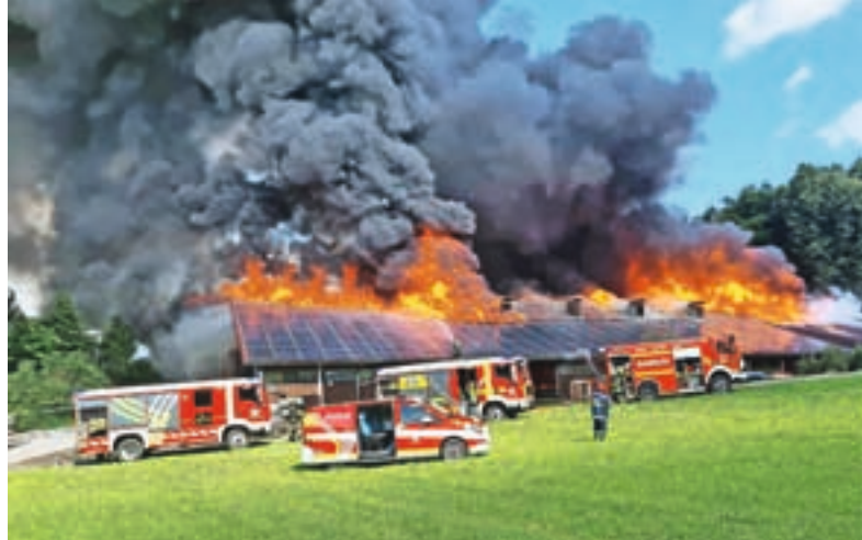
Požar na Kmetiji Mis je bil eden večjih doslej v medvoški občini.

»Danes okoli 13. ure smo bili obveščeni o požaru na enem izmed gospodarskih objektov v Zavrhu pod Šmarno goro. Na kraju posredujejo gasilci, ki požar večjega obsega na objektu velikosti 40 x 80 m, katerega streha je prekrita s sončnimi celicami, že gasijo. Policisti so kraj zavarovali in zbirajo prva obvestila. Po do sedaj znanem gre za gospodarsko poslopje, v katerem se je nahajala živina, skladišče sena in kmetijska mehanizacija, živina pa je rešena iz objekta. Ko bodo na kraju vzpostavljeni ustrezni pogoji, bodo kriminalisti pričeli z ogledom in ugotavljanjem vzroka za nastanek požara,« so s Policijske uprave Ljubljana zapisali v prvem sporočilu za javnost. Kasneje so ga dopolnili z informacijami, da vzrok za požar še