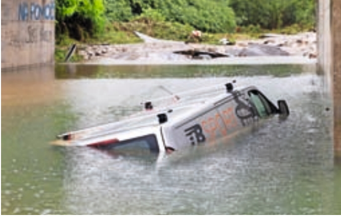
Zalit podvoz pod železniško progo v Goričanah, ki je še vedno zaprt

poplavljen. Iz Mercatorja so z vozički v zabojnik odvažali vse, kar je dosegla voda. Zaposlenim so kot prostovoljci pomagali tudi taborniki Društva tabornikov Rod dveh rek Medvode. »Grozno je, česa takšnega še nisem doživela. Taborniki smo pomagali že včeraj. Polnili smo protipoplavne vreče. Danes sem prišla okrog osmih zjutraj. Najprej smo pospravljali blato, naplavine, sedaj smo prišli še na pomoč v trgovino Mercator. Najbolj me boli, da moramo metati stran hrano.