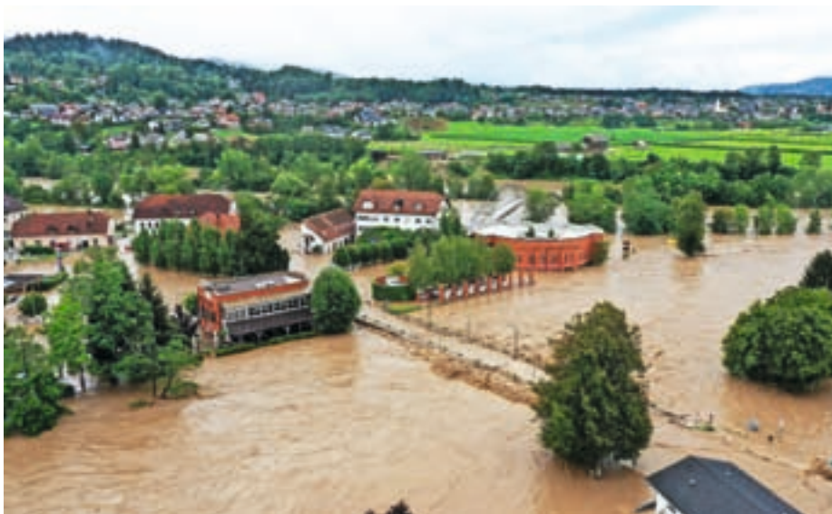
Poplavljen središče Medvod 4. avgusta 2023

Blagovni center na drugi strani Medvoške ceste je bil zaprt, saj je bil prav tako