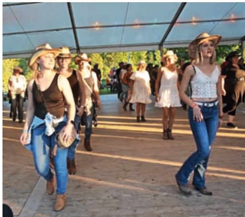
Ves konec tedna se je plesalo. Za Divji zahod sta značilna tudi kantri glasba in ples v vrstah.