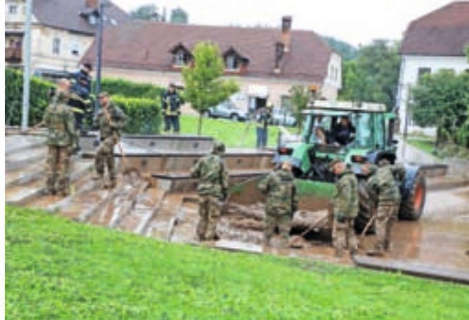
Sodelovanje vojske in gasilcev v središču Medvod

V poplavah so bila ogrožena tudi življenja živali. Predvsem za prostoživeče nikoli ne bo znano, koliko jih je v deroči vodi končalo svojo pot. Aktivirali so se tudi v medvoškem Društvu Reks in Mila in med drugim pomagali pri iskanju in nameščanju živali. Opozarjali so tudi na primerno reševanje živali ob poplavah. »Predvsem za mačke sem slišala tragične