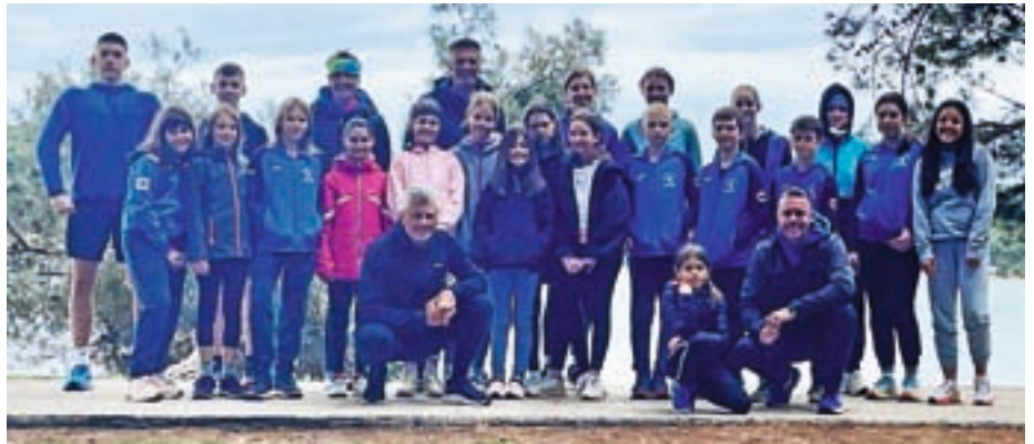
Člani Atletskega kluba Medvode na pripravah