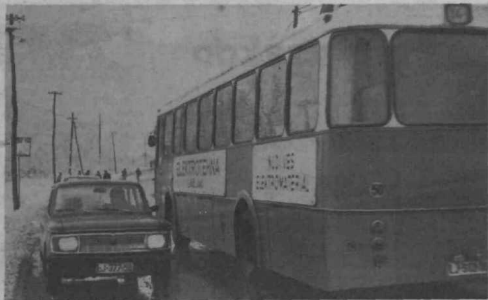
Je za dva dovolj prostora? Samo stisniti se je treba, pa gre. Z malo volje, potrpežljivosti in vpludnosti se tudi na ozki cesti v Savlje prav lahko srečata avtobus in osebni avto. Mord bi bilo razen na najožjih mestih dovolj prostora tudi za srečanje dveh večjih vozil. Pešci morajo v takih primerih sicer v sneg, zato je razumljiva tudi njihova želja po razširitvi ceste in ureditvi hodnikov za pešce.