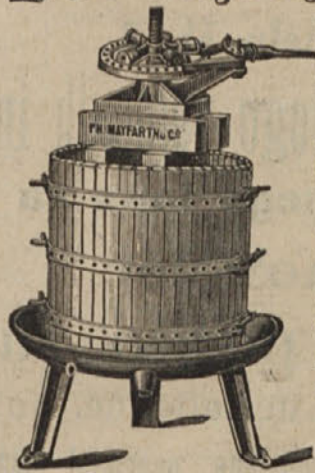
Stiskalnica za grozdje.

so naše „HERCULES“-stiskalnice najnoveje in najizvrstneje mehanične gestave z dvojnatinim, vedno delujočim pritiskalom; zagotavlja se skrajna vporabljenost, katera nadmašuje vse druge stiskalnice.