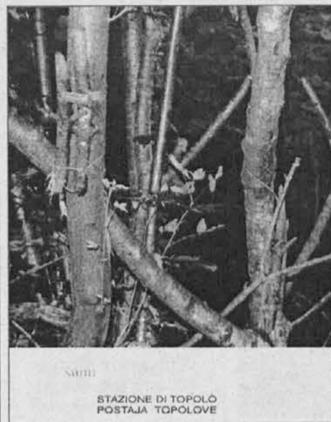
Particolare della copertina del cd "Sumi"

C'erano anche le Valli del Natisono al Salone Internazionale della Musica che dall'8 al 13 ottobre ha animato gli spazi del Lingotto di Torino.