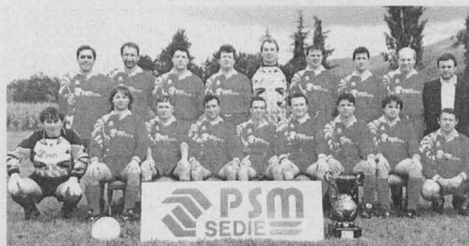
La squadra degli over 35 della Polisportiva Valnatisone sponsorizzata dalla Psm sedie

Il Real Filpa di Pulfero è stato costretto al pareggio casalingo, con un risultato ad occhiali, dai Warriors di Laipacco.