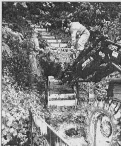
Na cesti za Crnivrh gradijo zasilne stopnice mimo udara

Velika javna dela so pravzaprav potrebna povsod. Dežela je vsekakor zagotovila najprej intervencije na plazovitih območjih v okolici Cente, v občini Podbonec in v Nemah. Prednost naj bi imeli kraji, ki jih je treba rešiti iz izolacije in hribovita pobočja, kjer je nevarnost novih plazov.